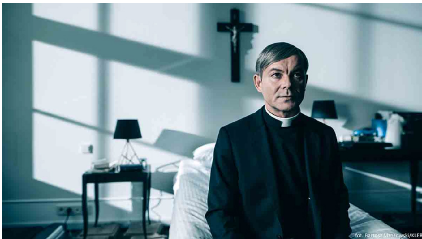
Jacek Braciak w filmie „Kler”, fot. materiały prasowe.