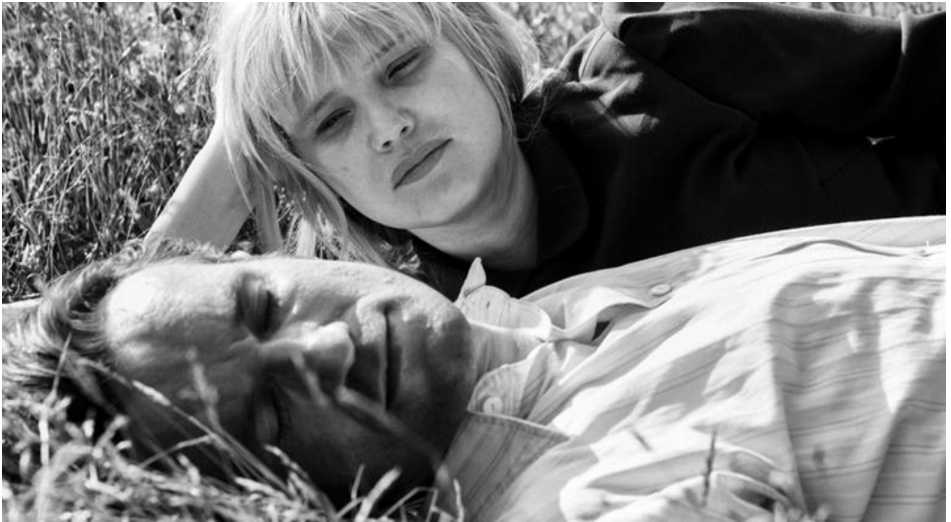
Joanna Kulig i Tomasz Kot w filmie „Zimna wojna”, fot. materiały prasowe.