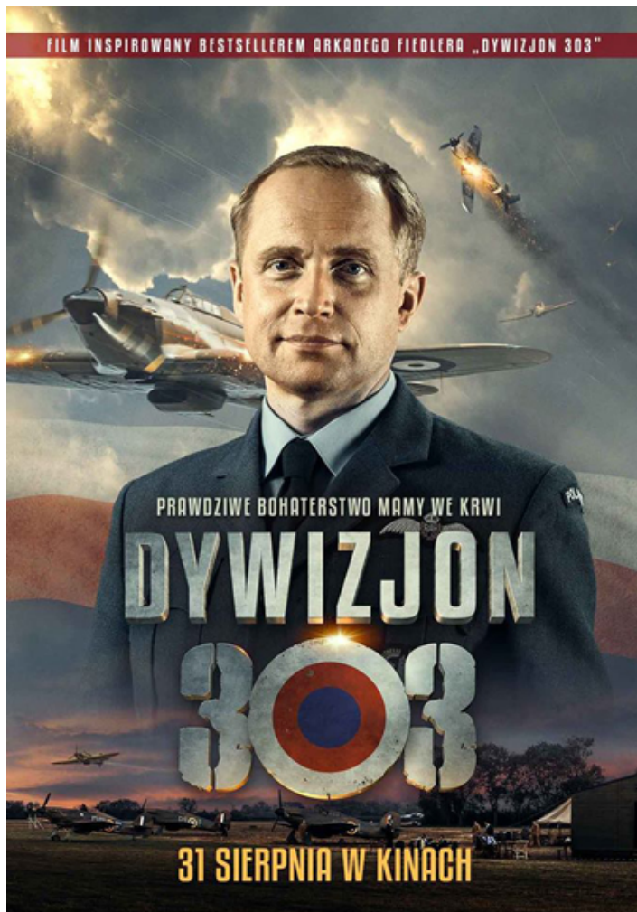
Piotr Adamczyk jako Witold Urbanowicz w filmie „Dywizjon 303”.