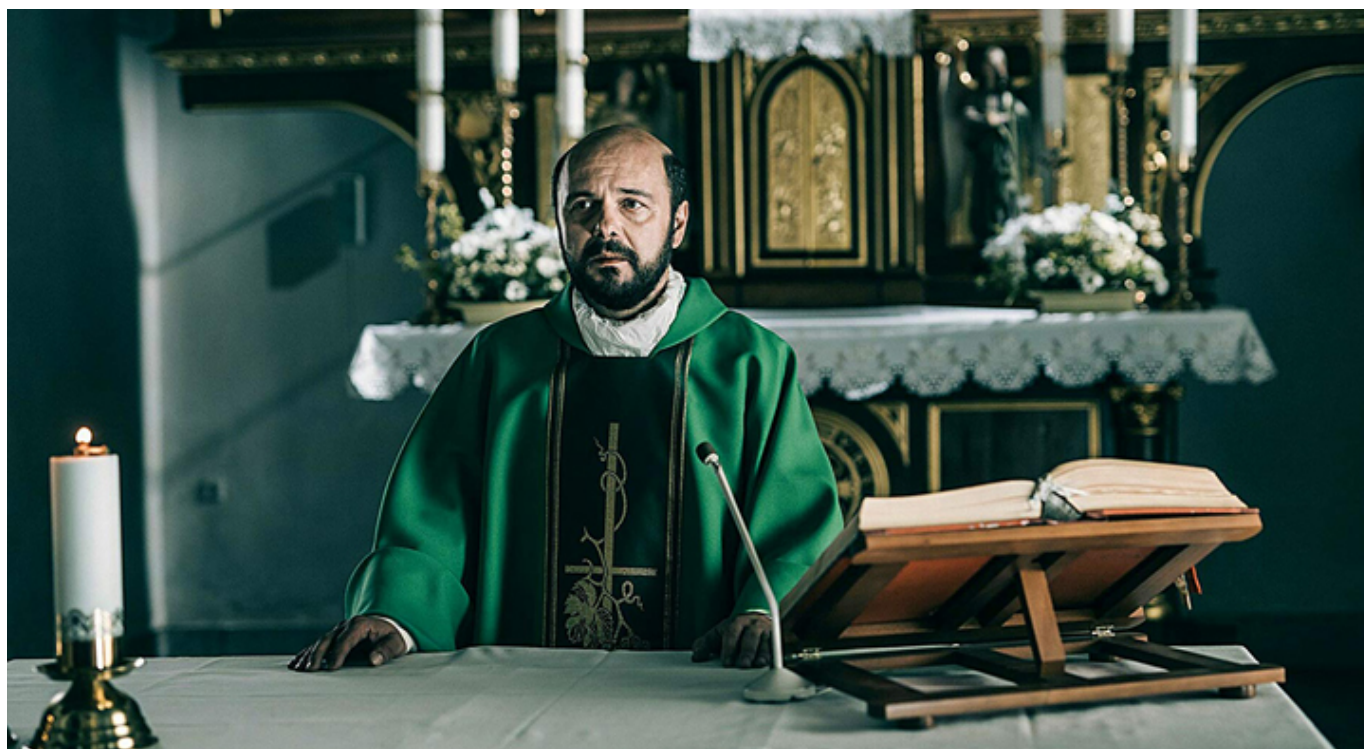
Arkadiusz Jakubik w filmie „Kler”, fot. materiały prasowe.