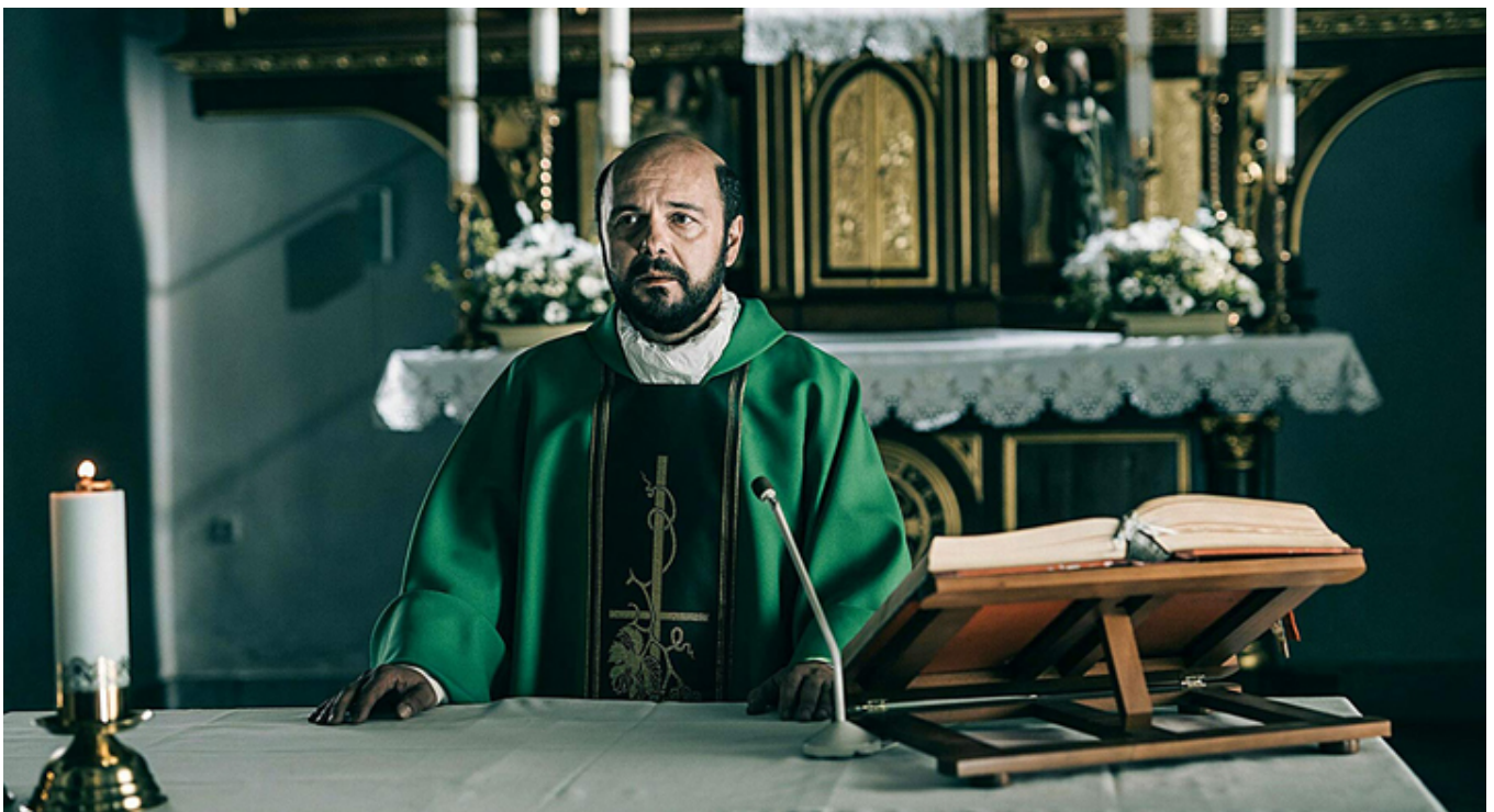
Arkadiusz Jakubik w filmie „Kler”, fot. materiały prasowe.