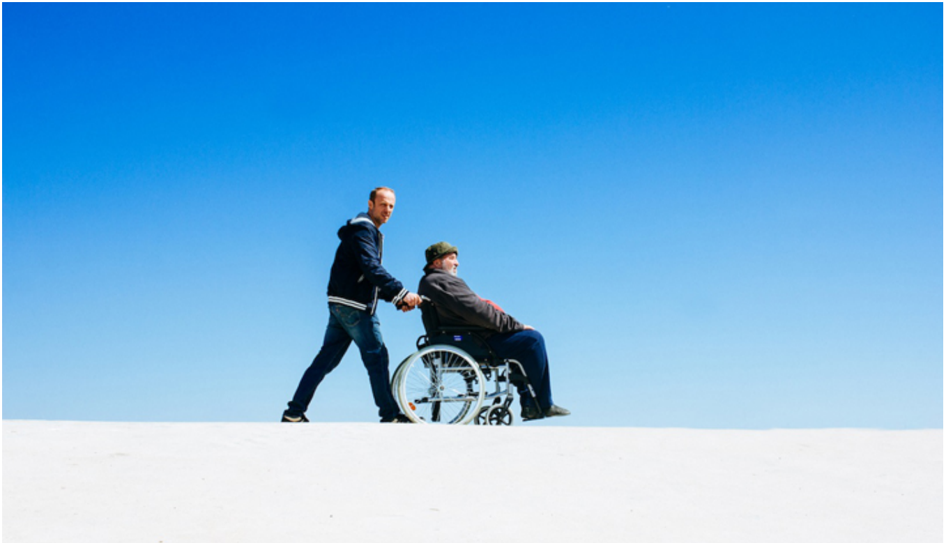
Kadr z filmu „Ja i mój tata”, fot. materiały prasowe.