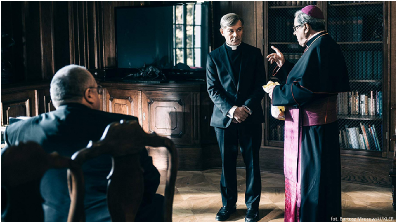
Kadr z filmu „Kler”, fot. materiały prasowe.

Oprócz filmów fabularnych, podczas festiwalu będą też pokazywane filmy dokumentalne, filmy dla dzieci, będzie