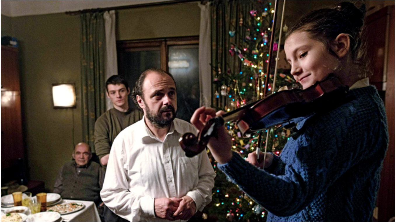
Kadr z filmu „Cicha noc”, fot. materiały prasowe.