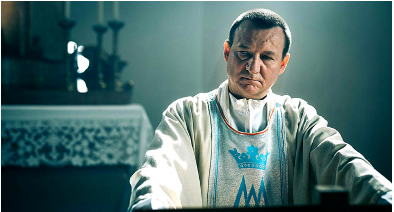
Robert Więckiewicz w filmie „Kler”, fot. materiały prasowe.