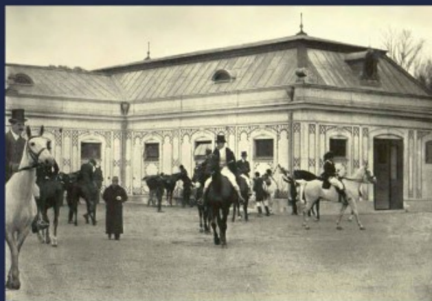
wyjazd na polowanie z pod stajni, Wieś Ilustrowana 1911