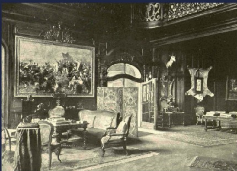
hall pałacowy - obraz Brandta „Hetman St. Rewera Potocki pod Beresteczkiem”