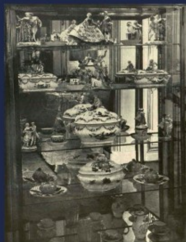
witryna ze starą porcelaną korecką i saską w salonie Wieś Ilustrowana listopad 1911