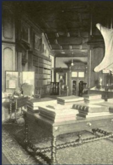
przejęcie z hallu do biblioteki