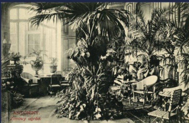
Antoniny - ogród zimowy przy pałacu, pocztówka

Wszystko to przestało istnieć po pożarze pałacu antonińskiego w sierpniu 1919 roku