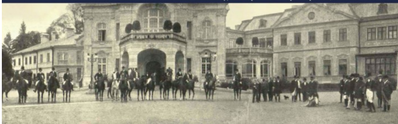
wyjazd na polowanie z przed pałacu, Wieś Ilustrowana