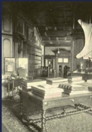
przejście z hallu do biblioteki