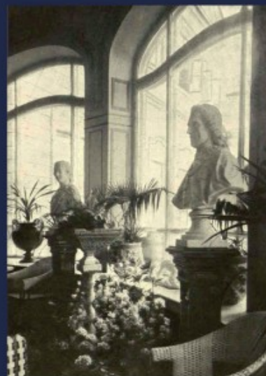
popiersia króla Stanisława Augusta i prymasa Poniatowskiego