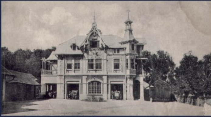
Antoniny - garaże i warsztaty samochodowe, pocztówka ok. 1910 r.