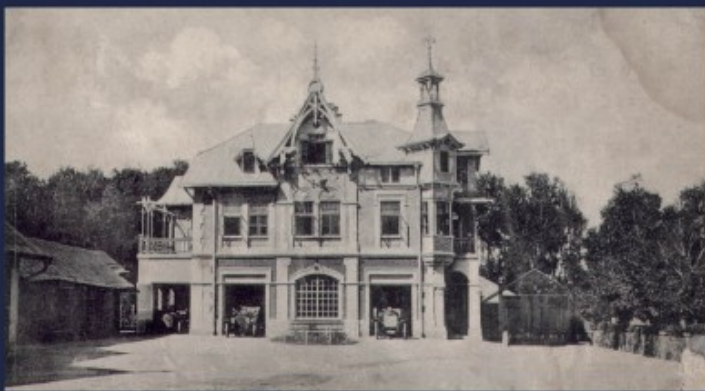
Antoniny - garaże i warsztaty samochodowe, pocztówka ok. 1910 r.