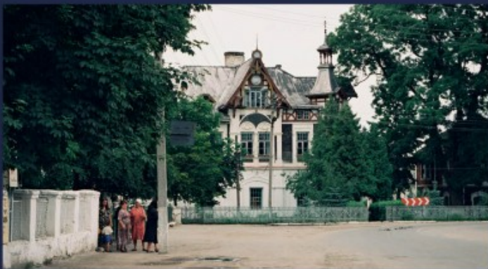
Antoniny - garaże i warsztaty samochodowe 1997 r.