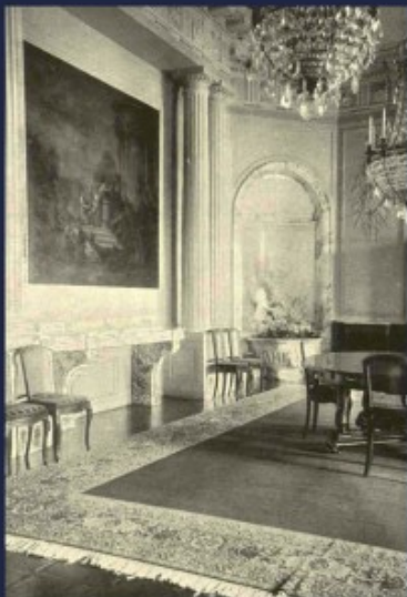
Antoniny - jadalnia