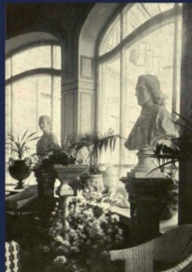
popiersia króla Stanisława Augusta i prymasa Poniatowskiego