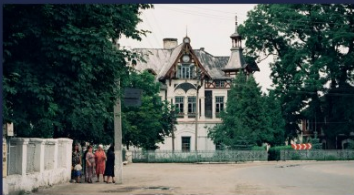
Antoniny - garaże i warsztaty samochodowe, fot. W. Żurawski 1997 r.