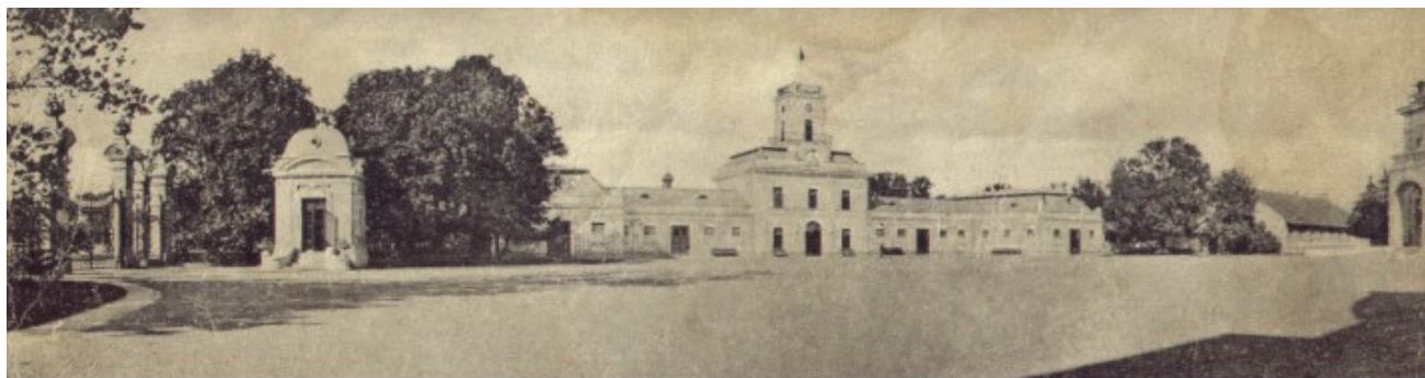
Antoniny - widok na stajnie od strony pałacu, po lewej brama główna i „szwajcarka” (kordegarda)