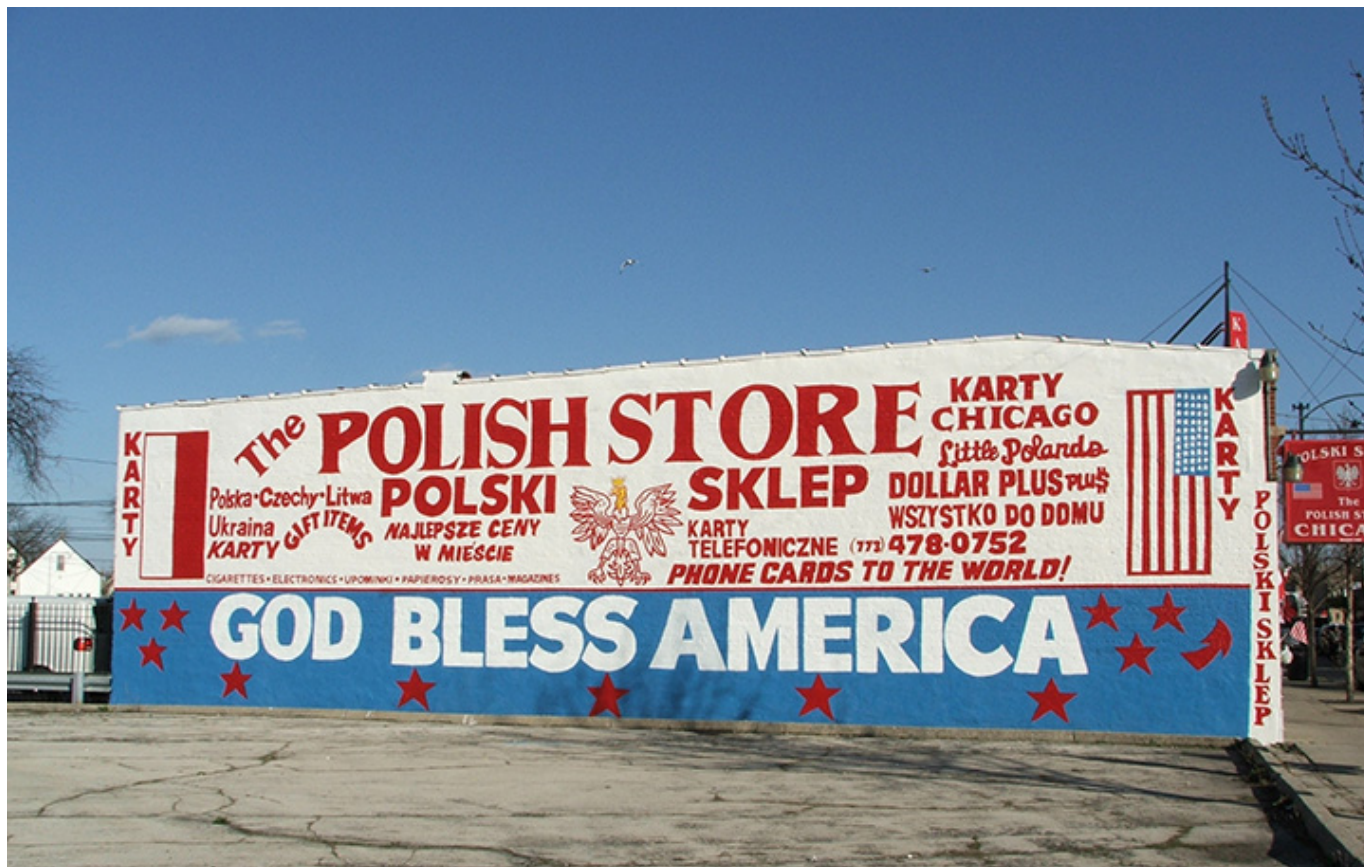
Chicago, fot. A. Lizakowski

Przeżycia osobiste opisanych przez nas osób, wybitnych Polaków w pewnym stopniu powinny oddać posmak i charakter Ameryki z przełomów XVIII w i XIX oraz tej z przełomu XIX i XX wieku. Wiele spostrzeżeń sprzed dwustu czy stu lat wciąż jest aktualnych. Wiele motywów wyjazdu z kraju, opuszczenia go jest wciąż mino upływu tak wielkiego czasu bardzo podobna. Podobne są też początki i kłopoty adopcyjne. Najpierw jest wielka chęć wyjazdu za wielką wodę, szukanie tam jakby ratunku od problemów codzienności we własnym kraju, wiara, że tam będzie lepiej. Po przyjeździe następuje stres, rozczarowanie, jakiś wewnętrzny ból, i dla wielu przekonanie, że jednak dokonali złego wyboru, powinni zostać u siebie. Zbyt wielkie widzą różnice, może nawet przeżywają szok kulturowy. Mijają najpierw miesiące i lata emigrant staje się coraz bardziej „odporny na Amerykę” osamotnienie, zostaje zastąpione pracą, ciężką pracą na dodatek mało płatną która pochłania większą część życia.