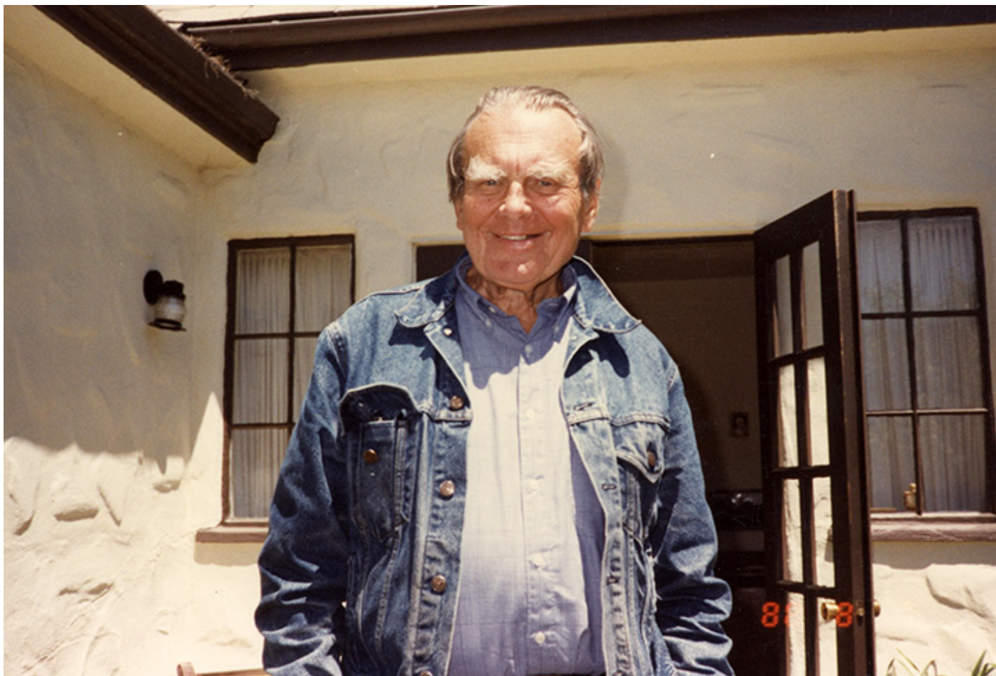
Czesław Miłosz w Berkeley