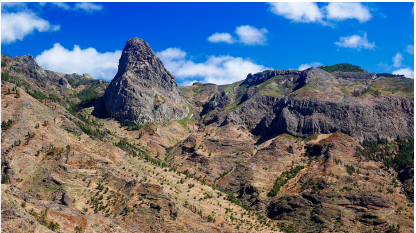
Gomera. Ostaniec Agando.

Historia odgrywa we wstępie i w całym Atlasie ogromną rolę, gdyż kulturze dawnych