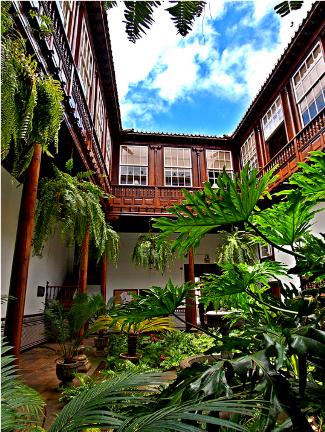
Dziedziniec kanaryjski w La Laguna (Teneryfa).