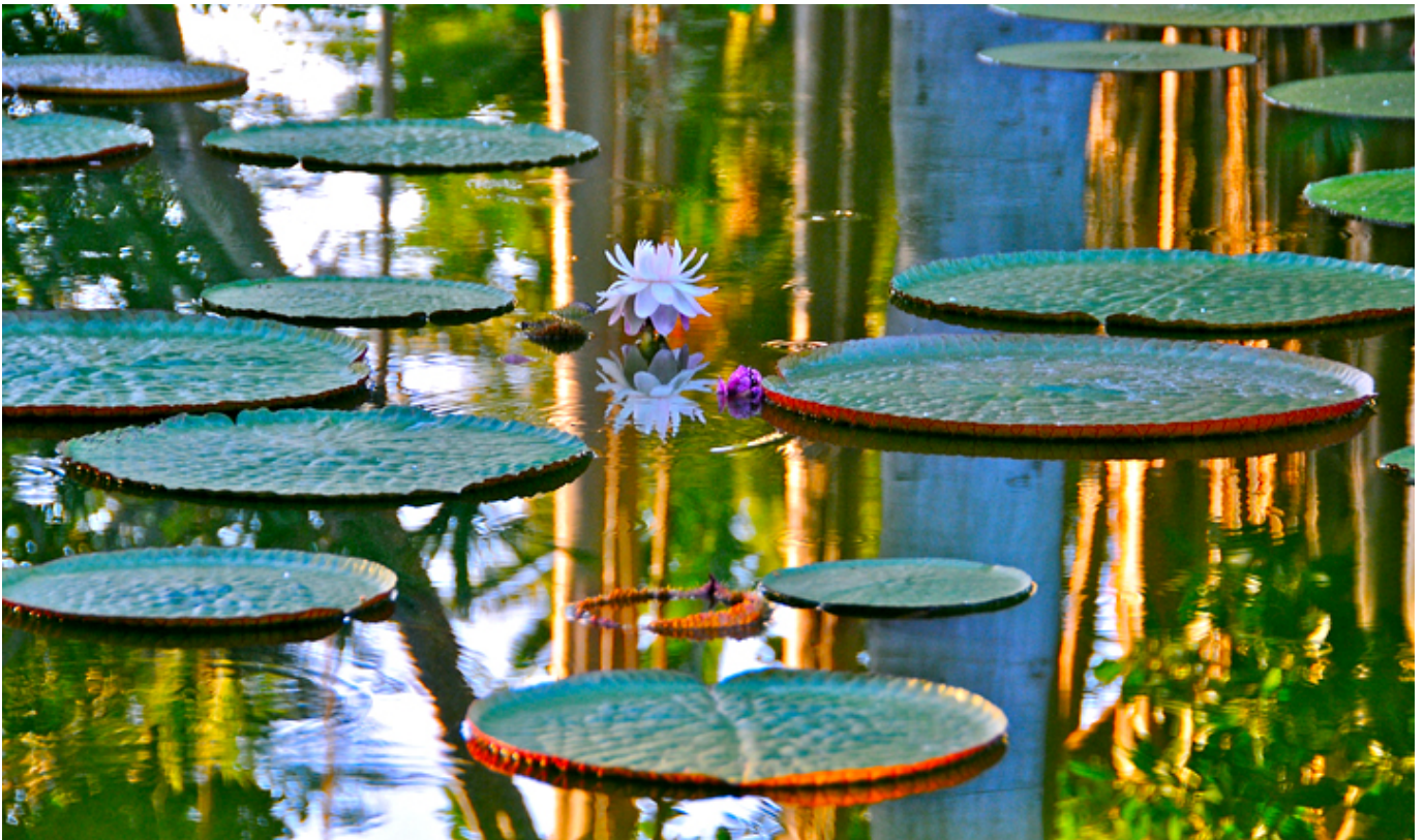
Ogród Botaniczny. Puerto La Cruz. Teneryfa.