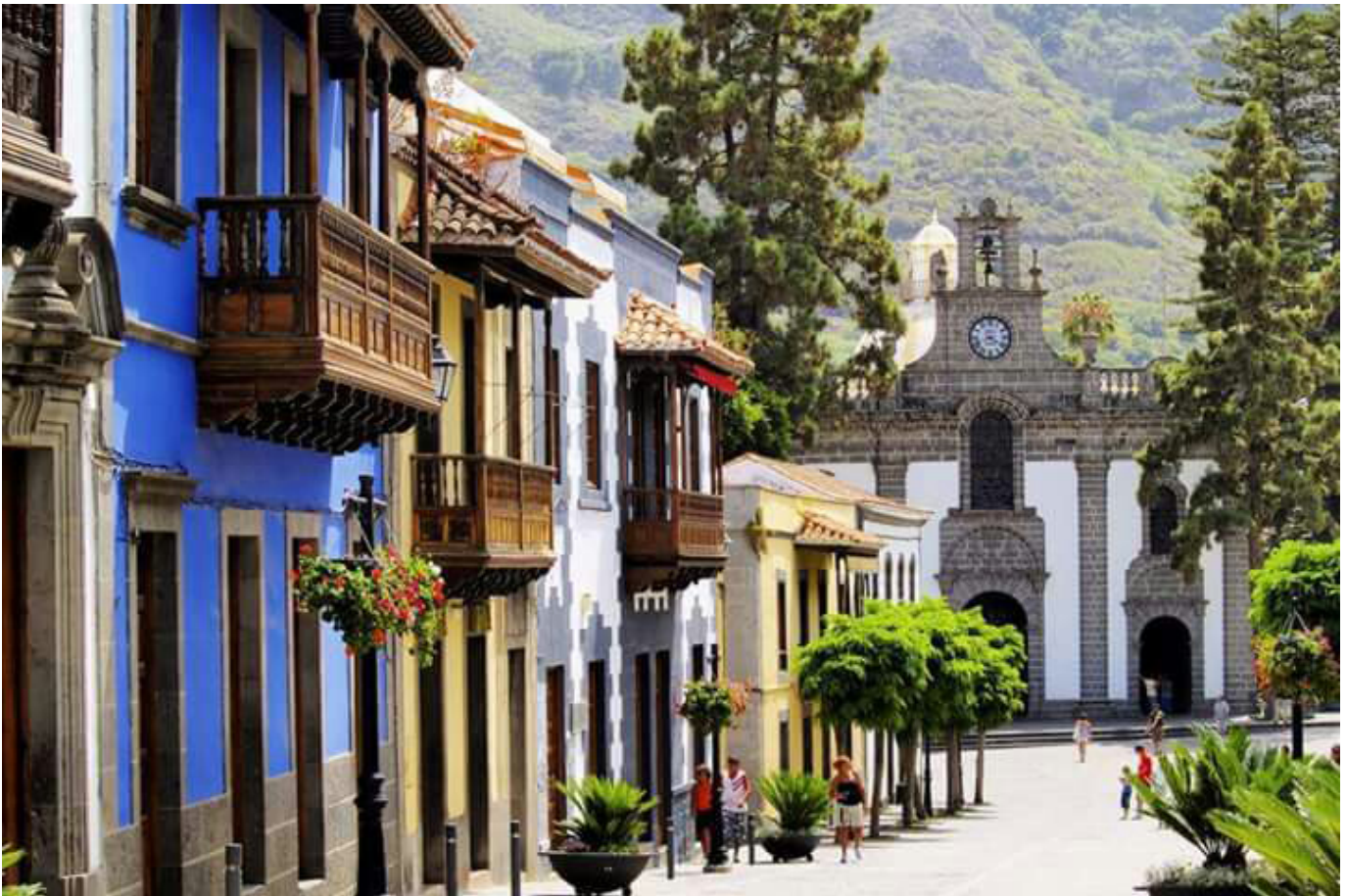
Teror. Gran Canaria.