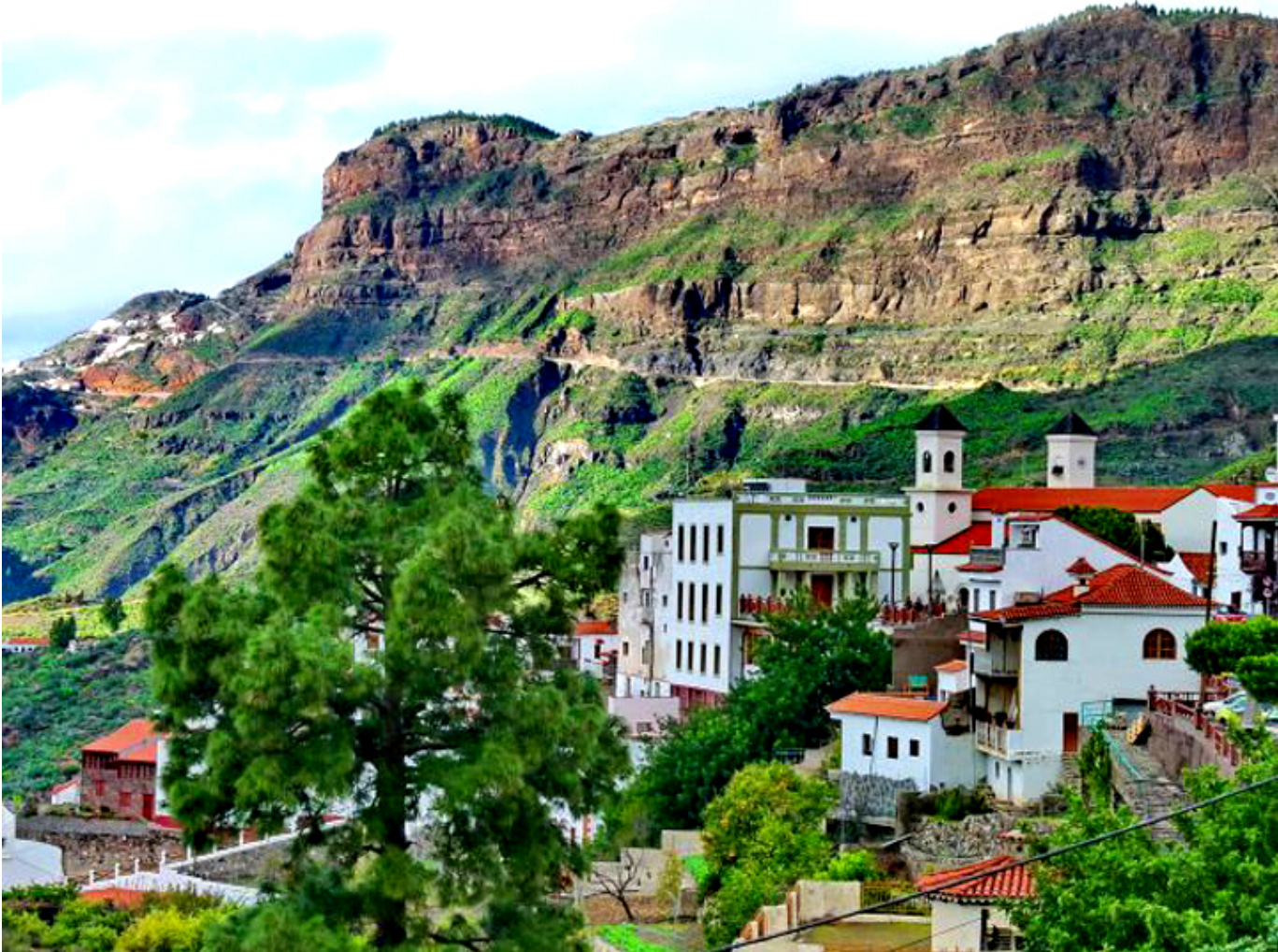
Tejeda. Gran Canaria.