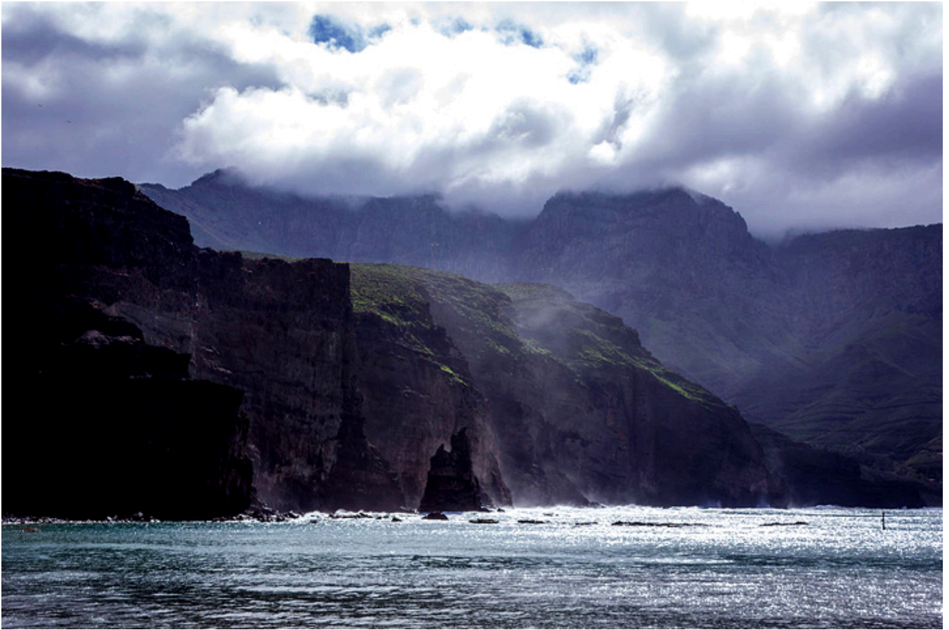
Wybrzeże w Parku Naturalnym Tamadaba. Gran Canaria.