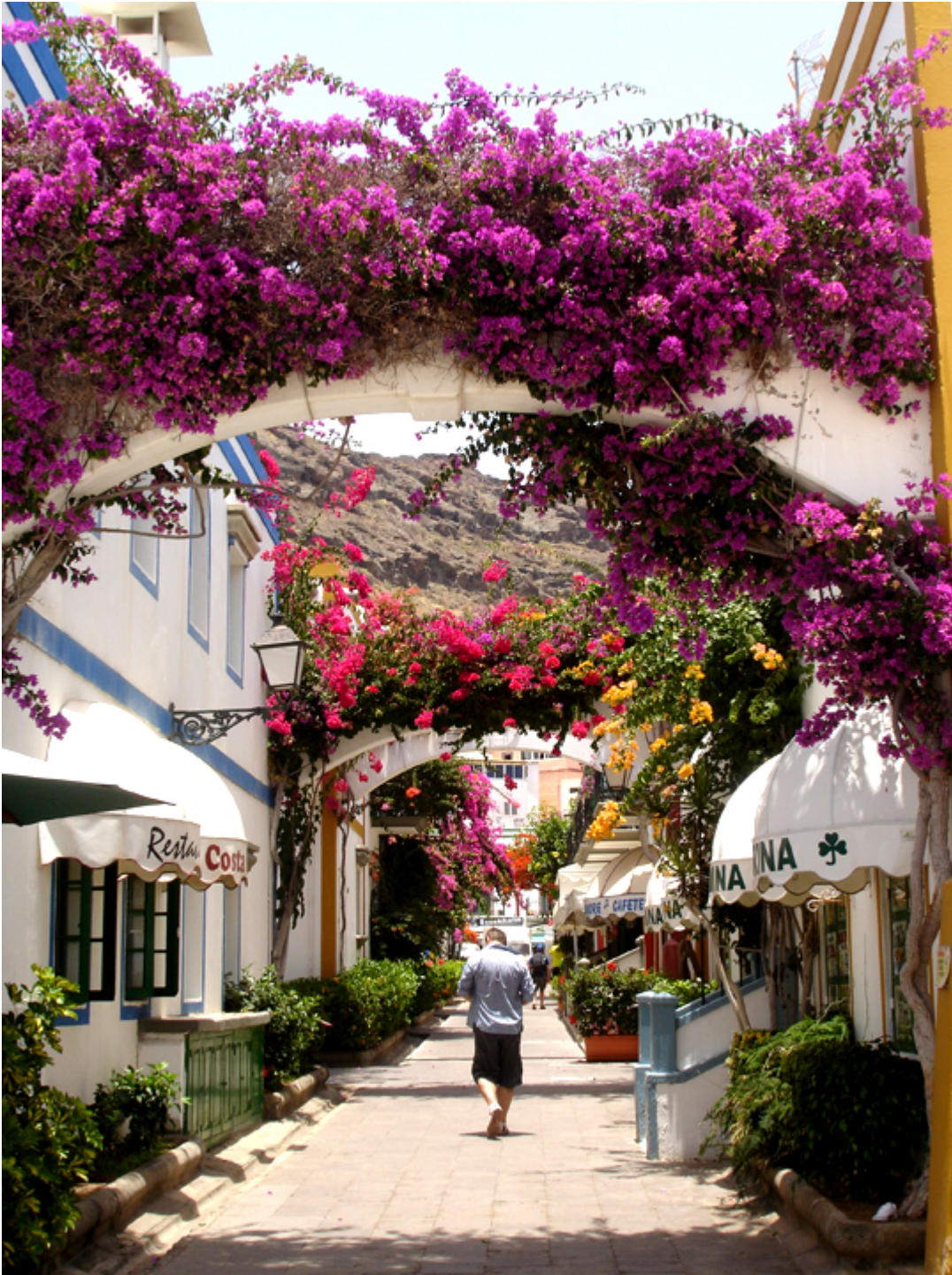
Puerto de Mogán. Gran Canaria.