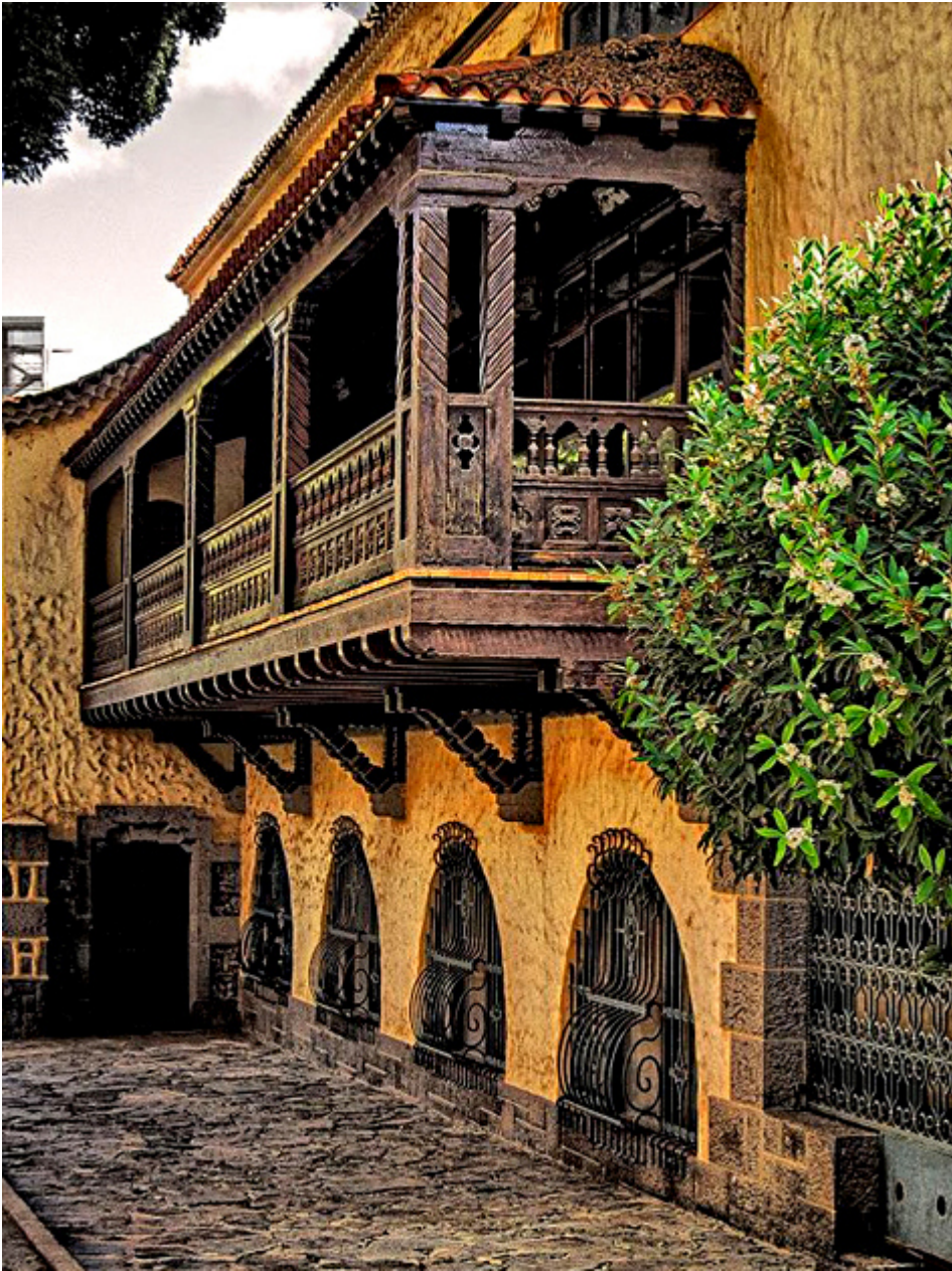
Balkon kanaryjski. Las Palmas de Gran Canaria.