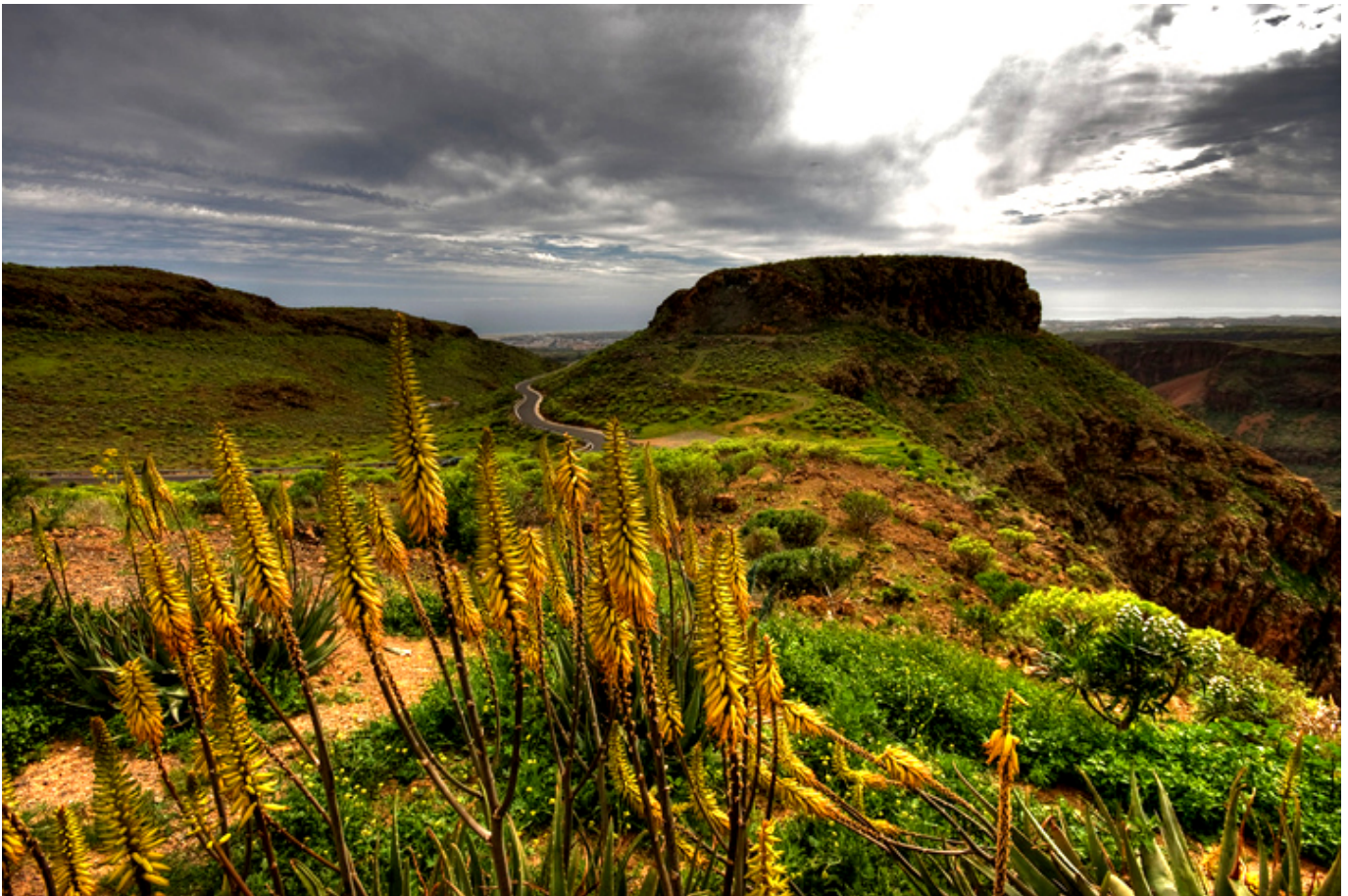
Punkt widokowy Klacze. San Bartolomé de Tirajana. Gran Canaria.