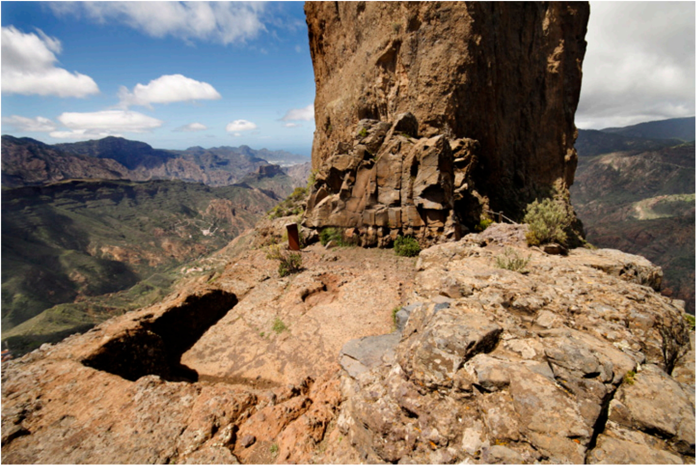
Almogarén, czyli miejsce kultu przy ostańcu Bentayga. Gran Canaria.