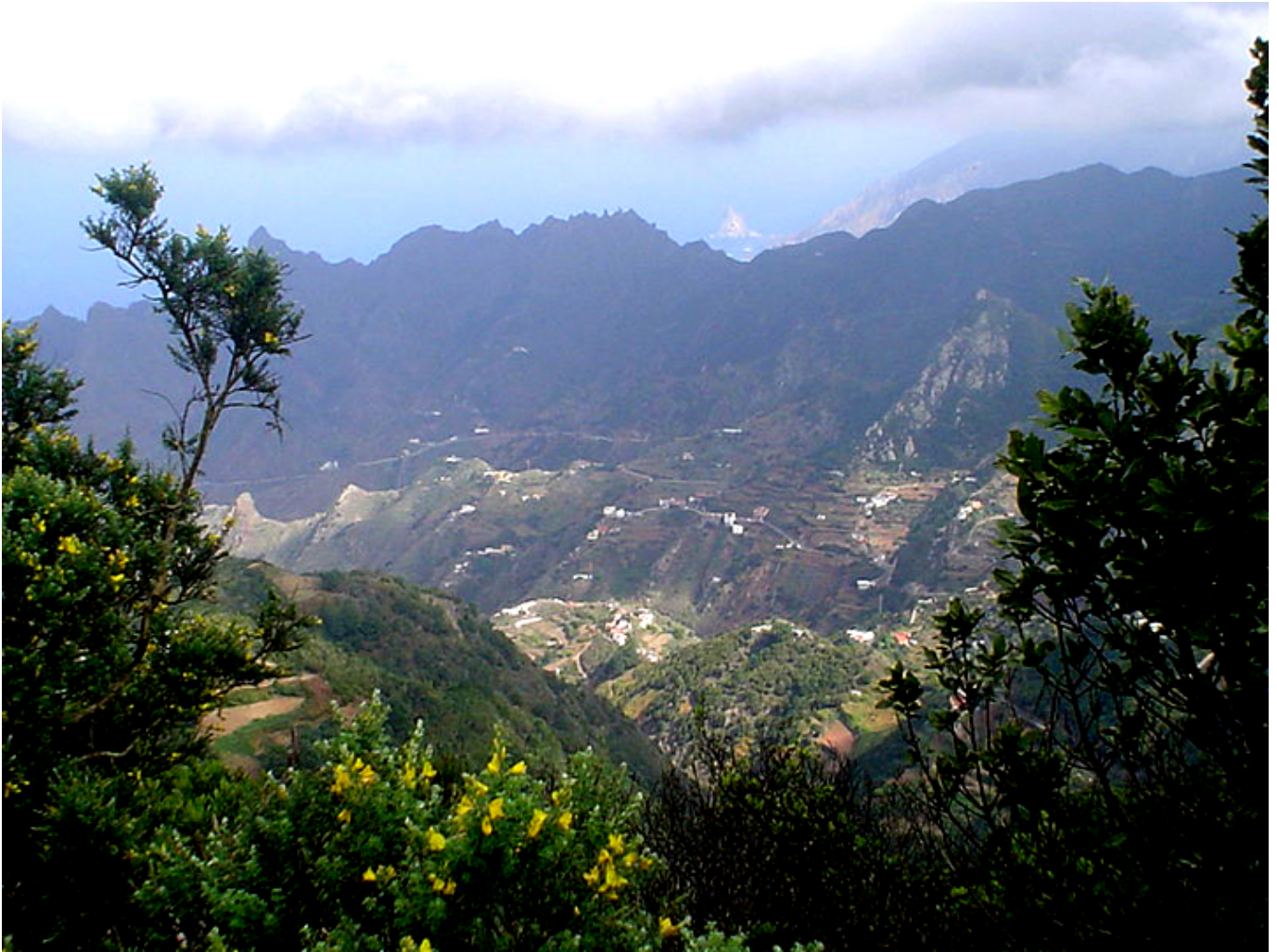
Góry Anaga na Teneryfie ze szczytu Pico del Inglés.