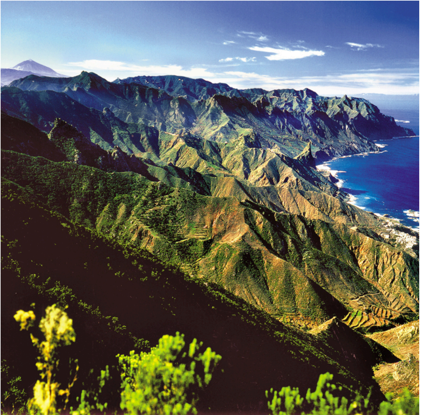
Góry Anaga. Teneryfa.