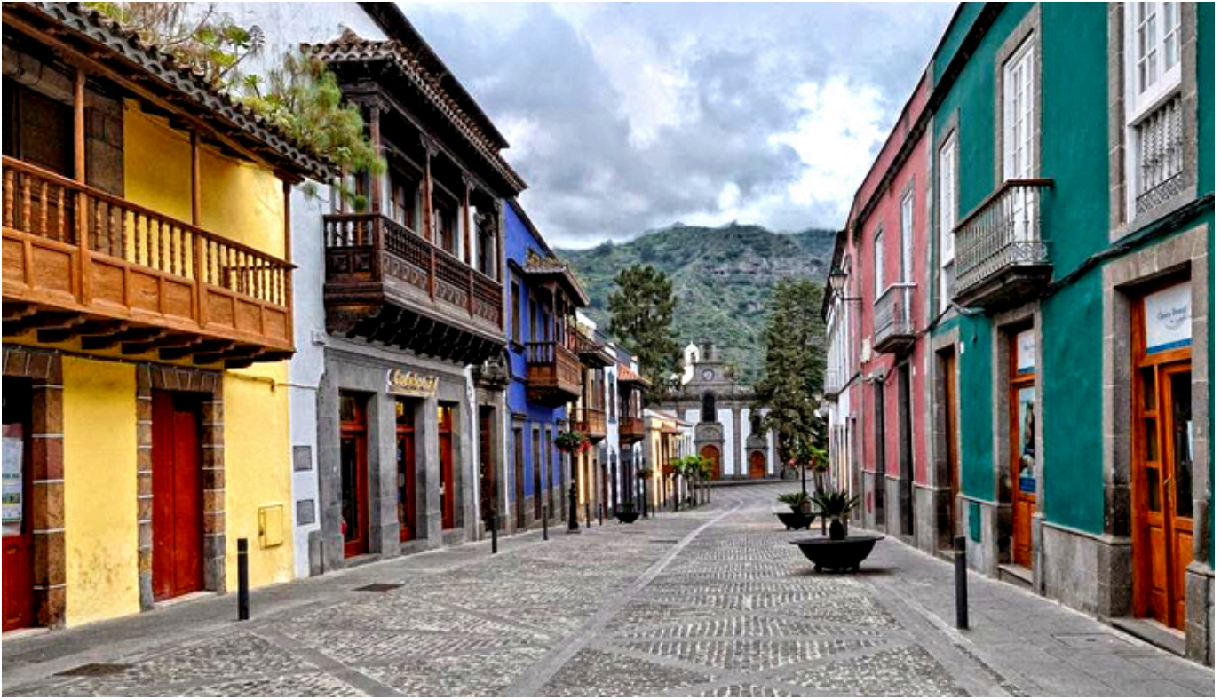
Miasto Teror na w.yspie Gran Canaria