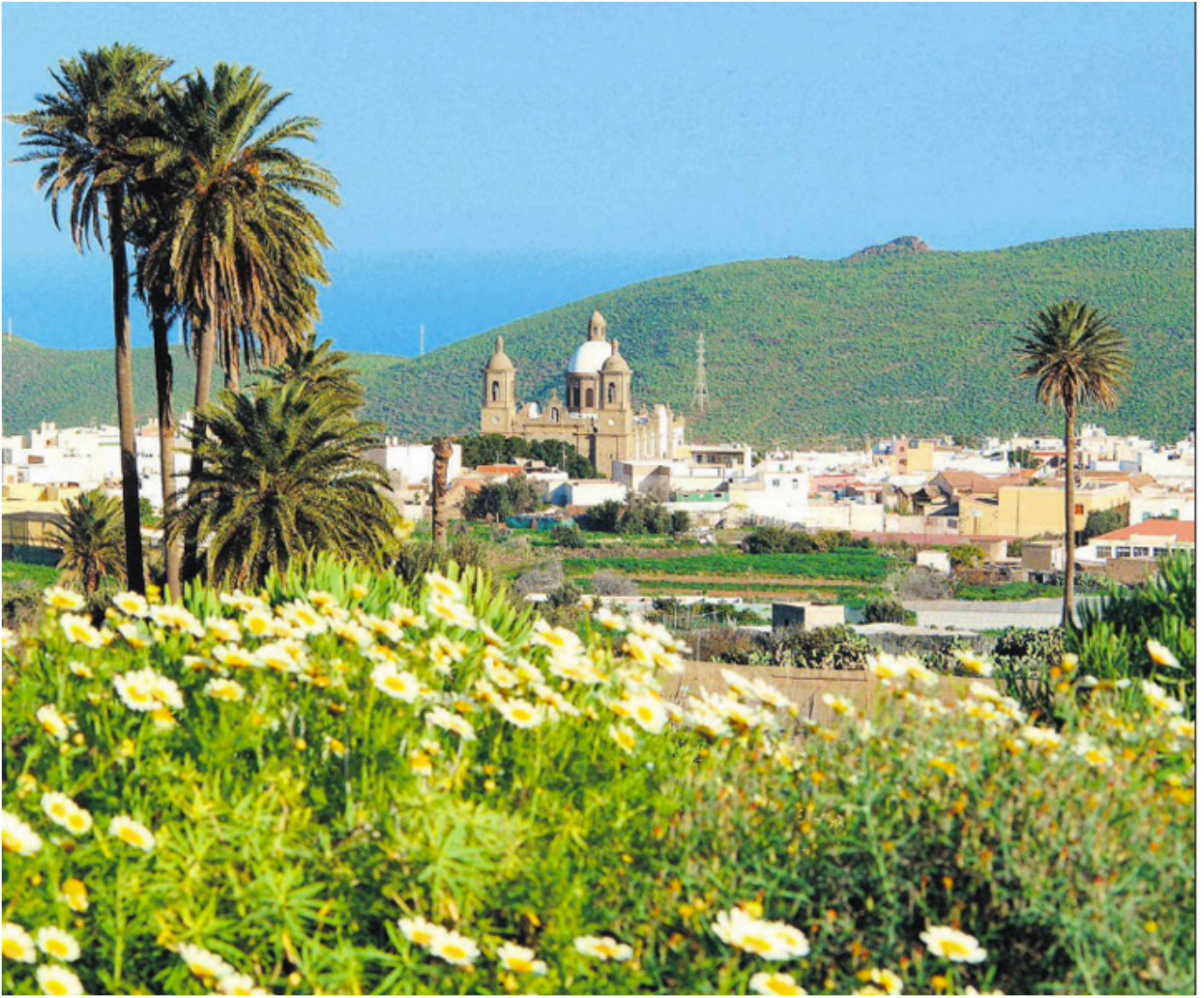
Agüimes. Gran Canaria.