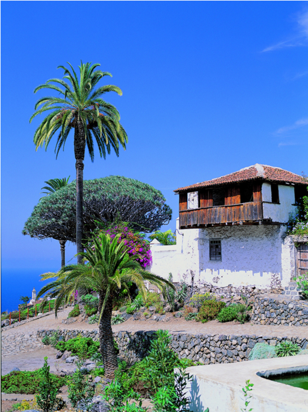
Tradycyjny dom na wyspach.