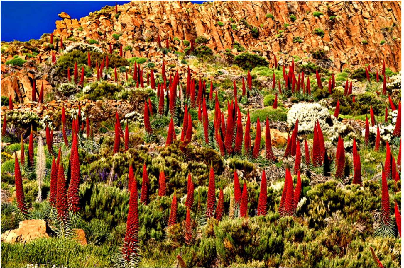
Żmijowiec rubinowy ( Echium wildpretii ).