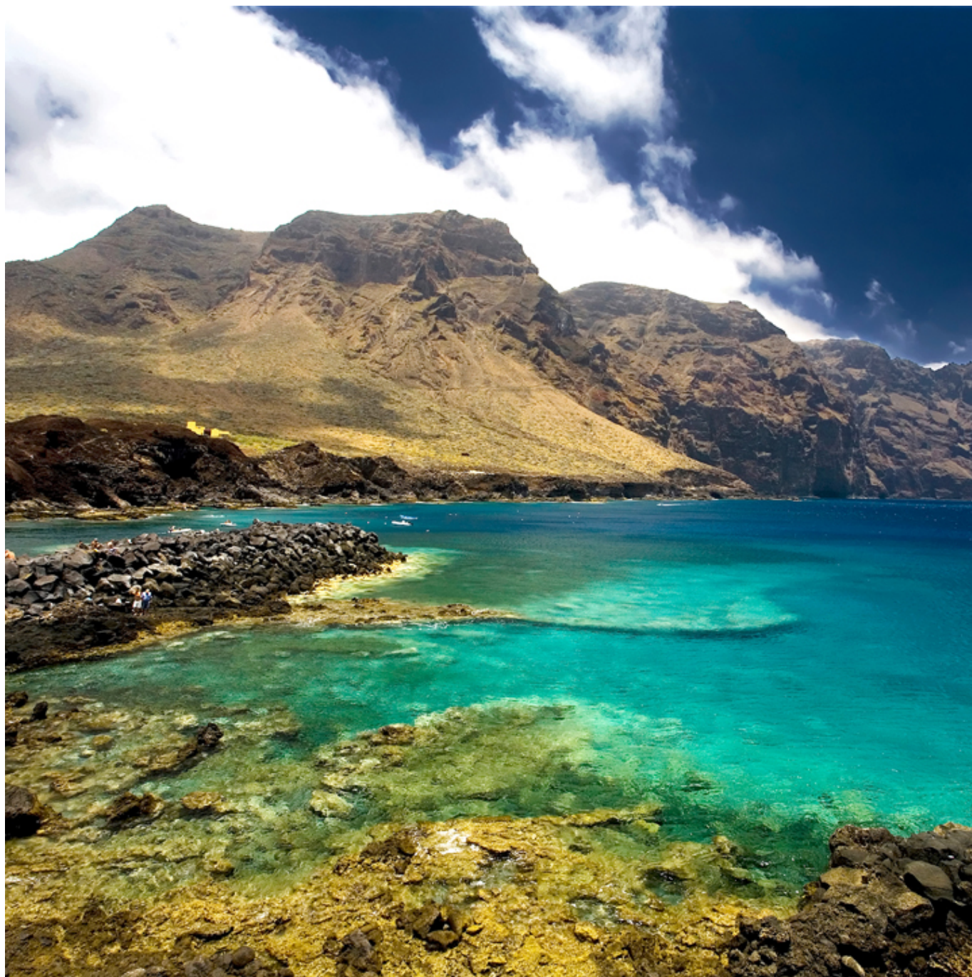
Punta de Teno. Teneryfa.