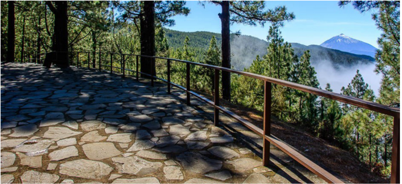
Punkt widokowy Ortuño na Teneryfie.