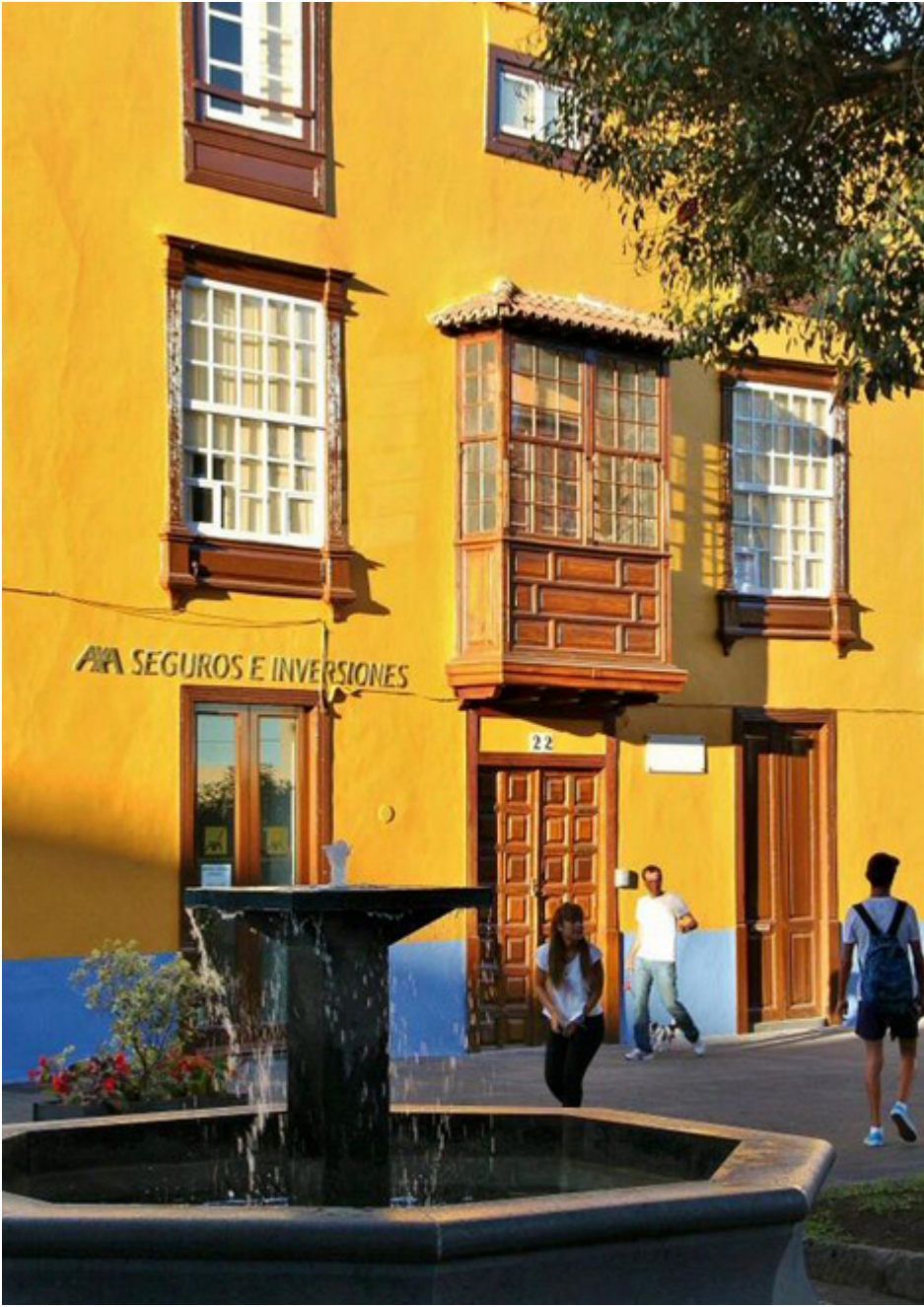
San Cristóbal de La Laguna. Teneryfa.