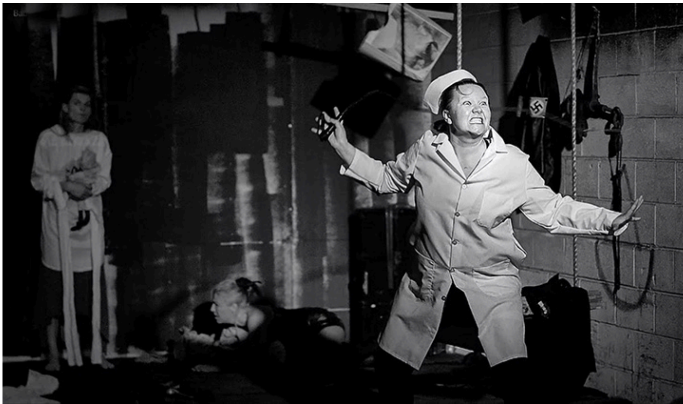
Teatr Nasz, „Bal w operze” Juliana Tuwima

czarnym, skórzanym kostiumie, która władczy gestem strzela z bata, jakim tresuje się dzikie zwierzęta. Nie ma wątpliwości, jesteśmy pod nadzorem.