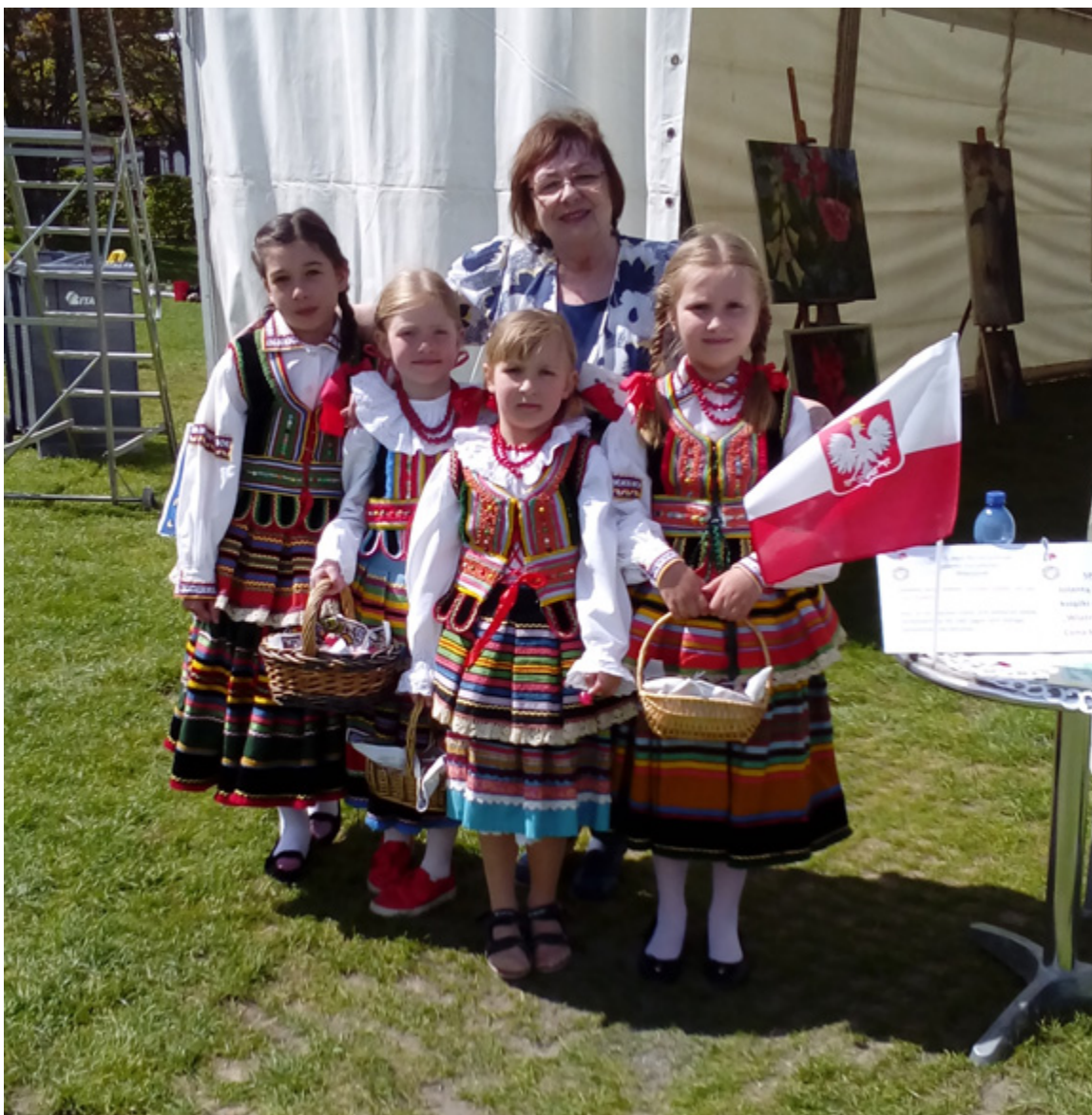
Autorka w Szwecji 5 maja 2018 r. Rocznica Niepodległości Polski w Malmo.

Mieszka Pani w Polsce, ale współpracuje z wieloma polonijnymi organizacjami. Jest Pani członkiem Związku Pisarzy Polskich na Obczyźnie z Londynu. Jest Pani także wiceprzewodniczącą Komisji Współpracy z Polonijnymi Dziennikarzami i Pisarzami na terenie USA i Unii Europejskiej z ramienia Światowego Stowarzyszenia Dziedzictwa Kulturowego Polonii. Jest także Pani członkinią honorową w Asocjacji Kobiet Polskich Polka