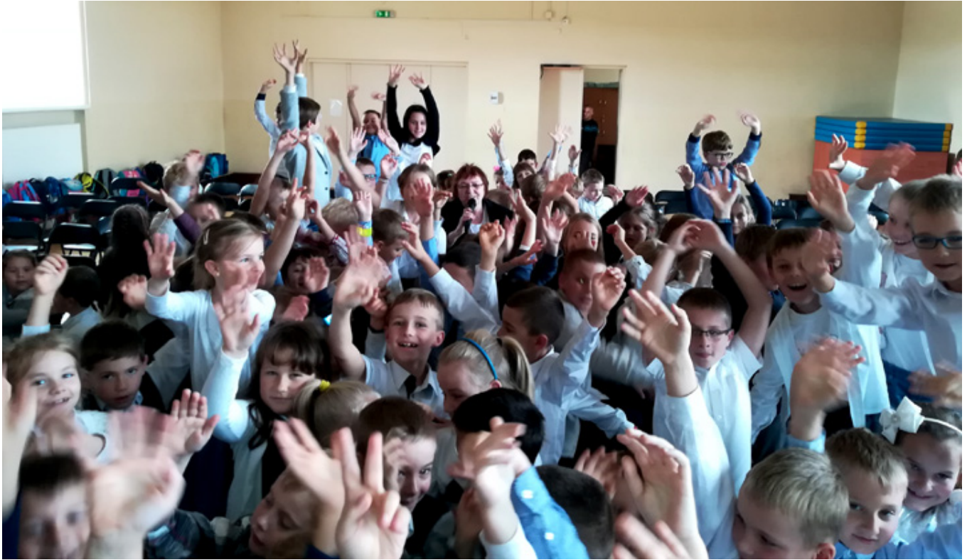
Spotkanie z dziećmi w szkole w Tarnowie, październik 2017 r.