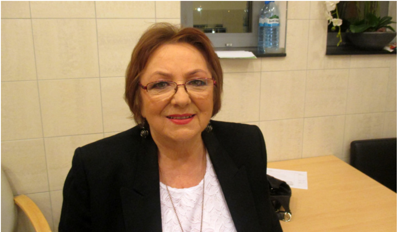
Wywiad w TV Polonia, październik 2017 r.