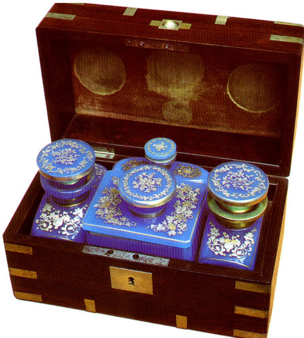
Nesener podróżny w stylu biedermeier, Austria, XIX w, fot. Mariusz Widerynski.

„uzbrojonego” wyglądu. W gruncie rzeczy te wielkie i ciężkie, wieloosobowe pojazdy z fabryki Schustala-Nesselsdorf w Czechach odznaczały się szczególną elegancją. Pozorne resory stojące stwarzały wrażenie luksusu swoją archaizowaną konstrukcją. Skórzane błotniki, tapicerowane materace kryte modnym wówczas „manchesterem” w kolorze piaskowym dawały wygodę jazdy. Specjalny daszek brezentowy osłaniał panie przed nadmiarem słońca. Lubiły towarzyszyć męskim rozrywkom, podziwiać odwagę i refleks, ale również zażywać własnych emocji. Najmilszą perspektywę zapewniał powrót z polowania, gdy w ciepłe kominka i zaciszu myśliwskiego pałacyku w Julinie rozprawiano o męstwie, ryzyku, pełnych grozy i napięcia scenach przeżytych w kniei.