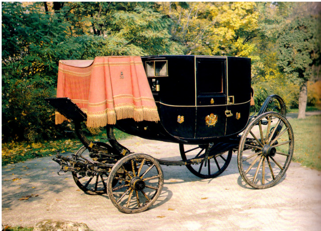
Kareta galowa berlina, Marker i Karasch, Wiedeń, I poł. XIX w. Na stopniach przy koźle data „1830” i monogram „H.W.”, fot. Jerzy Jawczak.