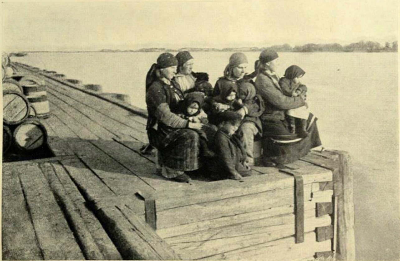
Астраханское Отдѣленіе. Бѣженцы на Волгѣ передъ отправкой въ села.

Bieżeńki nad Wołgą, fot. z książki „Bieżeństwo 1915”.