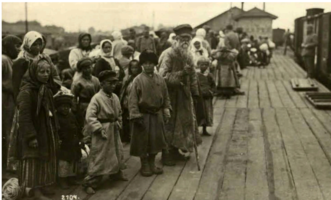
Lubelski Bełc - Rawa Ruska, fot. z książki „Bieżeństwo 1915”.