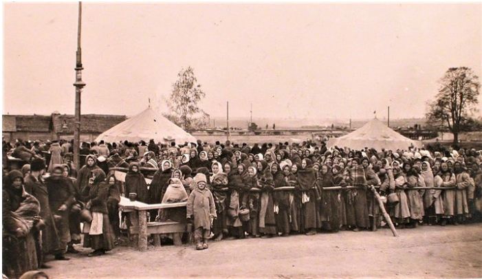
Bieżeńcy na jednym z postojów, fot. z książki „Bieżeństwo 1915”.

Książka Anety Prymaki-Onyszk: „Bieżeństwo 1915. Zapomniani uchodźcy” ukazała się w Wydawnictwie Czarne.