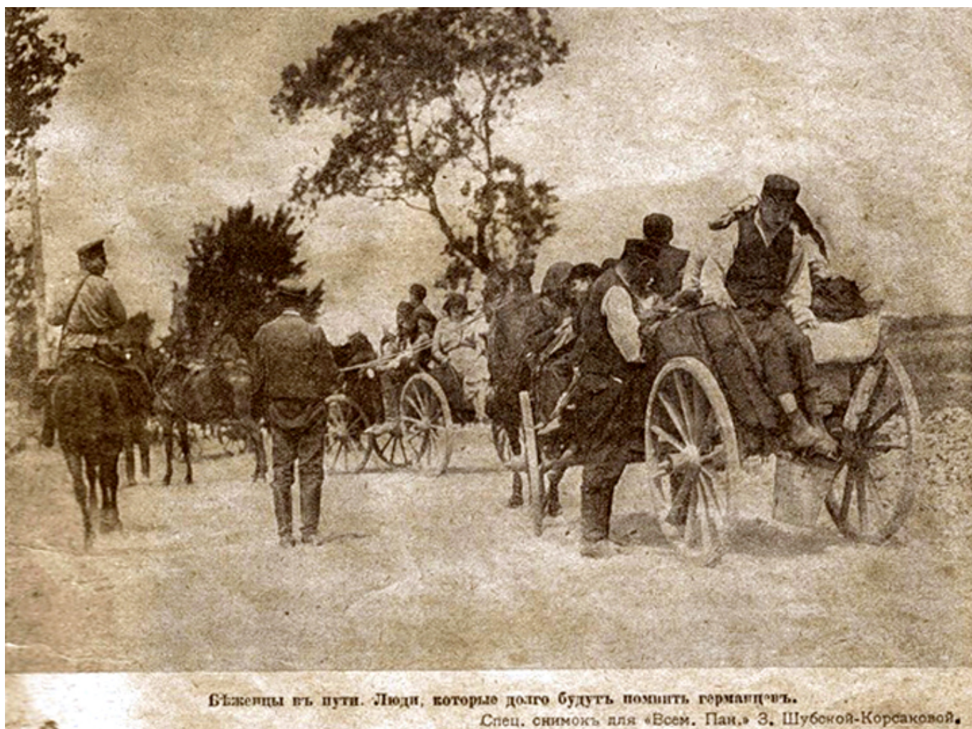
Bieżeńcy, 1915 r, fot z książki „Bieżeństwo 1915”.

ukazując, jakie straty ponieśli ludzie w sferze duchowej i psychicznej. Czytając ten fascynujący reportaż, stajemy się świadkami i niejako „uczestnikami” jej dramatycznej opowieści, budzącej zarazem refleksję nad meandrami historii. Książka otrzymała już szereg znaczących nagród, m.in. nominację do Nagrody im. Ryszarda Kapuścińskiego 2017, Nagrodę Literacką im. Wiesława Kazaneckiego oraz Nagrodę Literacką Miasta St. Warszawy.