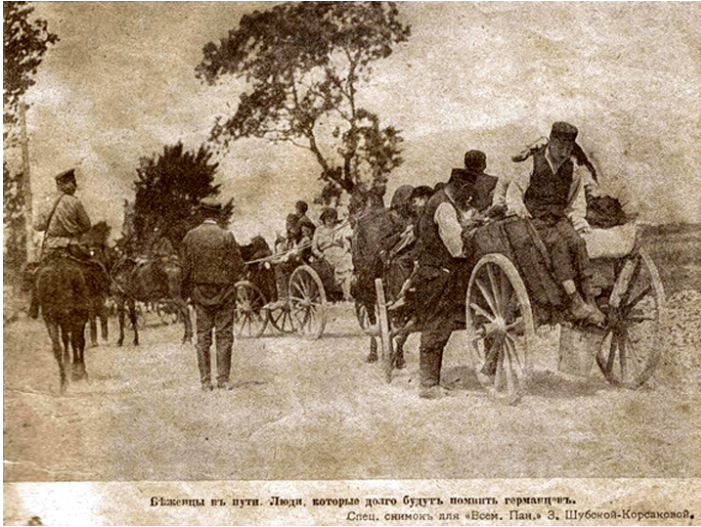
Bieżeńcy, 1915 r, fot z książki „Bieżeństwo 1915”.