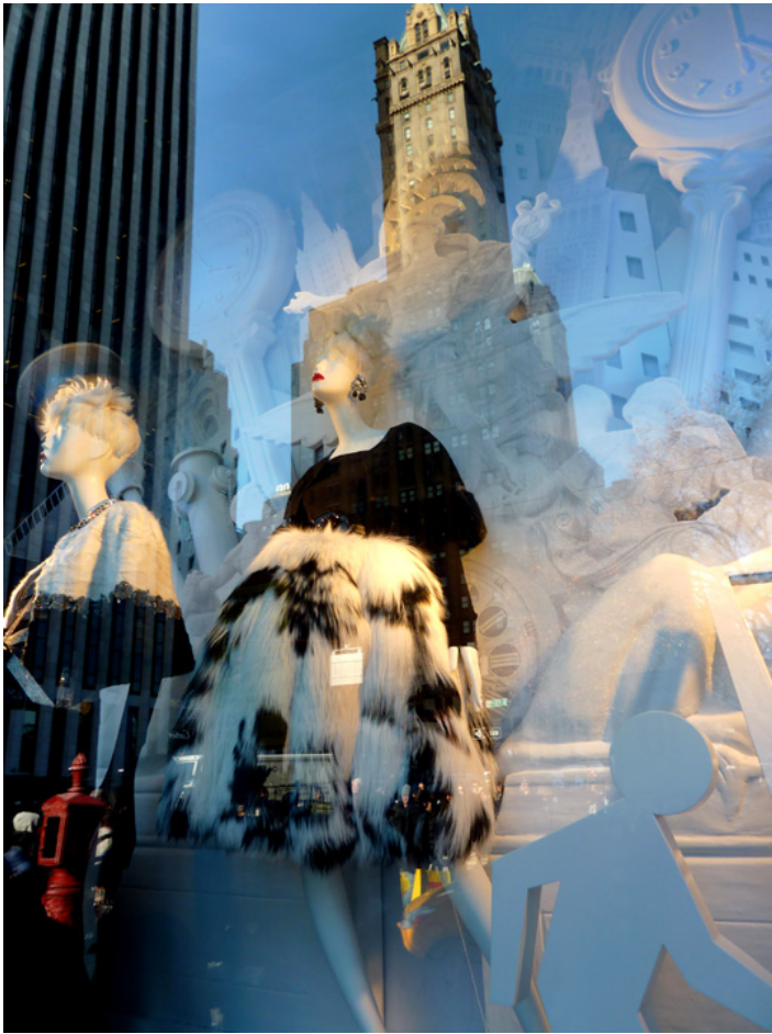
Wystawa sklepu Bergdorf-Goodman, grudzień 2017 r., fot. J. Sokołowska-Gwizdka.