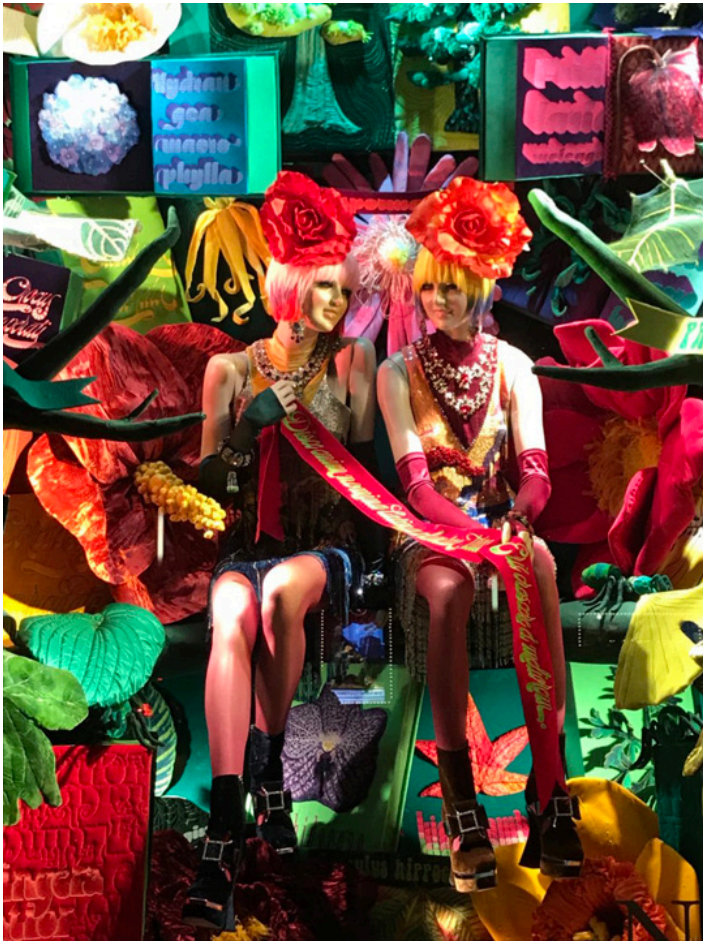
Wystawa sklepu Bergdorf-Goodman, 2017 r.