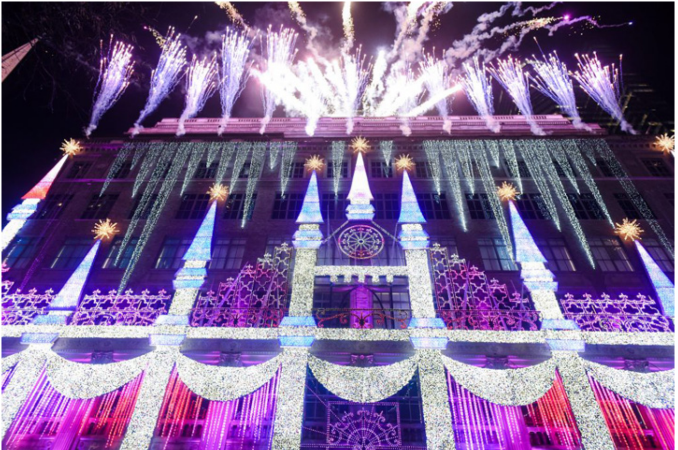
Projekcja światła na fasadzie domu Saks Fifth Avenue na przeciwko Rockefeller Center.