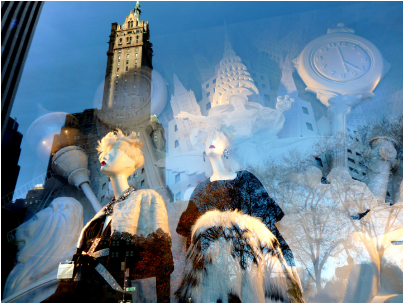
Wystawa sklepu Bergdorf-Goodman, grudzień 2017 r., fot. J. Sokołowska-Gwizdka.