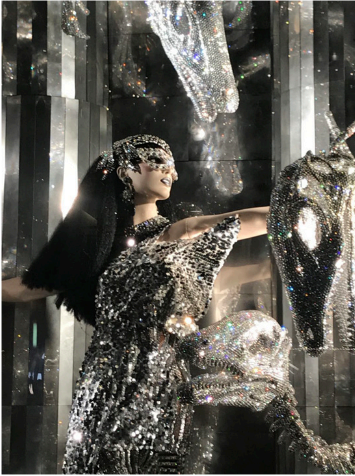
Wystawa sklepu Bergdorf-Goodman, 2017 r.