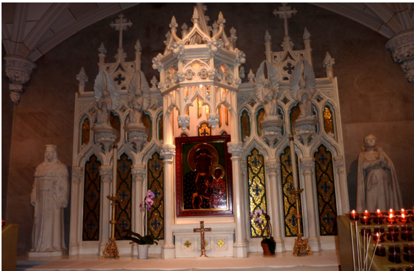
Polska kaplica w Katedrze Świętego Patryka, fot. J. Sokołowska-Gwizdka.

Jednak wyjazd z Polski w tym czasie to oddzielna historia, którą kiedyś opiszę, a teraz skupię się na moich pierwszych wrażeniach z pobytu w Nowym Jorku.