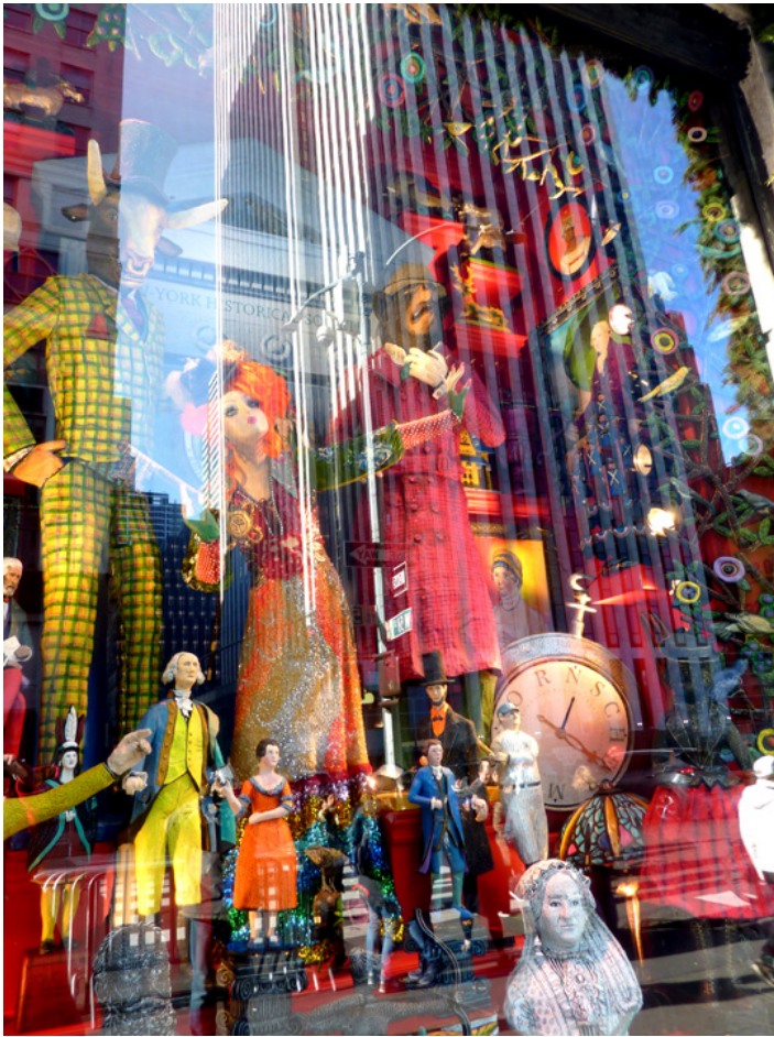
Wystawa sklepu Bergdorf-Goodman, grudzień 2017 r., fot. J. Sokołowska-Gwizdka.