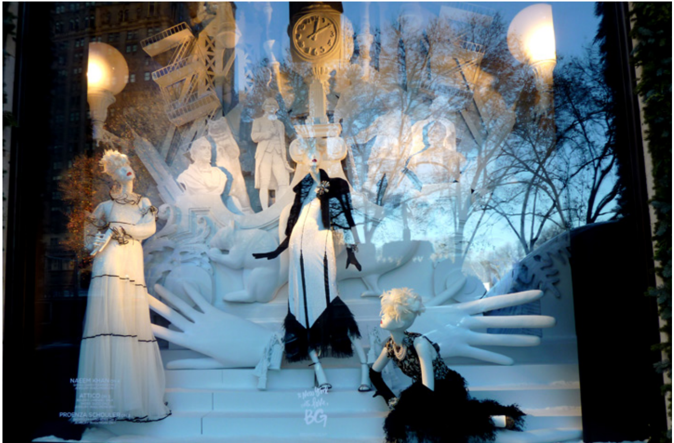
Wystawa sklepu Bergdorf-Goodman, grudzień 2017 r., fot. J. Sokołowska-Gwizdka.