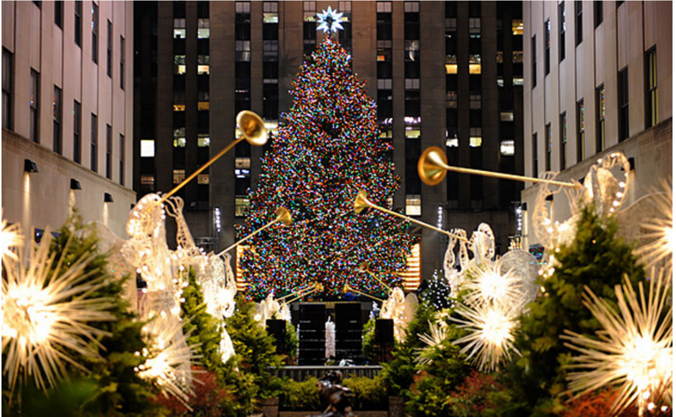
Choinka przez Rockefeller Center w Nowym Jorku, grudzień 2017 r., fot. J. Sokołowska-Gwizdka.