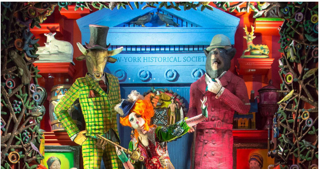
Wystawa sklepu Bergdorf-Goodman, 2017 r.