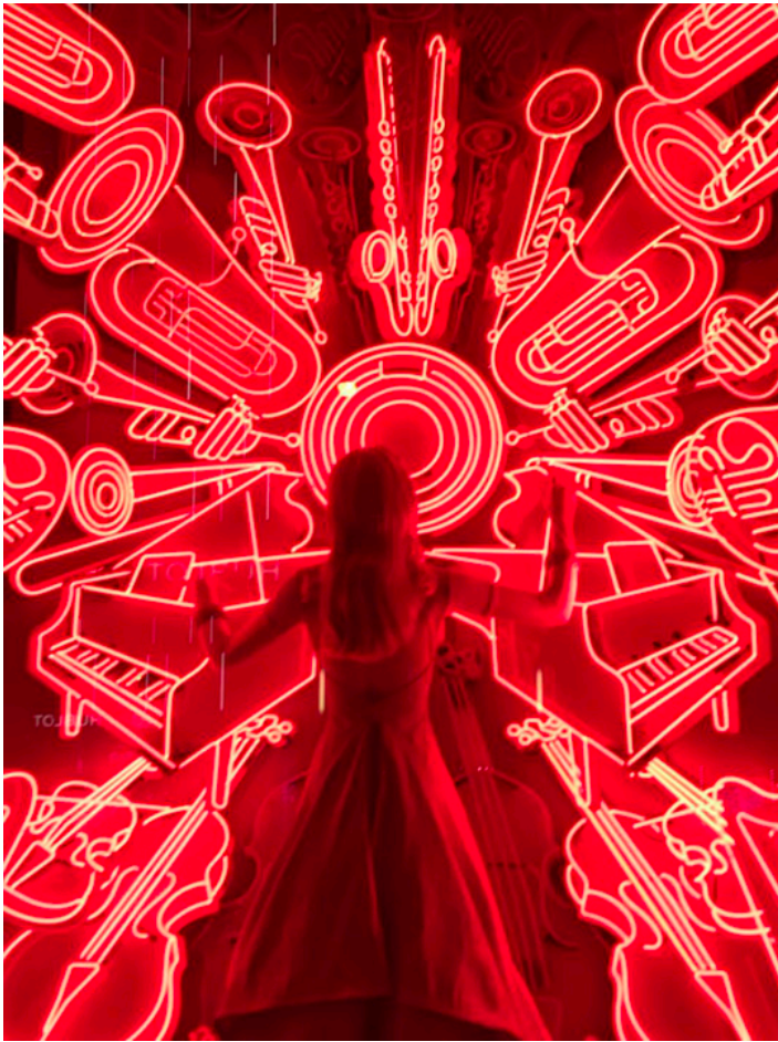
Wystawa sklepu Bergdorf-Goodman, 2017 r.