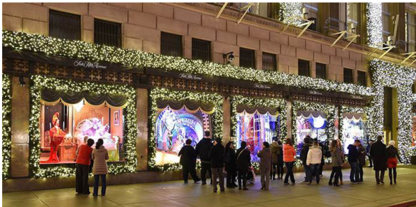
Wystawy inspirowane bajkami Disneya, Saks Fifth Avenue, 2017 r.

Nowy Jork, dom zapakowany jak prezent, grudzień 2017 r., fot. J. Sokołowska-Gwizdka.