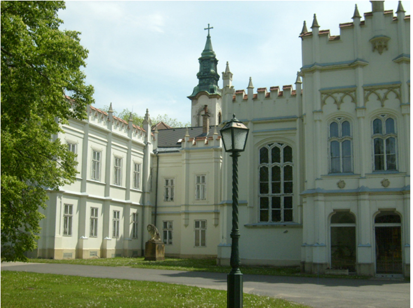
Martonvásár. Muzeum Beethovena.