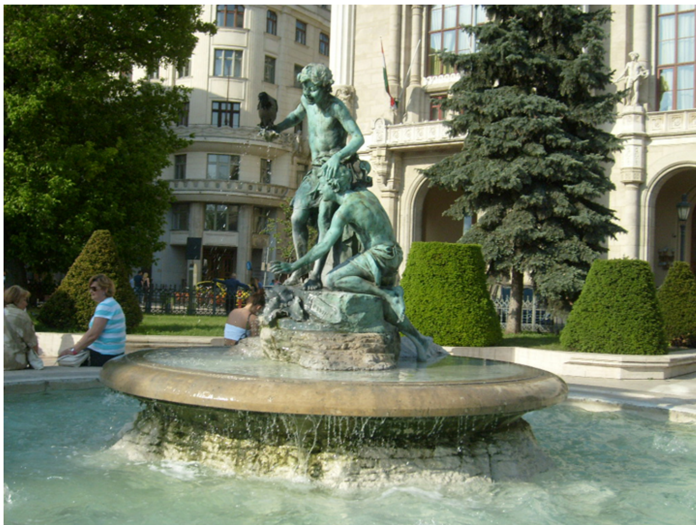
Piękna fontanna z dwoma bawiącymi się chłopcami przed Vigadó (Centrum Sztuki).

Podgrzewam obiad. Zielona fasolka z mięsem, całkiem smaczna. Potem kawa i truskawki. Gospodarze wracają z imprezy około godziny 18-tej.