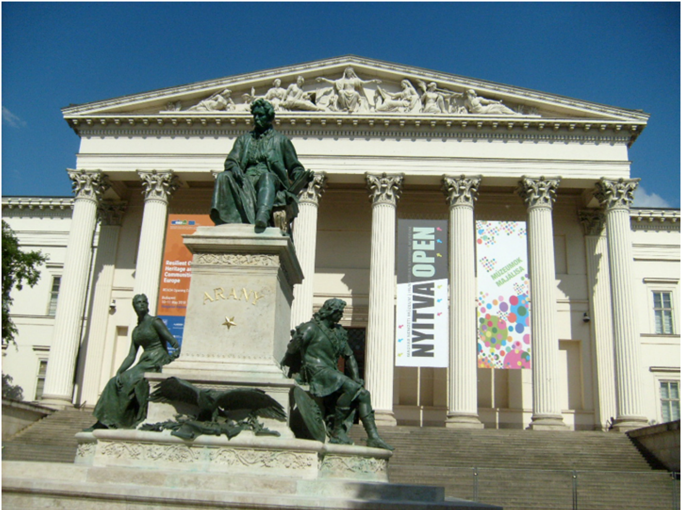
Muzeum Narodowe. Magyar Nemzeti Muzeum.