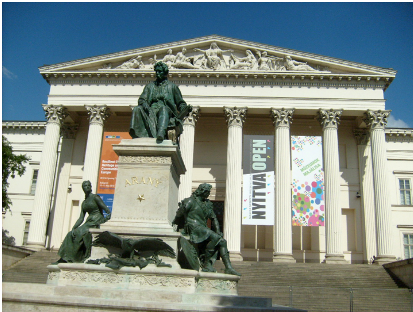
Muzeum Narodowe. Magyar Nemzeti Muzeum.

de terres llunyanes. Catalunya i Hongria a l' edat mitjana (Książeczki krain odległych. Katalonia i Węgry w średniowieczu). W trakcie lektury tej opasłej książki z pięknymi ilustracjami zapragnąłem zobaczyć na własne oczy oryginały niektórych przynajmniej eksponatów w Węgierskim Muzeum Narodowym.