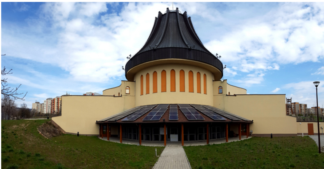
Kościół Świętych Aniołów w Nowej Budzie.

Wyspach Kanaryjskich. Przegląda ją z wielkim zainteresowaniem. Był tam dwukrotnie i spotkał się z ogromną życzliwością Kanaryjczyków. Niestety, w ciągu ostatnich trzech lat stracił słuch. Nie słyszy, co do niego mówię, a ja mam przecież dobrą dykcję! Ma też problemy ze wzrokiem. Skończył już 86 lat. To bardzo smutne, jak upływające lata niszczą organizm człowieka. Uwielbiałem słuchać, jak jeszcze siedem lat temu opowiadał interesujące anegdoty o Cervantesie. Teraz już tylko koncentruje się na swoich problemach zdrowotnych. Anni na obiad upiekła znakomitego indyka.