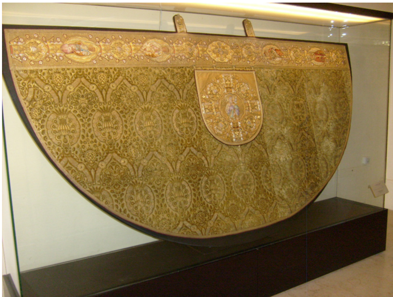
Szata liturgiczna w Kościele Śródmiejskim.