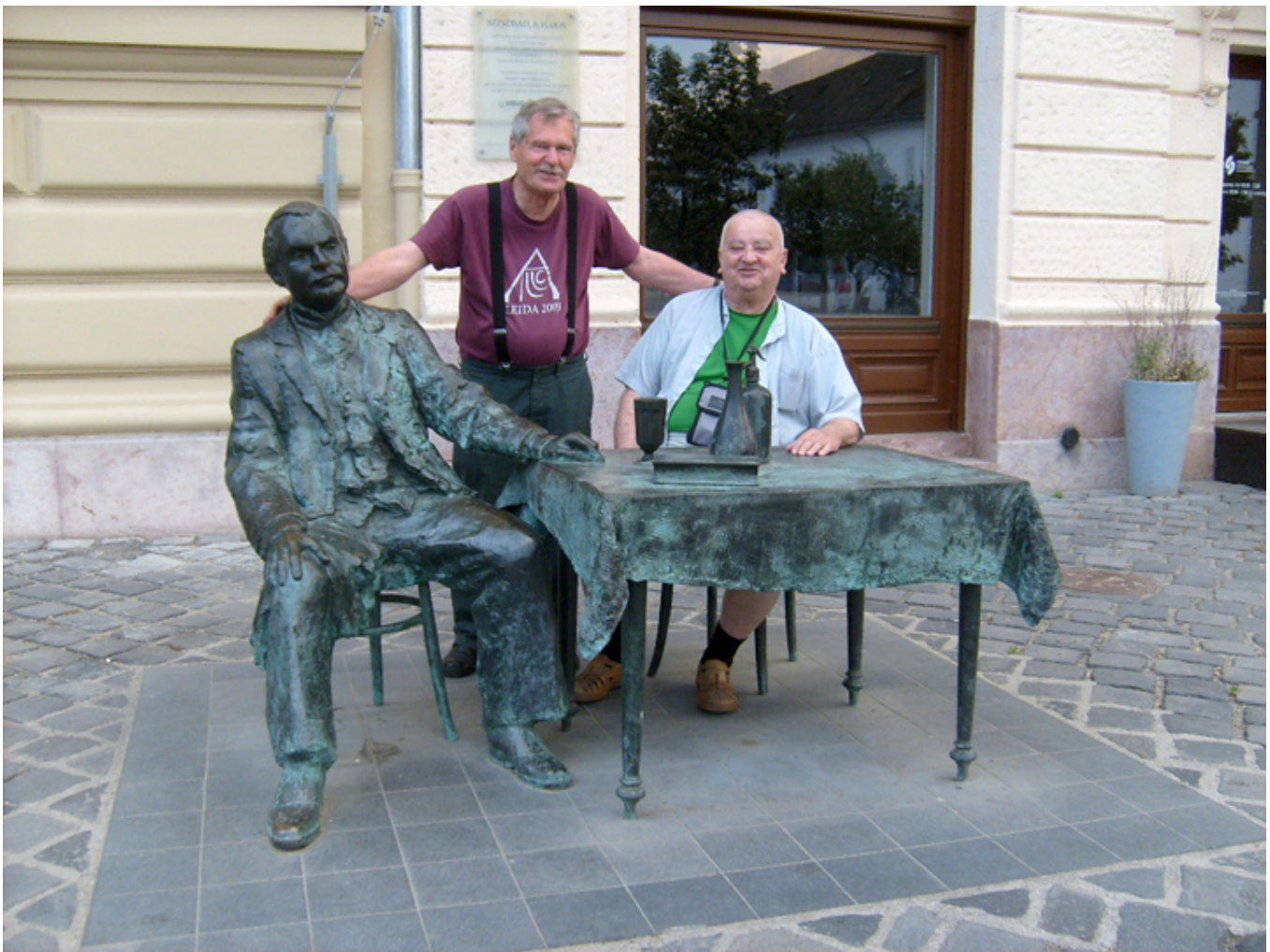
Pomnik pisarza Gyuli Krudy' ego. Stara Buda.

Na sąsiednim placyku rzeźby czterech kobiet z otwartymi parasolkami. Ta grupa zwie się Oczekujące (w domyśle córki Koryntu), a jej autor to słynny węgierski artysta Imre Varga, urodzony w 1923 roku.