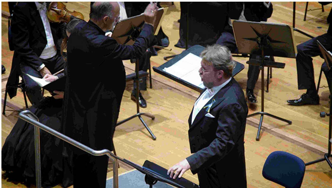
Koncert w Monachium, fot. Tomasz Filiks/IAM@IAM