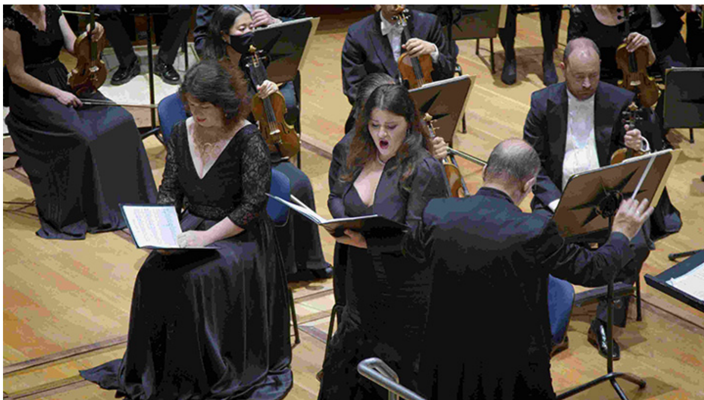
Koncert w Monachium

I część jego IV Symfonii ma charakter militarny, słycać tam perkusję i pizzicato instrumentów smyczkowych, a partie dętych