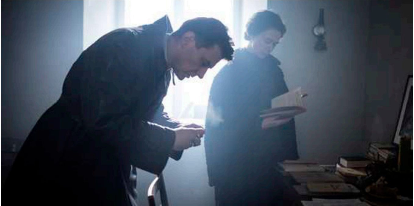
Kadr z filmu „Zaćma” w reżyserii Ryszarda Bugajskiego, fot. Jacek Drygała.

JSG: Świat, który Pan kreuje na ekranie nie jest czarno-biały, lecz zbudowany z różnych odcieni szarości. Dobro może mieć ryse, a zło może mieć psychologiczne wytłumaczenie swojego istnienia. Czy można dojrzeć granicę pomiędzy tymi przeciwstawnymi pojęciami?