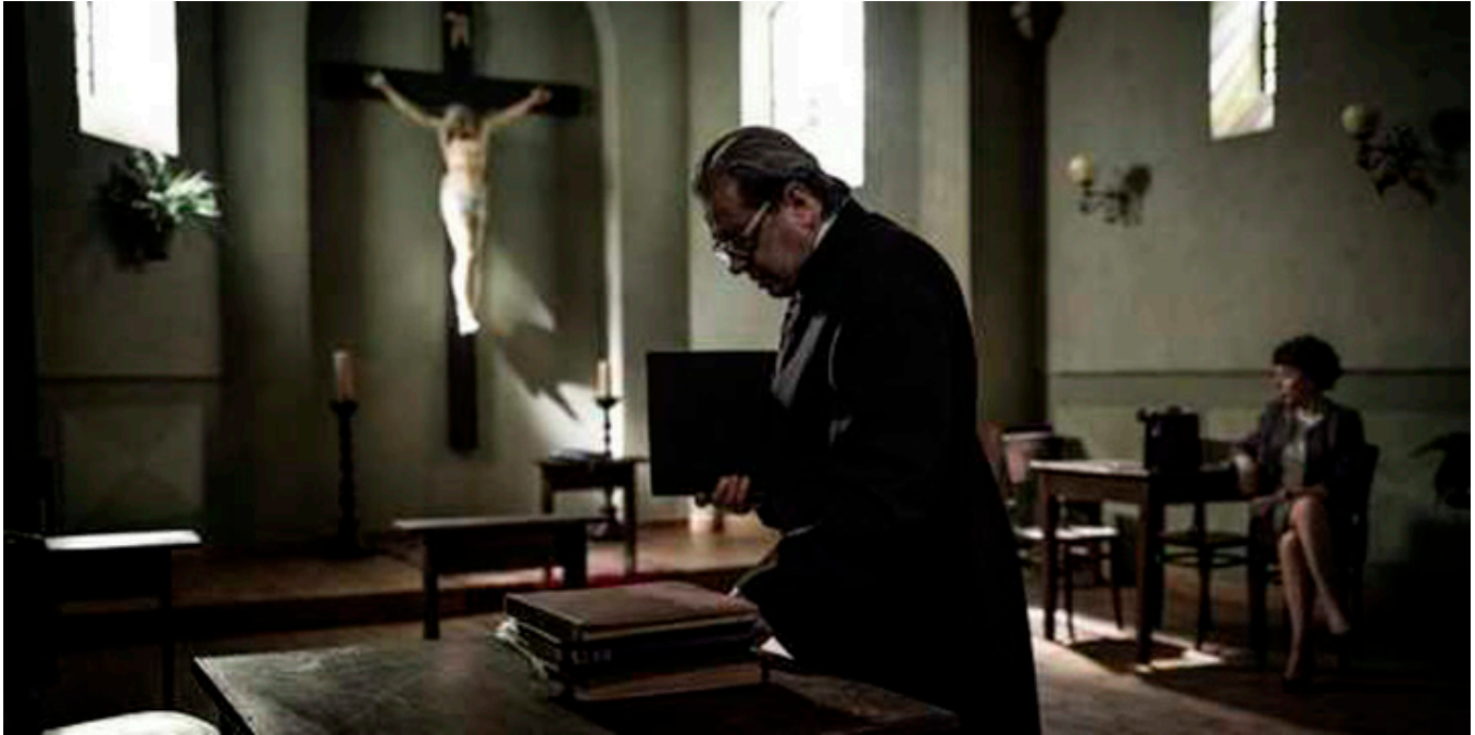
Kadr z filmu „Zaćma” w reżyserii Ryszarda Bugajskiego, fot. Jacek Drygała.

Film „Zaćma” będzie można zobaczyć w Teksasie w ramach Austin Polish Film Festival. Więcej informacji można znaleźć na stronie: