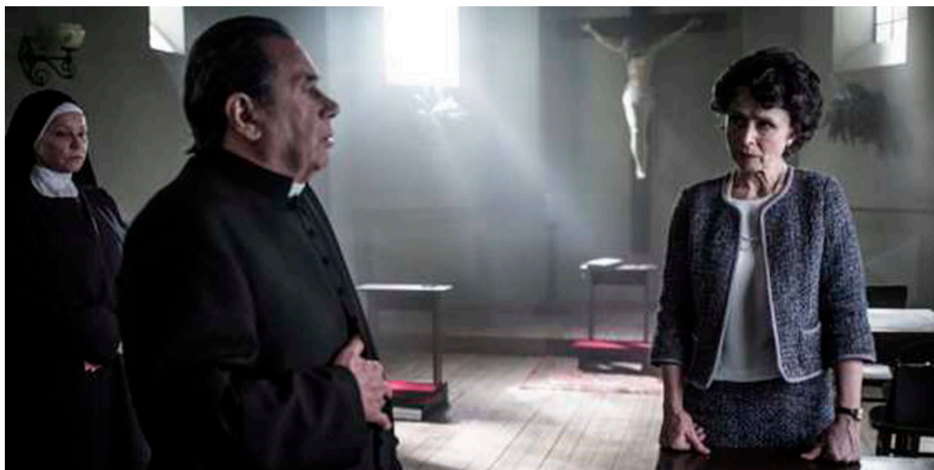
Kadr z filmu „Zaćma” w reżyserii Ryszarda Bugajskiego, fot. Jacek Drygała.

zbrodniarzy takich jak ona? Przecież Kościół głosi, że należy nadstawiać drugi policzek, że należy wybaczać winy winowajcom. Prymas jest rozdarty między potępieniem Brystigerowej-zbrodniarki i udzieleniem jej przebaczenia. Ich rozmowa tym samym nabiera dramatycznego wyrazu i staje się bardziej osobista.