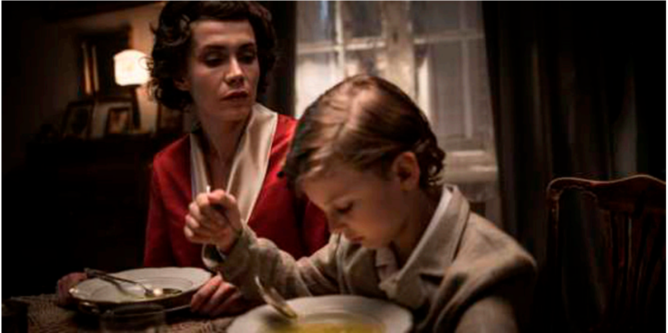
Kadr z filmu „Zaćma” w reżyserii Ryszarda Bugajskiego, fot. Jacek Drygała.