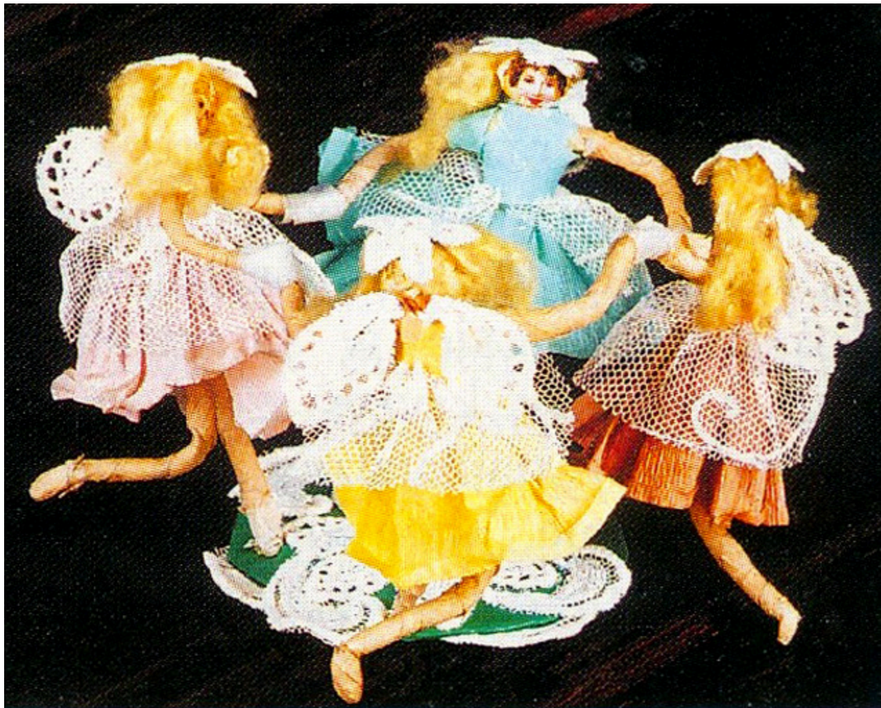
Tańczące aniołki, fot. Roman Łyko.