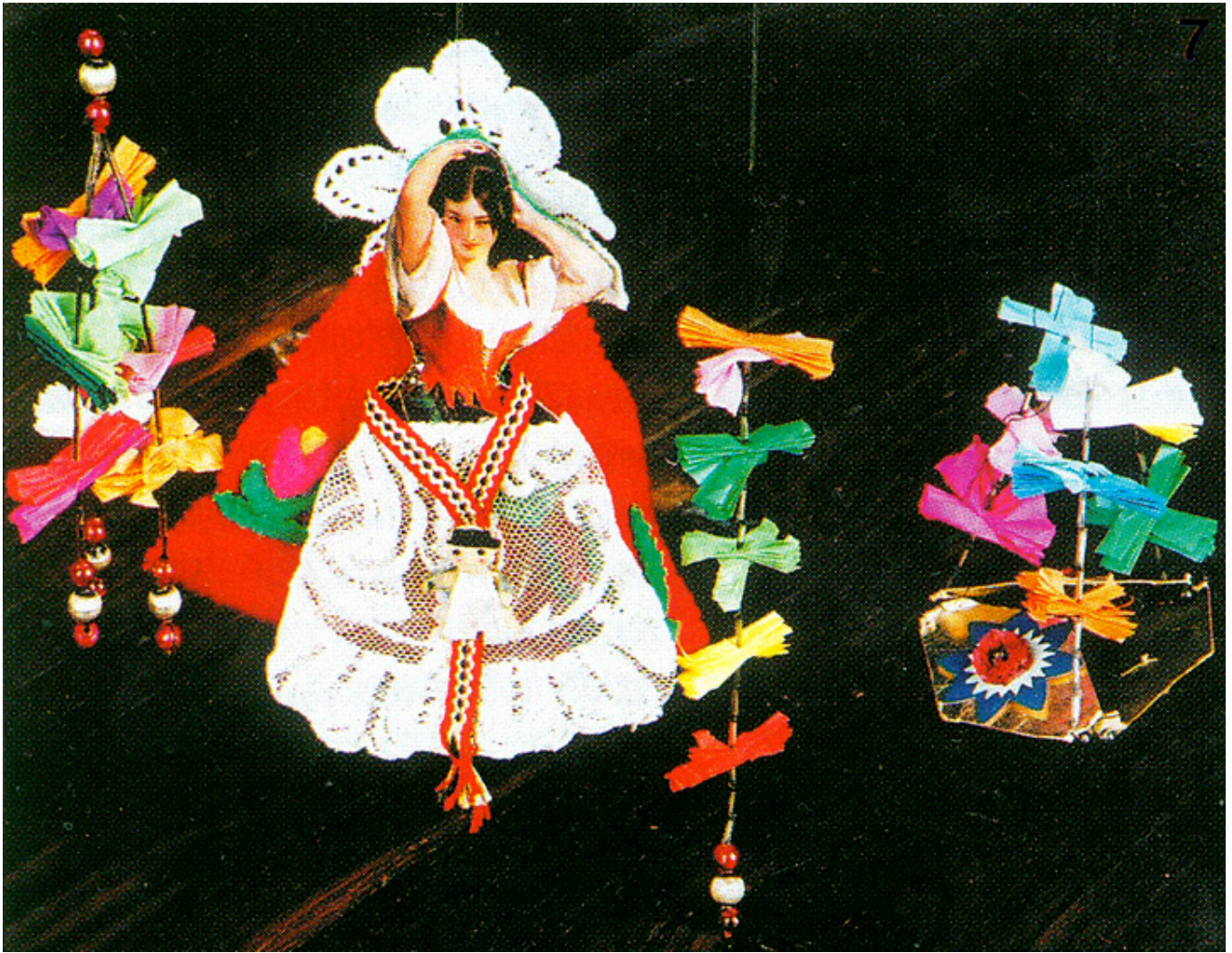
Tańcząca Carmen i wisiorki, fot. Roman Łyko.