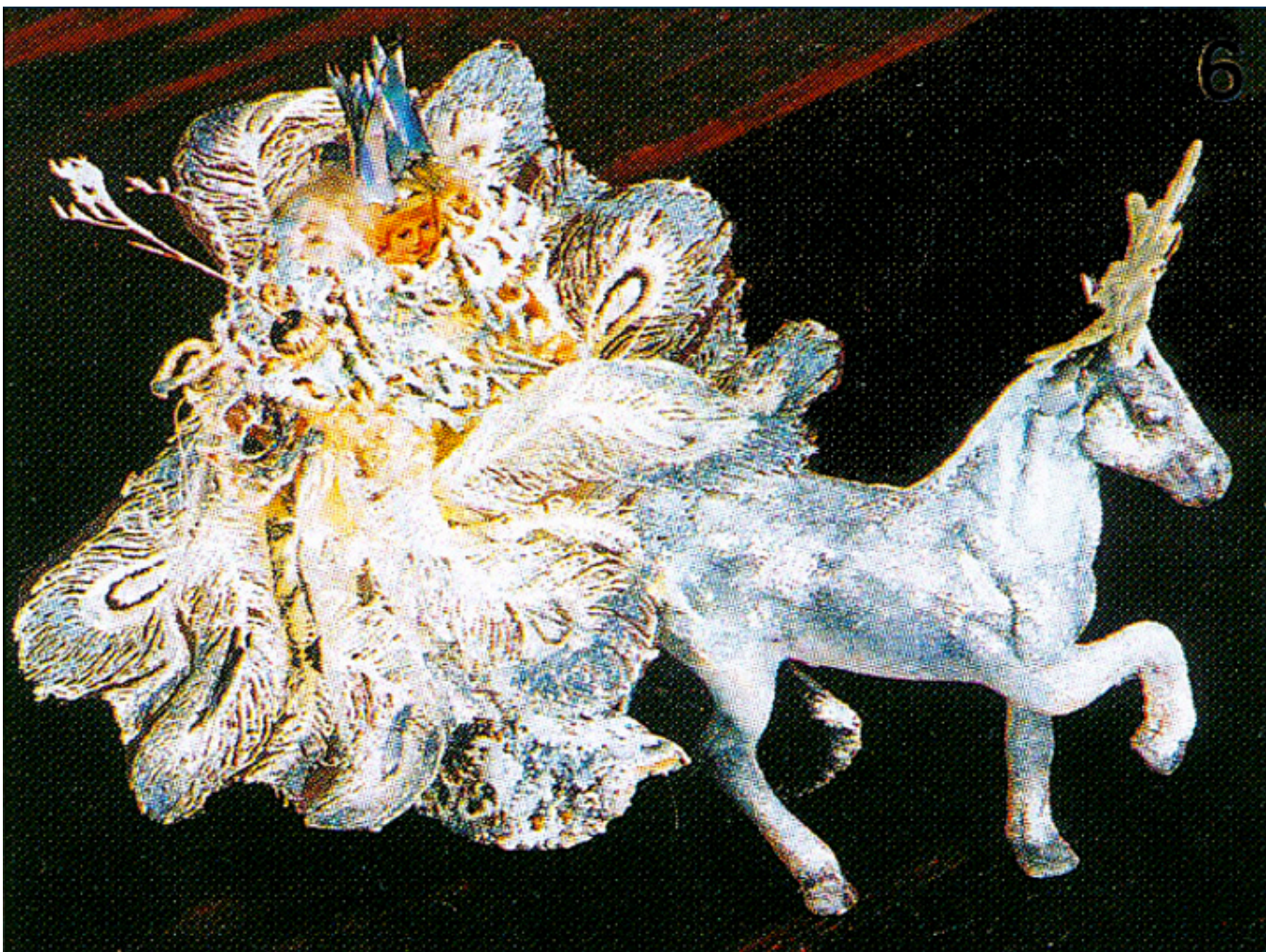
Królowa Śniegu, fot. Roman Łyko.

Wszystkie te choinkowe cacka są zrobione z różnych papierów i tkanin, przystrojone koronkami, haftami, cekinami i koralikami; przeciętna wysokość zabawek wynosi około 12 cm. Niektóre mają ludzkie twarze, malowane ręcznie lub przyklejone, a przed tym wycięte z ówczesnie drukowanych arkuszy. Lalki ubrane w szmaciane sukienki mają pod spodem bibułową bieliznę.