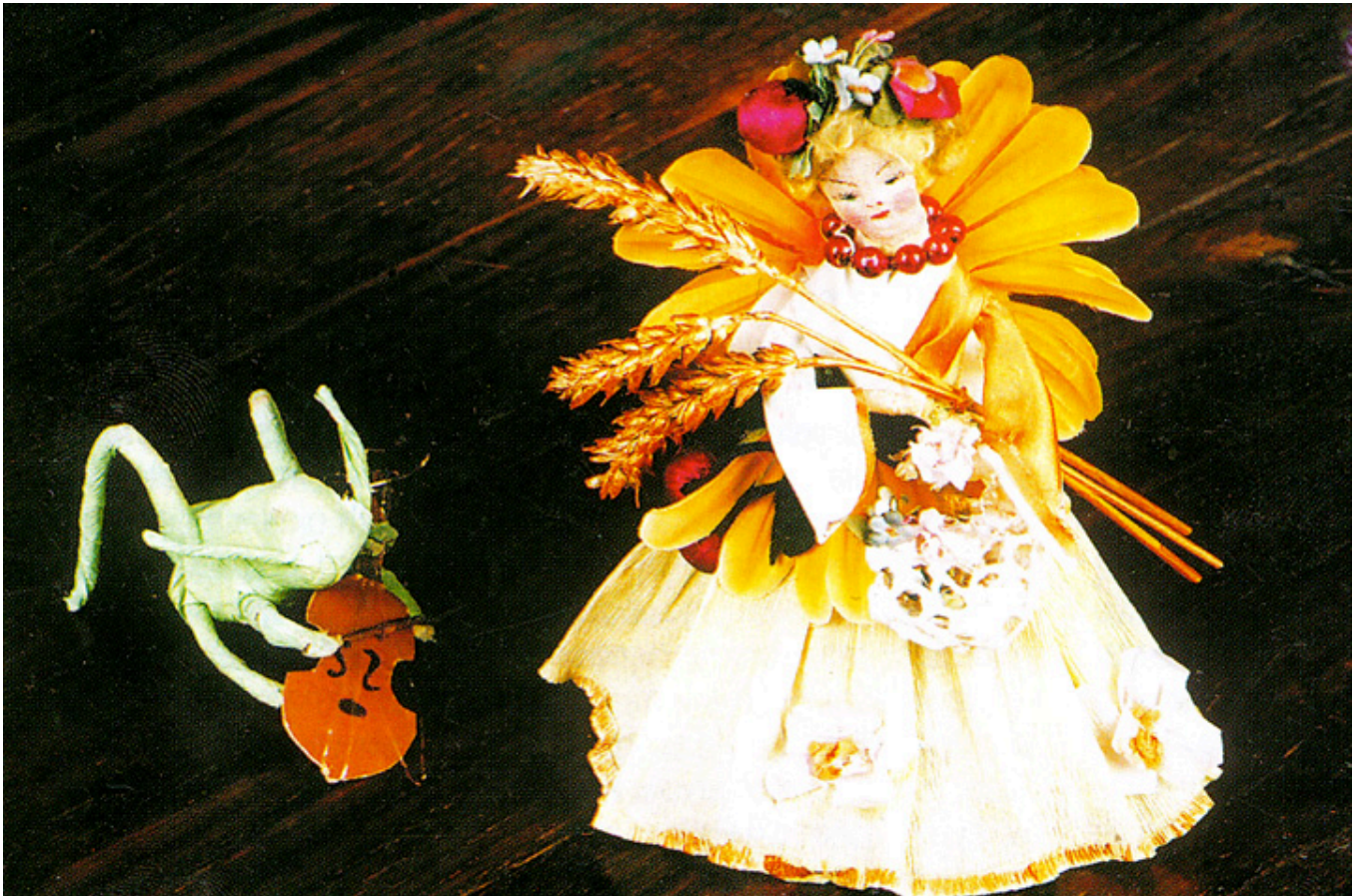
Lato i grający świerszcz, fot. Roman Łyko.