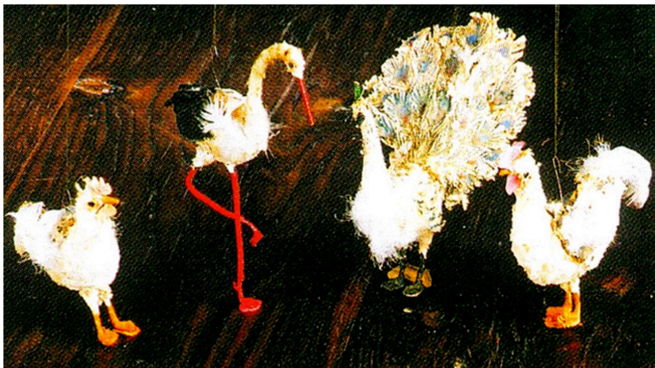
Komplet ptaszków, fot. Roman Łyko.

Prezentowane rękodzieła są rzadką okazją do poznania utrwalonego w nich rzemiosła od strony warsztatowej. Ozdoby wykonywane były przez dorosłych i przez dzieci, są dowodem ich pomysłowości, wyczucia estetycznego oraz zręczności w posługiwaniu się igłą, nożyczkami czy pędzlem. Ale można w nich także spotkać odbicie modnych wówczas stylów artystycznych. Przede wszystkim jednak ozdoby są świadectwem wiary chrześcijańskiej wykonawców, którzy w miarę swoich możliwości i umiejętności, kontynuując rodzinne tradycje wigilijne w symbolicznych treściach zabawek choinkowych, starali się przez te przedmioty pogłębiać w swoich dzieciach przeżywanie misterium świąt Bożego Narodzenia.