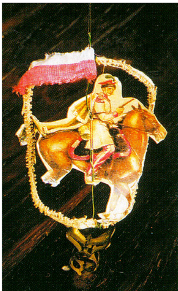
Krakus z 1831 r., fot. Roman Łyko.

kotwicami i krzyżem, pochodząca z lat sześćdziesiątych XIX w.; jest to najstarsza zabawka z całego zbioru. Odzyskanie przez Polskę niepodległości w 1918 r. stało się wspaniałym tematem dla choinkowych zabawek. Z tego czasu pochodzi lalka Podolanka - tekturowa pół postać w regionalnym stroju z tkaniny, przystrojona wstążkami i koralami. Świąteczne drzewko zdobiły także płócienne rogatywki z futrzanymi otokami i prawdziwymi piórkami, konfederatka i dwie krakuski.