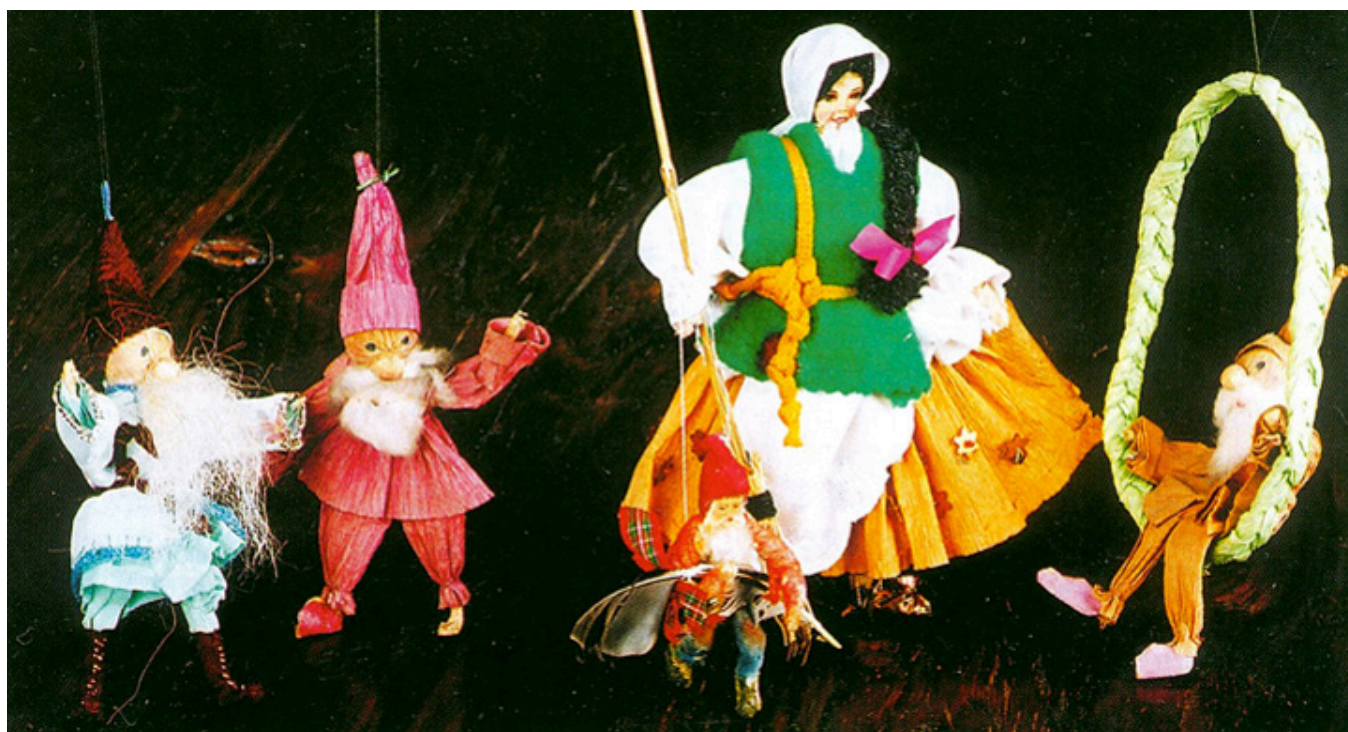
Królowna Śnieżka i krasnaludki, fot. Roman Łyko.