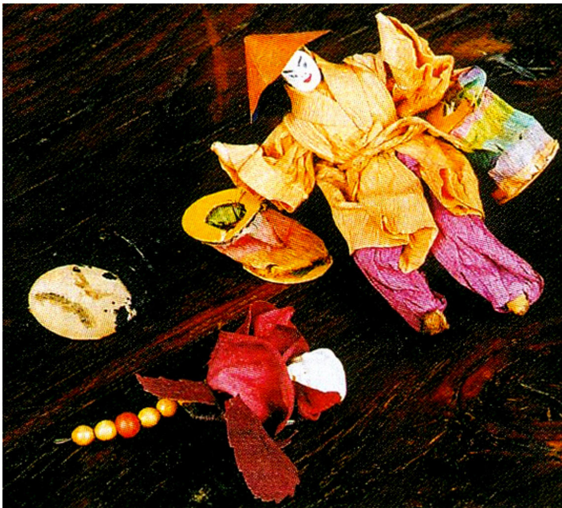
Różyczka św. Franciszka i Chińczyk, fot. Roman Łyko.

Zachowana po mojej babuni, pochodząca z końca XIX w. różyczka św. Franciszka, wzrusza symboliką i wymową. Jest to płócienny kwiat róży z biskwitową główką Czerwonego Kapturka w środku i łądyżką bez kolców złożoną z paciorków różańca, symbolizuje miłość wobec Boga i bliźnich. Wśród ozdób jest też tekturowy Święty Mikołaj w protestanckim wizerunku pielgrzyma – watowanym kaftanie i wysokich powyżej kolan butach, z dużym worem z haftowanego płótna, w którym chowano cukierki dla dzieci. Ta figurka jest pozostałością po byłych właścicielach naszego powojennego mieszkania w Jeleniej Górze.