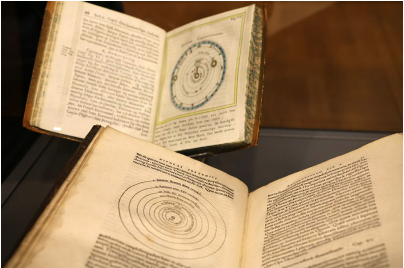
W Bibliotece Narodowej w Oslo można było zobaczyć oryginalne dzieło Kopernika „De revolutionibus orbium coelestium”, fot. M. Tomczyk-Maryon.