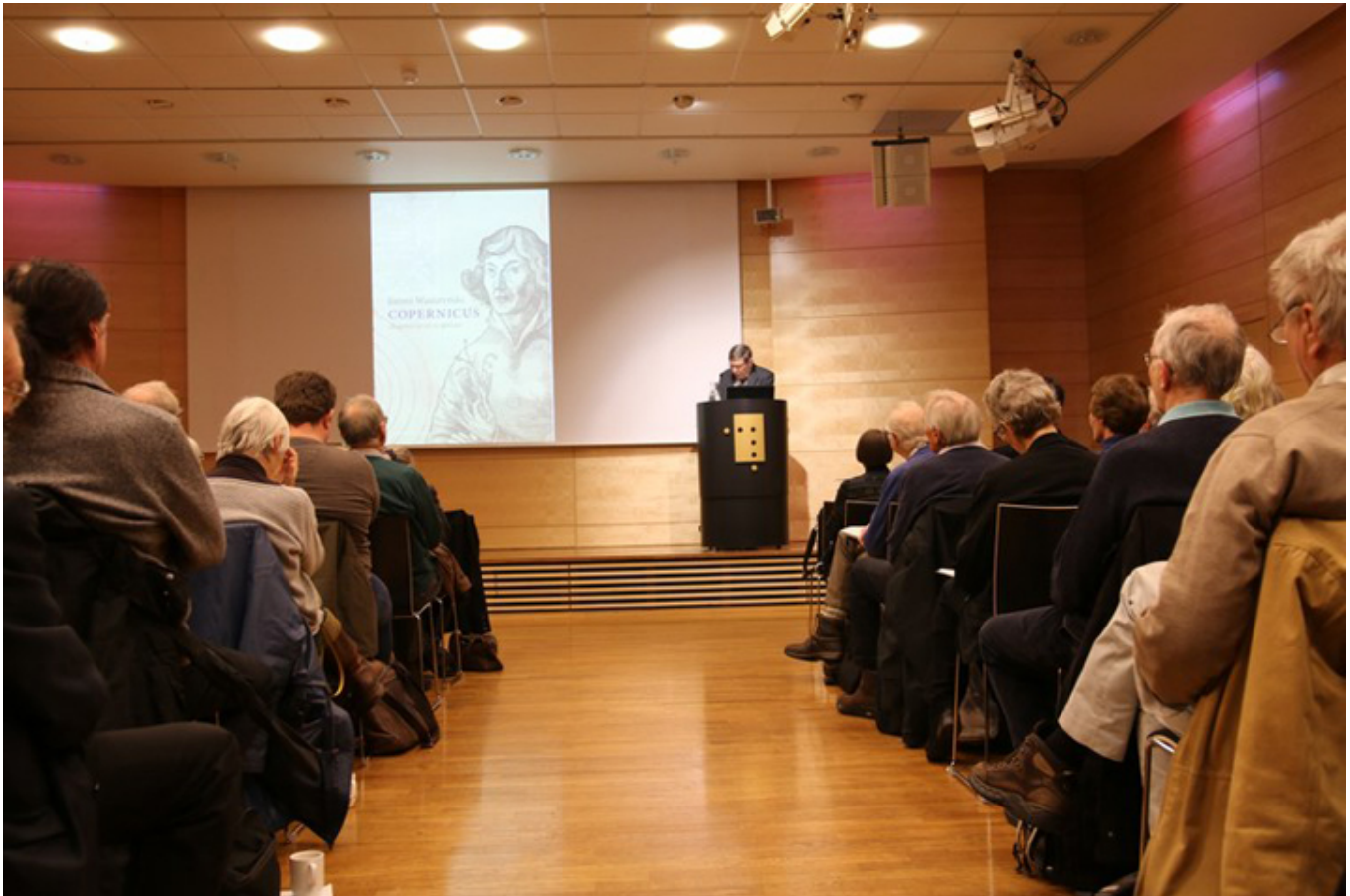
Biblioteka Narodowa w Oslo 25 stycznia 2018 r., fot. M. Tomczyk-Maryon.