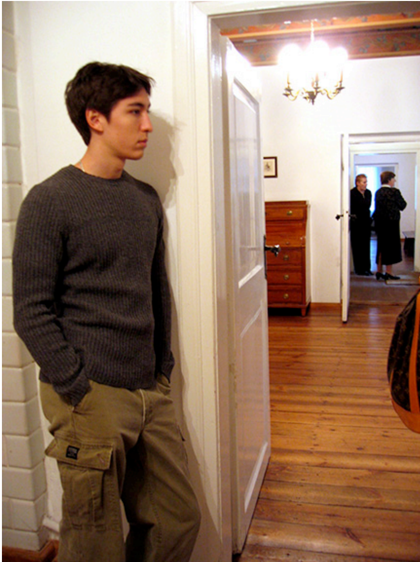
Kadr z filmu „Pianiści - grają Chopina”