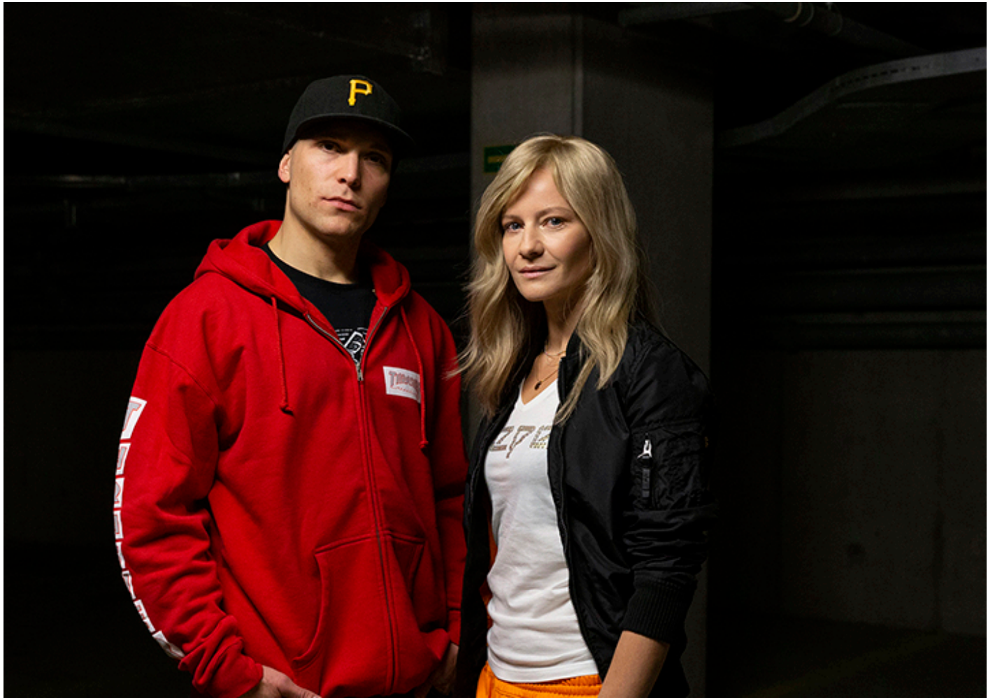
Kadr z filmu „Proceder”.