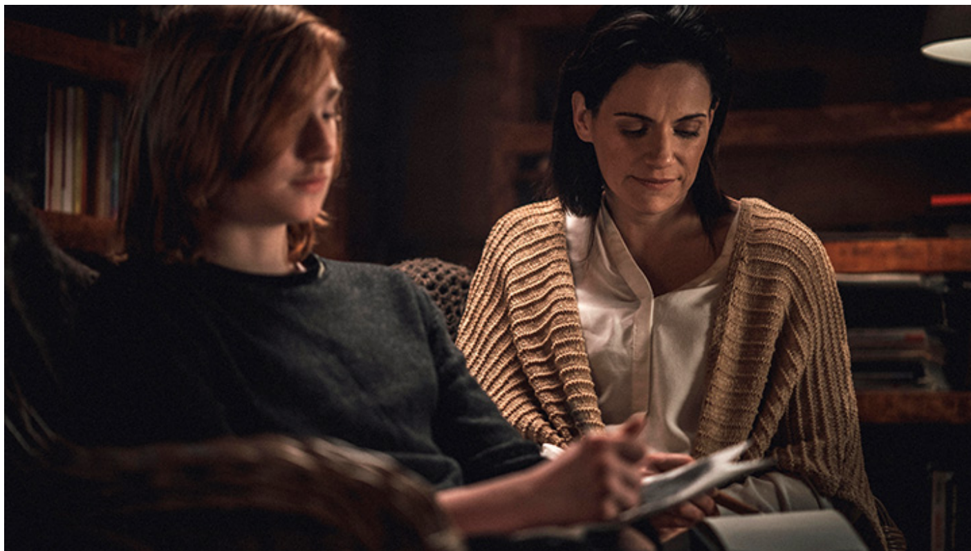
Kadr z filmu „Jestem REN”