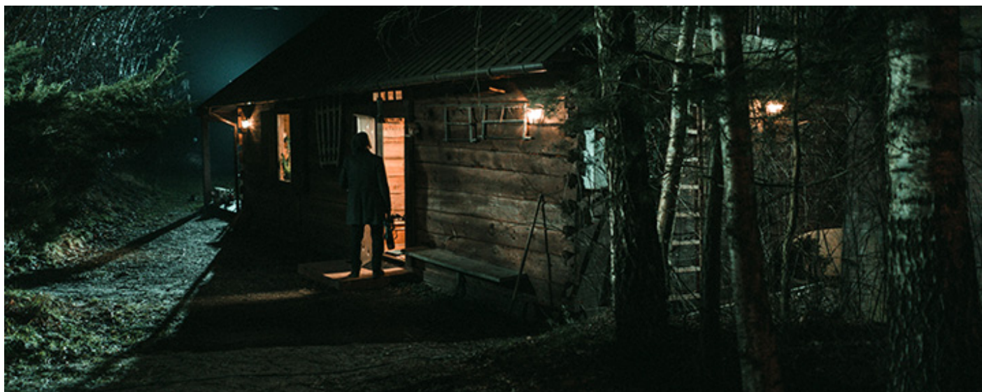
Kadr z filmu „Jestem REN”

wszystkich na wyjazd do ośrodka na wspólną terapię. Kobiecie wydaje się, że padła ofiarą podstępu męża, który spiskuje przeciwko niej z ogromną, międzynarodową korporacją, próbując się jej pozbyć. Gdy w trakcie sesji terapeutycznej Renata przyznaje, że tak naprawdę to ona jest REN - najwyższej klasy android, sprawy jeszcze bardziej się komplikują. Kobieta czuje się osaczona i nie wie komu może zaufać. Gdy poznaje Elę (Marieta Żukowska), która ostrzega ją i mobilizuje do ucieczki, Renata postanawia walczyć o swoje życie i uciec z synem za wszelką cenę. Tylko czy z miejsca w którym się znalazła, jest w ogóle możliwa ucieczka? Kim tak naprawdę jest REN i jaką tajemnicę skrywa? Czy jej rodzina jest gotowa na bolesną prawdę?