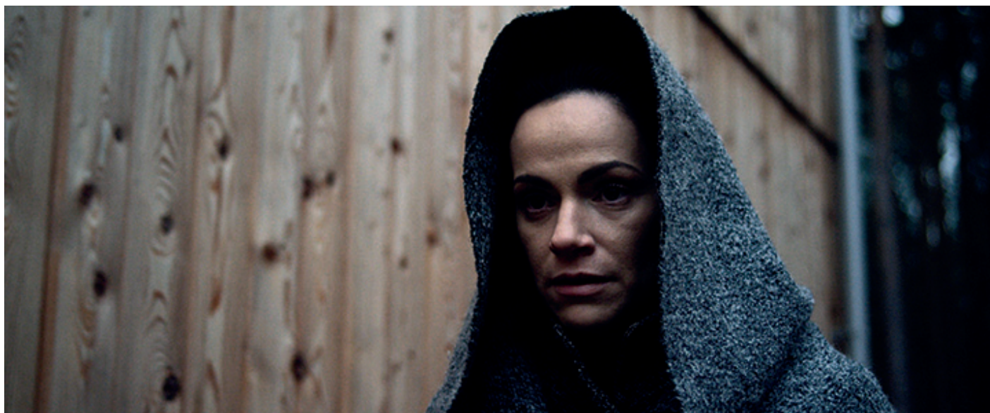
Kadr z filmu „Jestem REN”