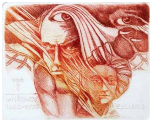
Witkacy 1995 r.