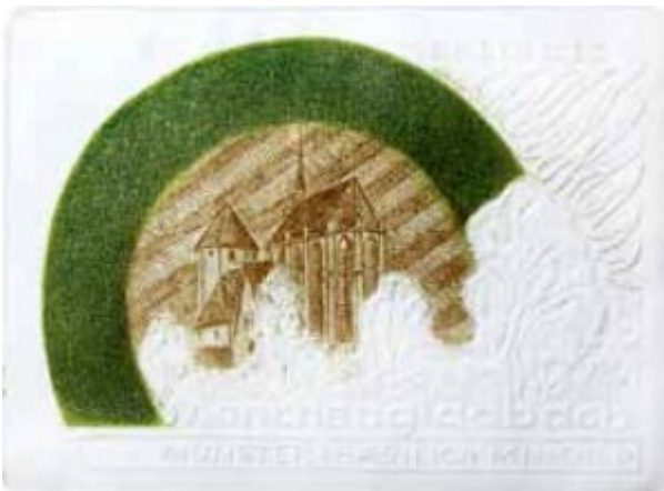
Mönchengladbach Münster 1993 r.