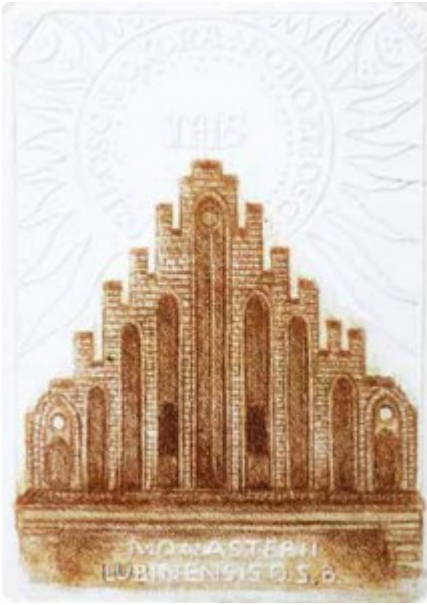
Monasterii Lubinensis O.S.B. 1911 r.