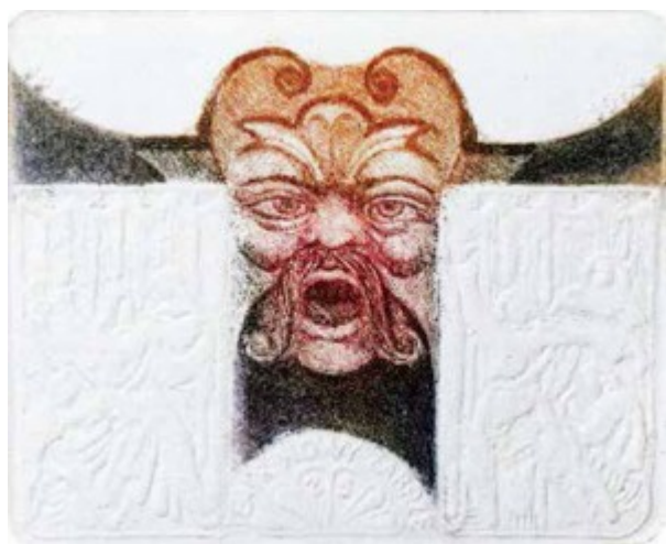
Teatr Nowy w Zabrzu 1994 r.