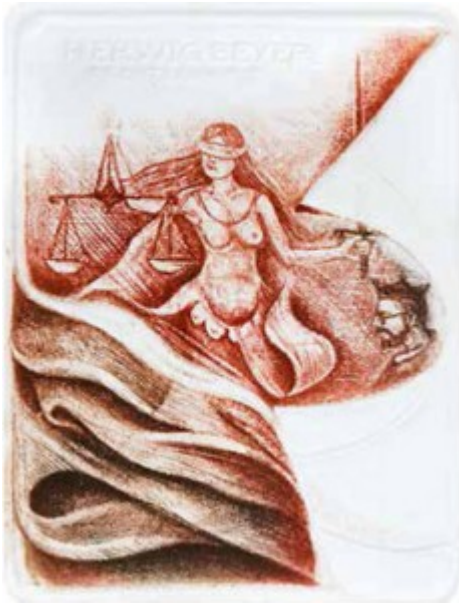
Herwig Beyer 1987 r.