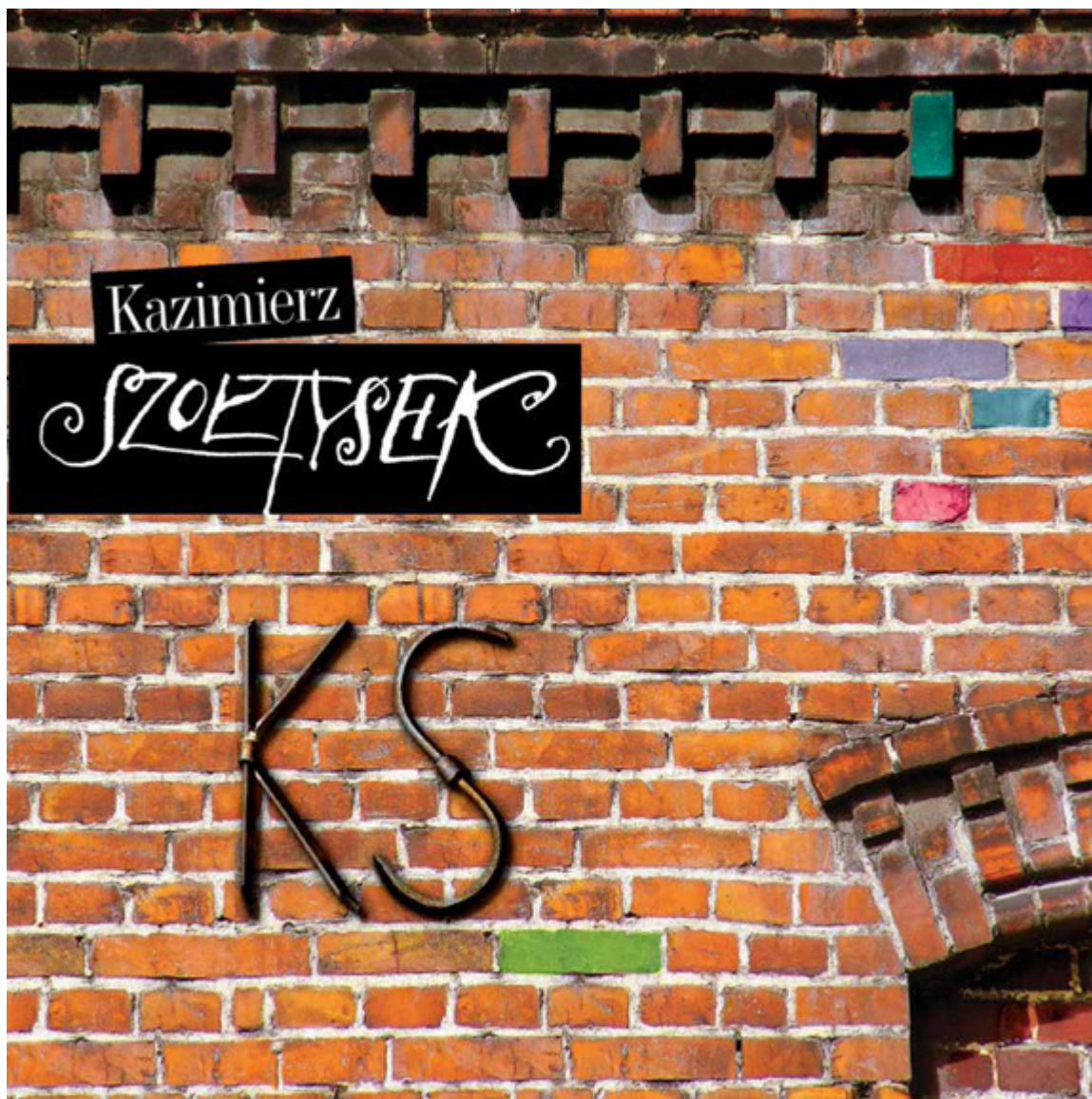
Album Kazimierza Szołtyśka z okazji 40-lecia pracy artystycznej