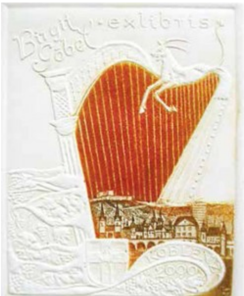
Brigit Göbel 1992 r.