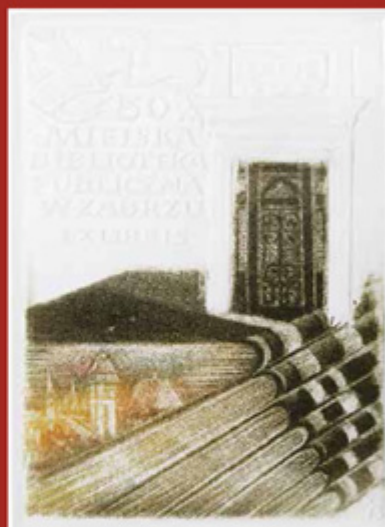
Miejska Biblioteka Publiczna w Zabrze Öffentliche städtische Bibliothek in Zabrze 1995 | intaglio

Album Kazimierza Szotyśka z okazji 40-lecia pracy artystycznej