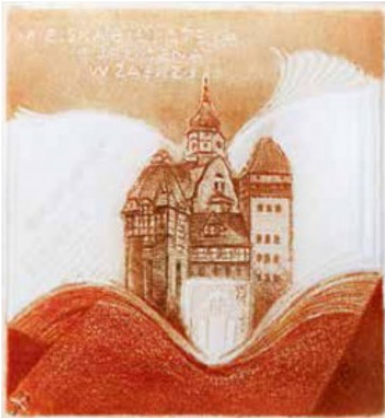
Miejska Biblioteka Publiczna w Zabrzu 2000 r.