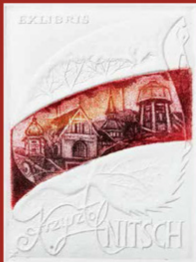
Krzysztof Nitsch 1997 | intaglio