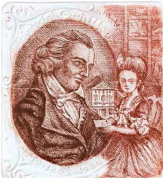
Friedrich Schiller 1984 r.