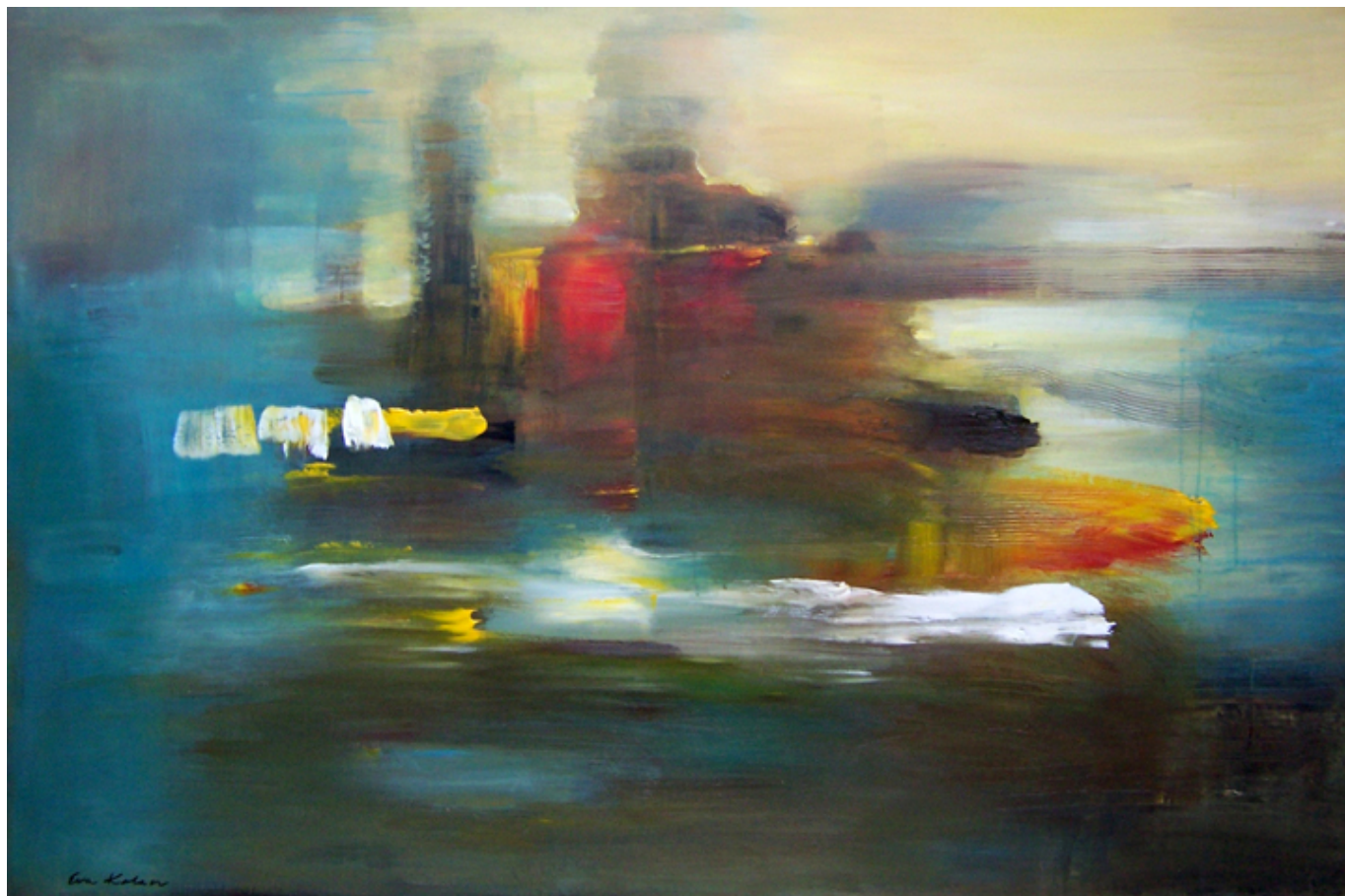
Eva Kolacz, Fantasy Island.