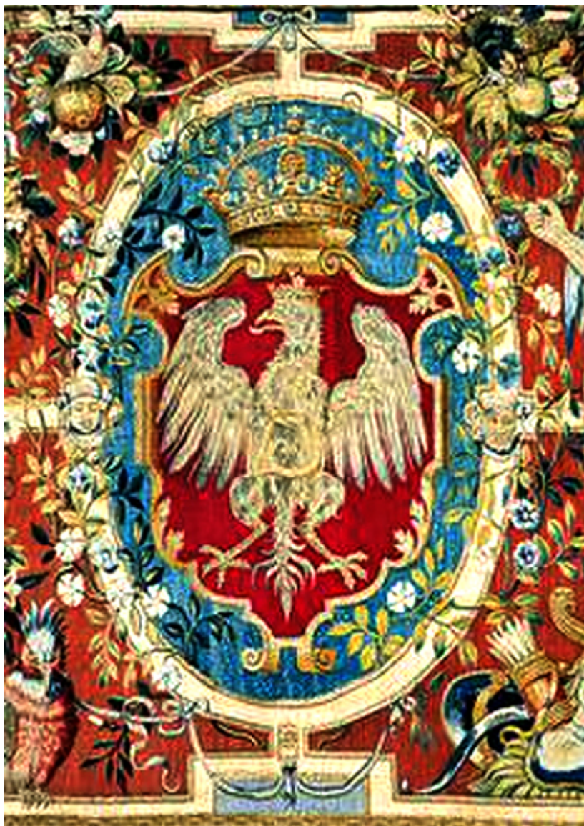
Arras z herbem Polski i królewskimi monogramami S.A.

wykładali z nich wszystkie precjoza, rozpościerali i wietrzyli arrasy, a wymagające naprawy obiekty poddawali konserwacji. Kilka arrasów zostało podszytych płótnem w celu ich wzmocnienia, rzędy końskie były sukcesywnie czyszczone i natłuszczane, czyszczono złote i srebrne regalia, naprawiono uszkodzenia w chorągwiach. Z każdej takiej inspekcji kustosze sporządzali dokładny raport wysyłany do rządu polskiego w Londynie.