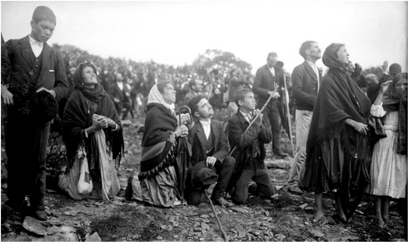
Pielgrzymki proszących o cud w Fatimie.

Już po ukazaniu się mojego przekładu, zawstydzony, że pisałem o Fatimie nie znając jej, wybrałem się do Portugalii. Była to obecnie mało już pamiętana, samotna wyprawa, uciążliwe noce spędzone na krzesłach w prymitywnych warunkach wczesnych pielgrzymek. Po raz drugi pojechałem do Fatimy z żoną, ale spartańskie warunki jeszcze trwały i wspominały podobną noc spędzoną na krzesłach nim zmieszaliśmy się z tłumem przed bazyliką w dniu miesięcznej pielgrzymki diecezjalnej z udziałem tego samego biskupa, który przewodniczył pierwszym takim uroczystościom od 13 maja do 13 października 1917 roku. Niestety aparaty fotograficzne wówczas nie posiadały dzisiejszej sprawności i zdjęcia wtedy zrobione wypadły licho. Mamy fotografie procesji z figurą Matki Boskiej Różańcowej przez