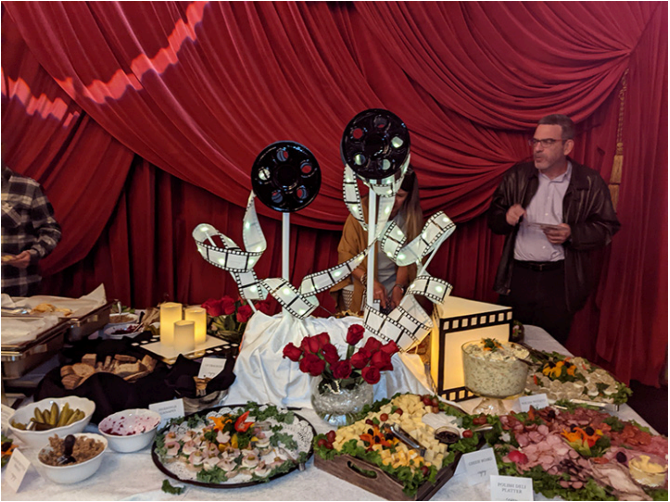
Polski poczęstunek przygotowany przez Apolonia Catering