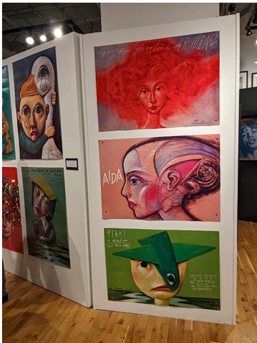
Plakaty Leszka Żebrowskiego