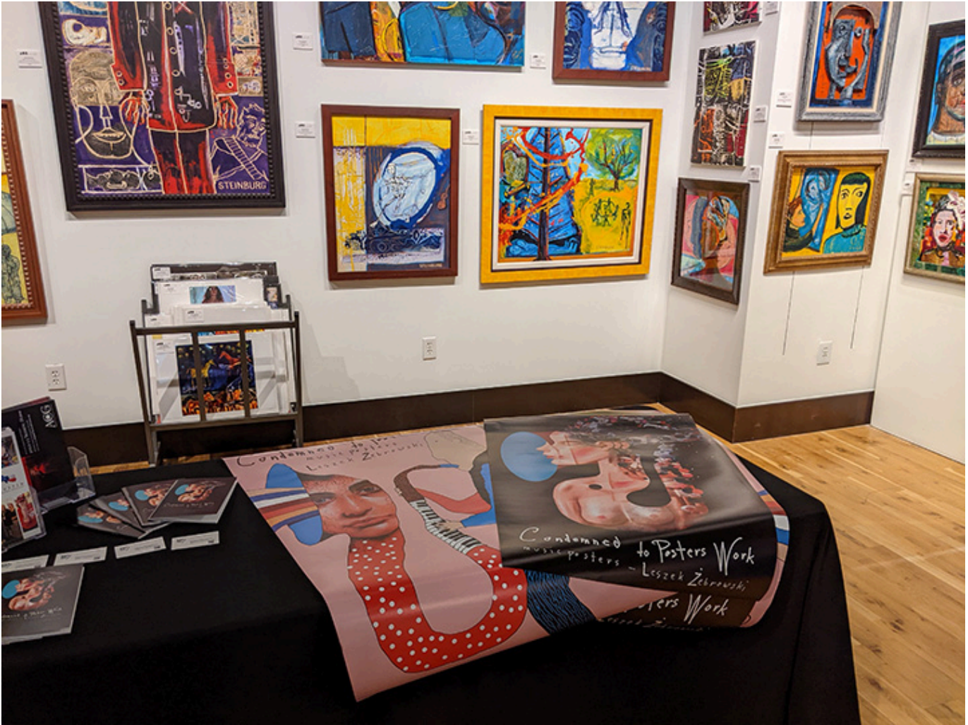
W Galerii A05