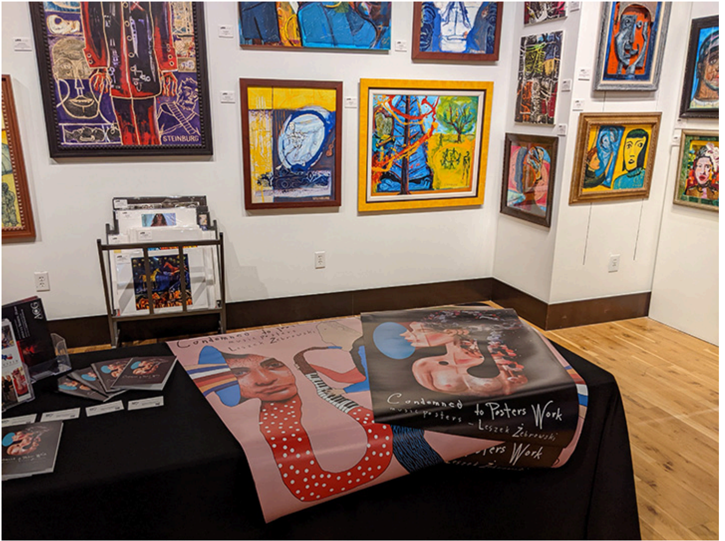
W Galerii AO5