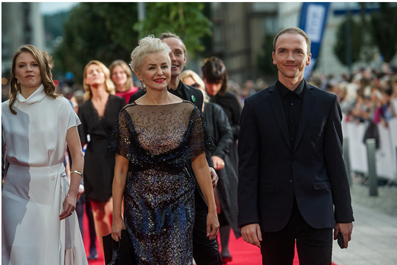
Gdynia. Teatr Muzyczny. 44. Festiwal Polskich Filmów Fabularnych w Gdyni. Gala zamknięcia. Nz twórcy filmu pt. „Boże ciało”. Aktorka Aleksandra Konieczna oraz Jan Komasa. 20.09.2019