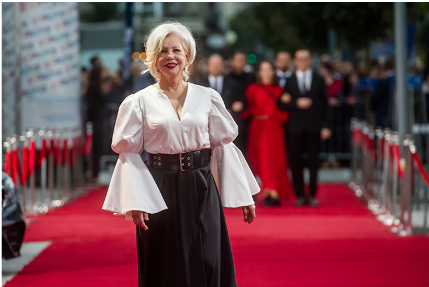
Gdynia. Teatr Muzyczny. 44. Festiwal Polskich Filmów Fabularnych w Gdyni. Gala zamknięcia. Nz Małgorzata Zajączkowska. 20.09.2019