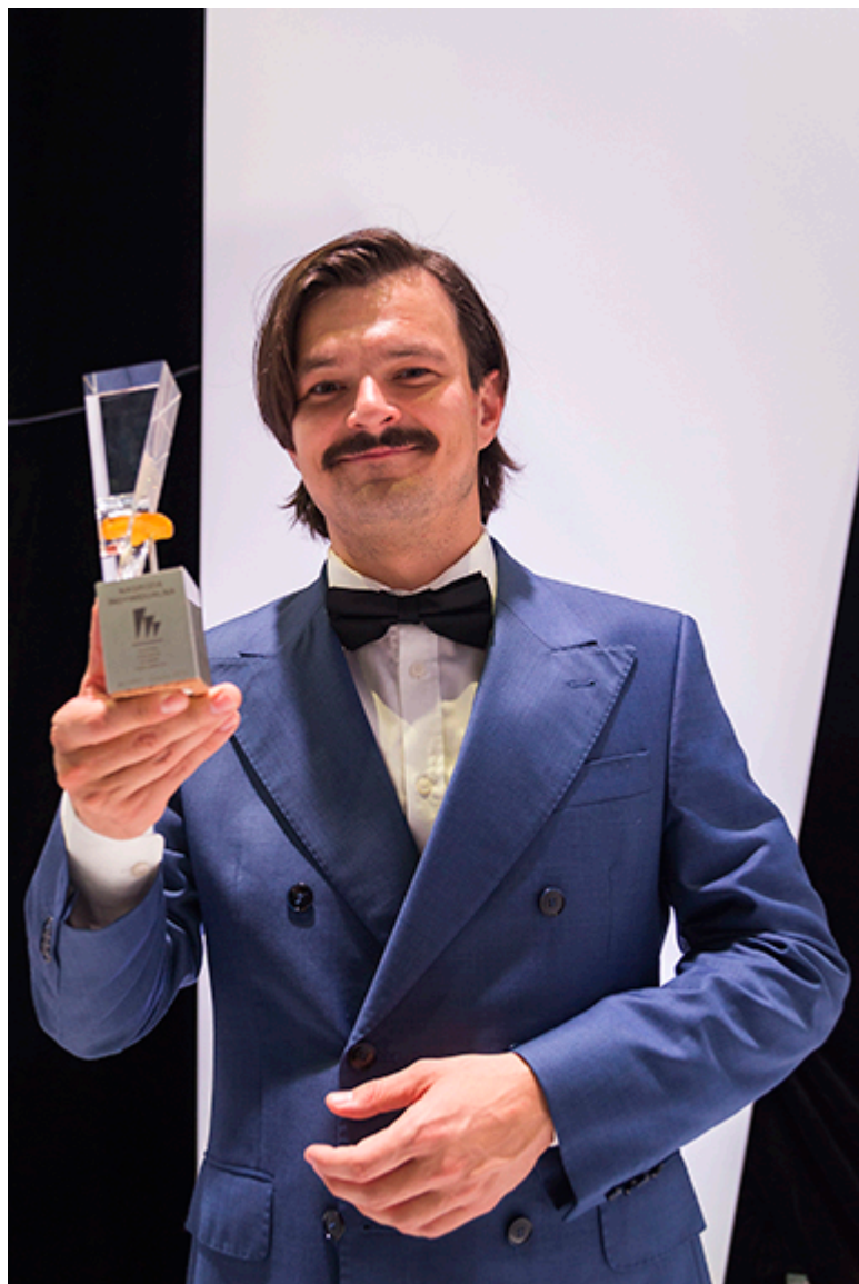
44. Festiwal Polskich Filmów Fabularnych w Gdyni. Gala finałowa w Teatrze Muzycznym. Nz. Dawid Ogrodnik ze statuetką za główną rolę męską w filmie „Ikar. Legenda Mietka Kosza” 21.09.2019