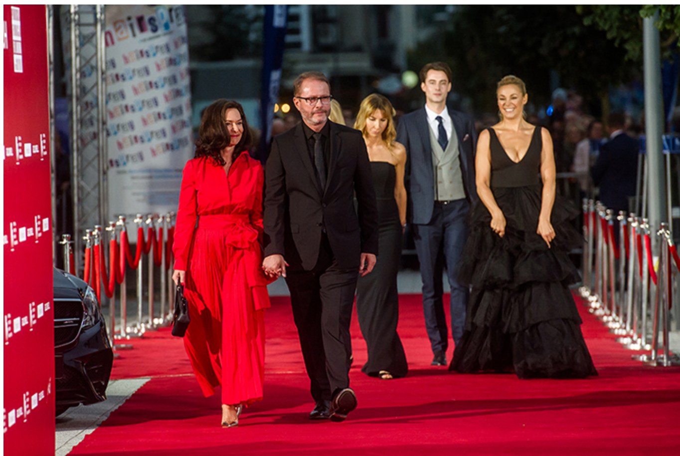
Gdynia. Teatr Muzyczny. 44. Festiwal Polskich Filmów Fabularnych w Gdyni. Gala zamknięcia. Nz twórcy filmu pt. „Czarny Mercedes”, m.in. Artur Żmijewski, Sonia Bohosiewicz. 20.09.2019