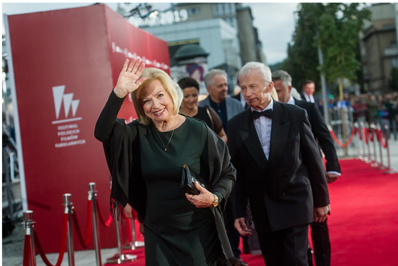
Gdynia. Teatr Muzyczny. 44. Festiwal Polskich Filmów Fabularnych w Gdyni. Gala zamknięcia. Nz Jury konkursu głównego. Bożena Dykiel. 20.09.2019