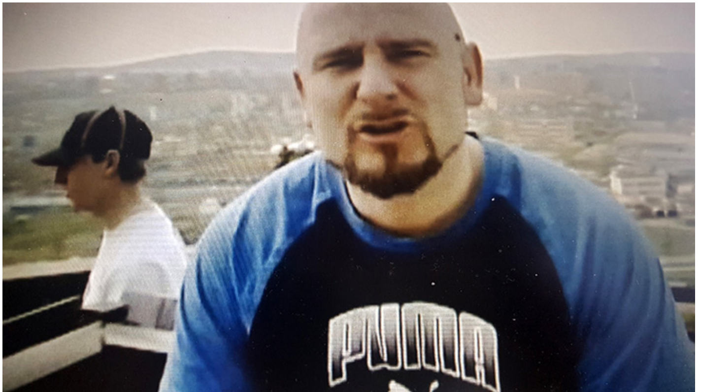
Kadr z filmu „Amnezja”, Liroy