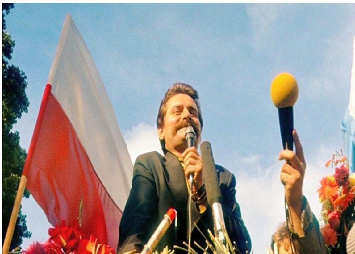
Kadr z filmu „My, Naród”

Film ujawnia nieznane kulisy słynnego wystąpienia Lecha Wałęsy w Kongresie USA w 1989 r. oraz unikalny, zapomniany i nie pokazywany wcześniej materiał archiwalny.