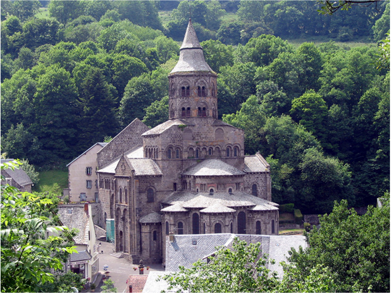
Bazylika Matki Boskiej w Orcivalu.

Obiad jedliśmy w restauracji z widokiem na zamrożone jezioro wśród gór. Czy to było jezioro Chambon, Aydat czy des Servières, w tej chwili trudno mi odpowiedzieć, ale prawdopodobnie des Servières. W każdym razie potem zwiedziliśmy romański kościół Św. Nektara ( église de Saint-Nectaire ) też z XII w. Stoi w dolinie, u stóp zalesionych wzgórz. Przepięknych głowic jest tam sto trzy i wszystkie przedstawiają jakieś sceny: walkę aniołów z demonami, kuszenie Chrystusa, grę osła na lirze, ujeżdżanie kozła przez człowieka... I tu polichromowana romańska figurka Matki Boskiej z