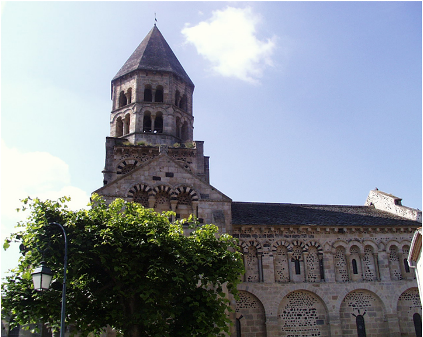
Notre-Dame de Saint-Saturnin. Owerria.

W 1999 roku w czasie pobytu w Clermont-Ferrand pojechałem pociągiem do Issoire w towarzystwie młodej Kubanki. Jest tam dość przysadzisty romański kościół Świętego Stremoniusza ( Saint-Austremoine ), z XII w. Wewnątrz pomalowany w 1859 roku na jaskrawy czerwony kolor. Kapitele w większości nawiązują do Pasji Chrystusa, ale są też sceny mityczne, pasterskie. Pod chórem wspaniała krypta. Witraże ukazują sceny z życia Świętego Stremoniusza.