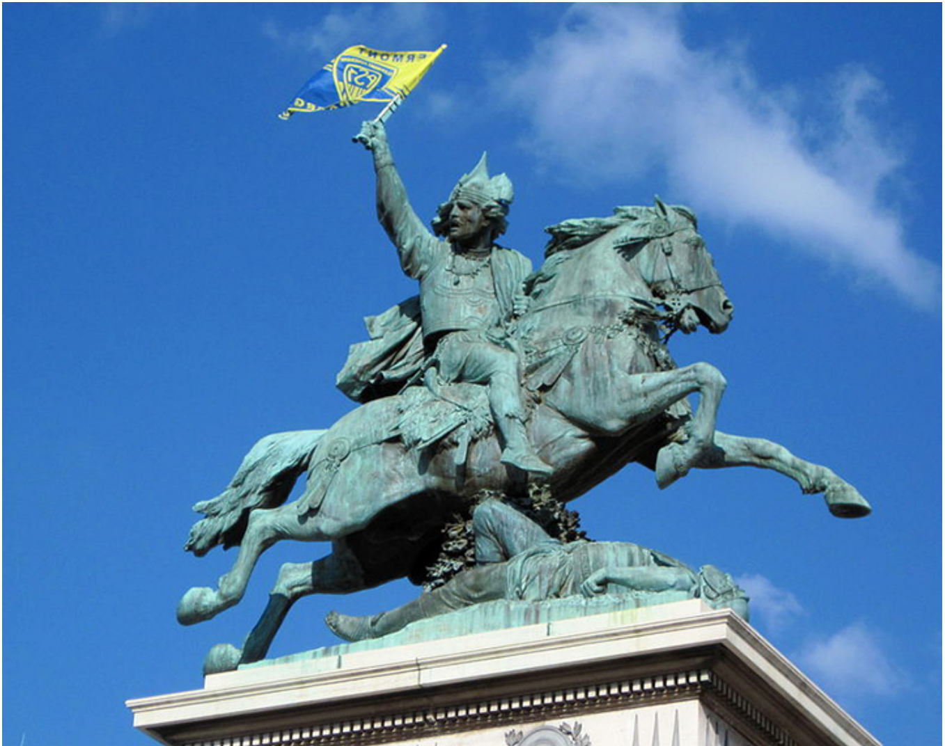
Pomnik Wercyngetoryksa w Clermont-Ferrand (Owernia).

W mieście, na placu Jaude, monumentalny pomnik na koniu, z uniesioną szpadą, urodzonego właśnie w Owernii galijskiego wodza, Wercyngetoryksa, który walczył z wojskiem Juliusza Cezara. Klasyczną budowlą romańską jest bazylika Matki Boskiej z Portu ( Notre-Dame du-Port ), z XII-XIII w., harmonijna, proporcjonalna, z prezbiterium ozdobionym na zewnątrz delikatną mozaiką. Zbudowana jest z jasnej arkozy. Rzeźby na kapitelach kolumn przedstawiają sceny biblijne lub pochodzące z Psychomachii Prudencjusza.