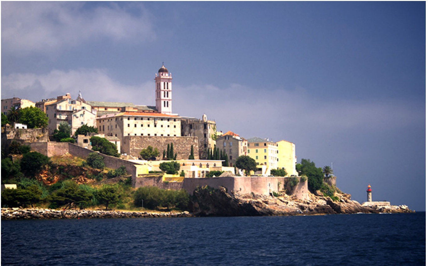
Cytadela w Bastii na Korsyce.