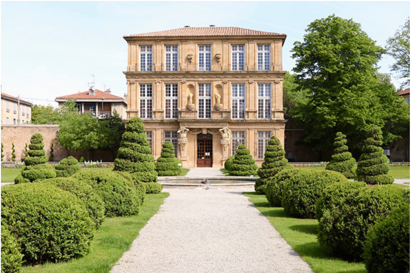
Pałacyk w Aix-en-Provence.