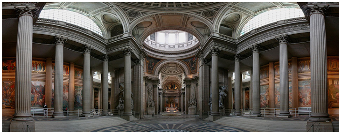
Wnętrze Panteonu w Paryżu.