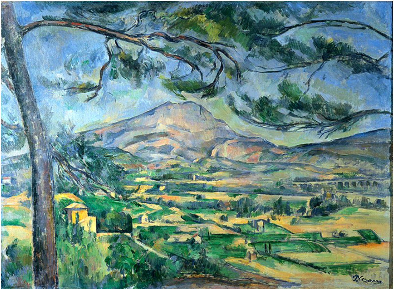
Paul Cézanne - Góra Sainte-Victoire z wielką sosną.

Ostatnią podróż do Francji odbyłem we wrześniu 2009 roku. Była to wycieczka po najbardziej malowniczych, często mało znanych, miasteczkach francuskich. Trasa wiodła wielkim łukiem od południowego wschodu Francji przez Prowansję, Oksytanię, Nową Akwitanie, Dolinę Loary, Normandię, Paryż, Szampanię, do Alzacji. Spróbuję wymienić tylko te miasteczka, które zrobiły na mnie największe wrażenie, a więc najpiękniejsze okazały się dwa: Moustiers Sainte-Marie w Prowansji i Saint-Circ-Lapopie w Oksytanii, oba położone w bardzo malowniczej okolicy. Pierwsze u stóp gigantycznych skał, a drugie na zboczu skalistego kanionu rzeki Lot.