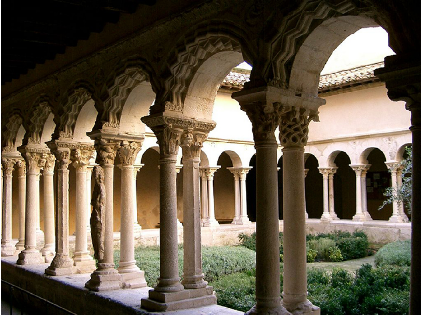
Wirydarz Klasztoru św. Zbawiciela w Aix-en-Provence.