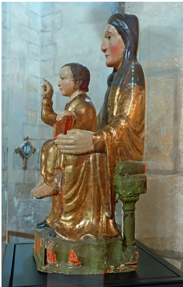
Matka Boska z Saint-Saturnin. Owernia.