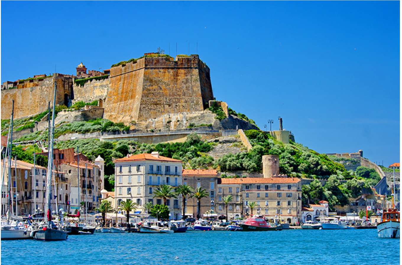
Port i Stare Miasto w Bonifacio na Korsyce.