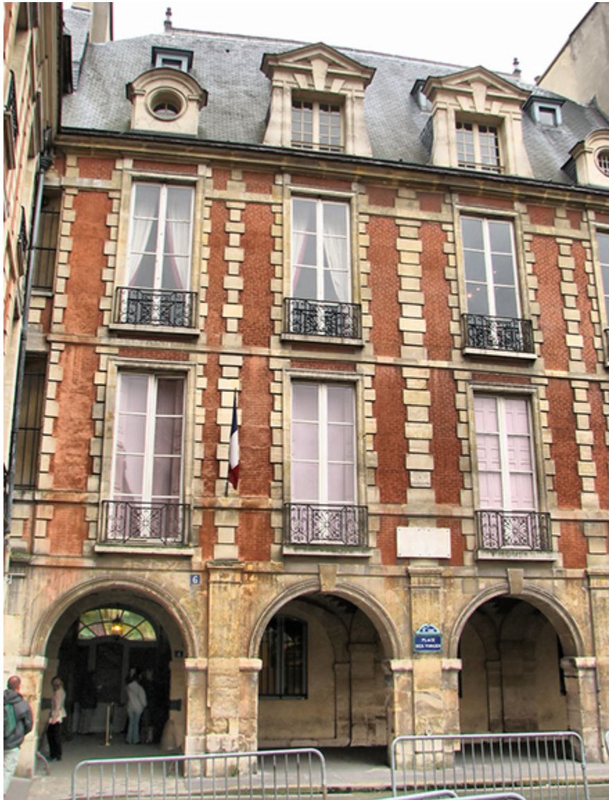
Dom Wiktora Hugo na Placu Wogezów w Paryżu.

Odwiedziłem także Instytut Świata Arabskiego ( Institut du Monde Arabe ), przy Placu Mohammeda V. Powstał w 1987 roku. W muzeum zgromadzono ogromną ilość rekwizytów charakterystycznych dla krajów arabskich, także zabytki (mozaiki tunezyjskie, stroje, naczynia, kafelki). W ciągu kilku dni zobaczyłem sporo ciekawych rzeczy.