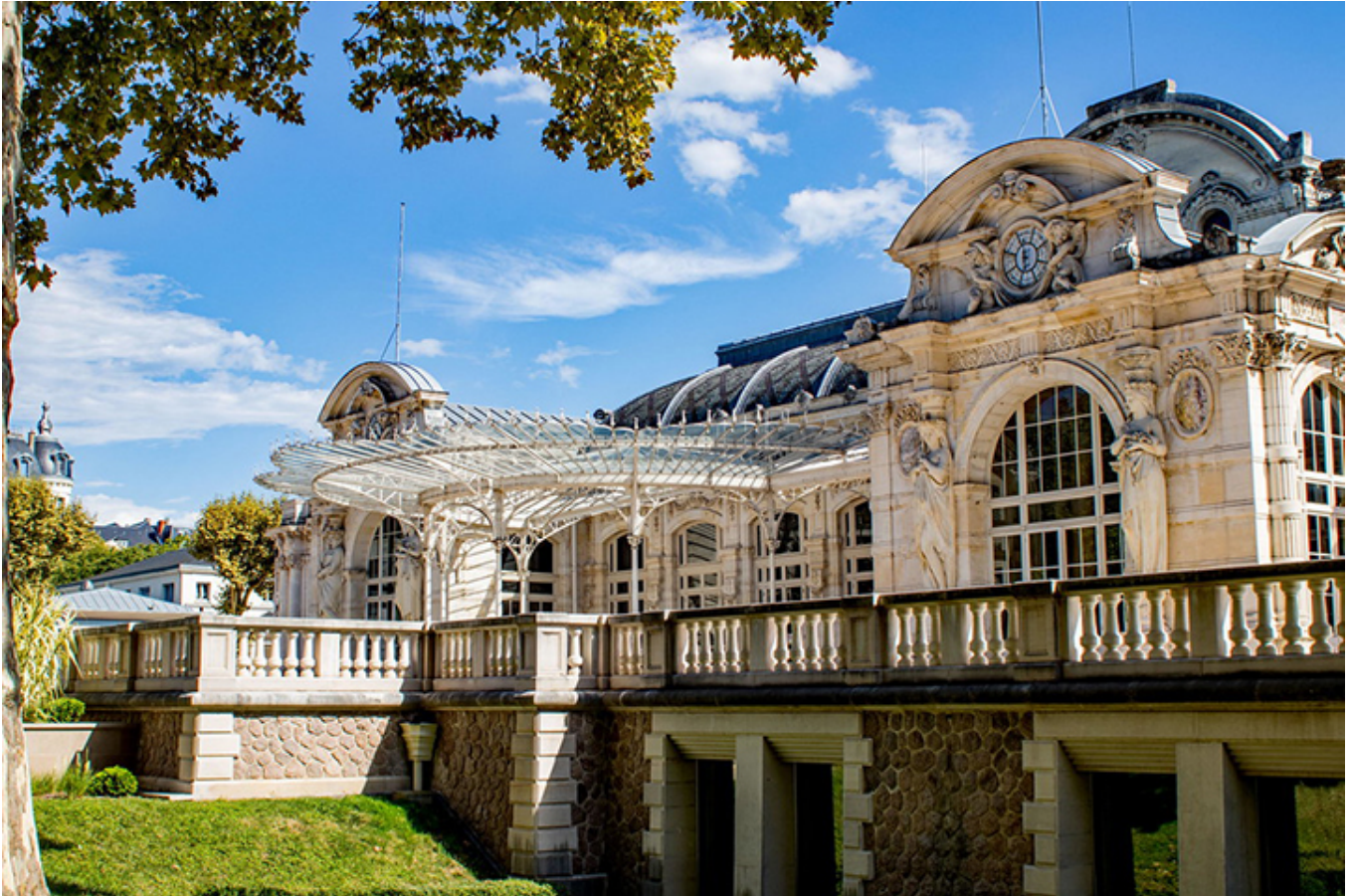
Dom Zdrojowy w Vichy. Owernia.

W Paryżu zamieszkałem w hotelu PAN-u na ulicy Lauriston, niedaleko Placu Gwiazdy. Zwiedziłem wówczas bardzo dokładnie Muzeum D'Orsay z ogromną ilością obrazów impresjonistów. Monet, Manet, Cézanne, Renoir, Degas, Courbet, Gauguin... Wspaniała kolekcja! Oprócz tego, Panteon w Dzielnicy Łacińskiej. Ta wizyta miała na celu głównie obejrzenie grobowca jedynej kobiety tam pochowanej, czyli Marii Skłodowskiej-Curie. Aliści zarówno jej prochy, jak i jej męża, Piotra Curie, sprowadzono do Panteonu dopiero ponad rok później, 20 kwietnia 1995 roku. Obejrzałem wtedy grobowce takich francuskich osobistości jak Wolter, Rousseau, André Malraux, Victor Hugo, Alexandre Dumas, Émile Zola, Jean Jaurès. Pod