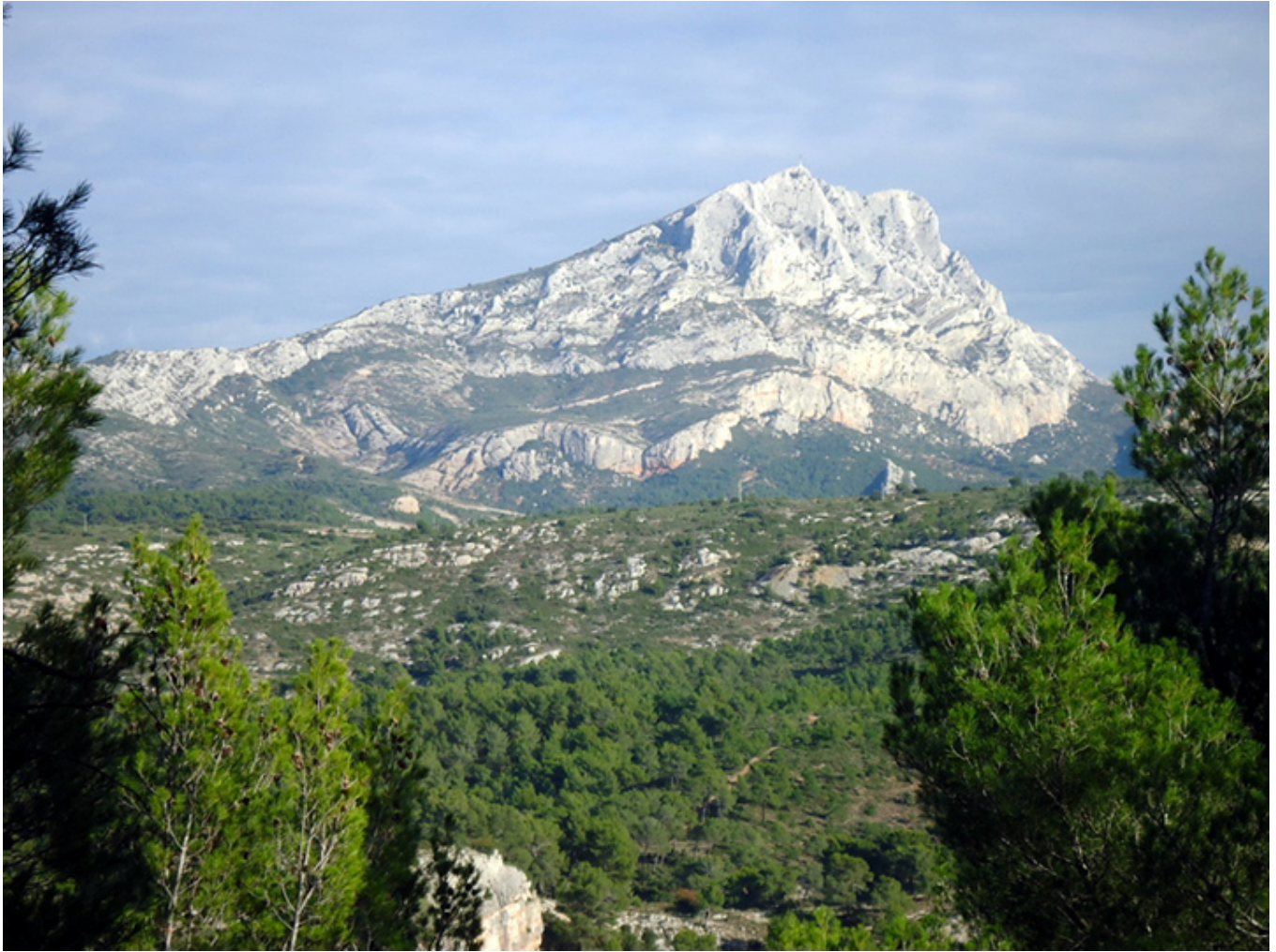
Góra Sainte-Victoire (Święta Wiktoria) malowana wielokrotnie przez Cézanne'a.