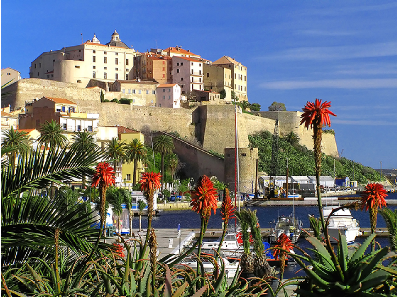
Cytadela w Calvi na Korsyce.