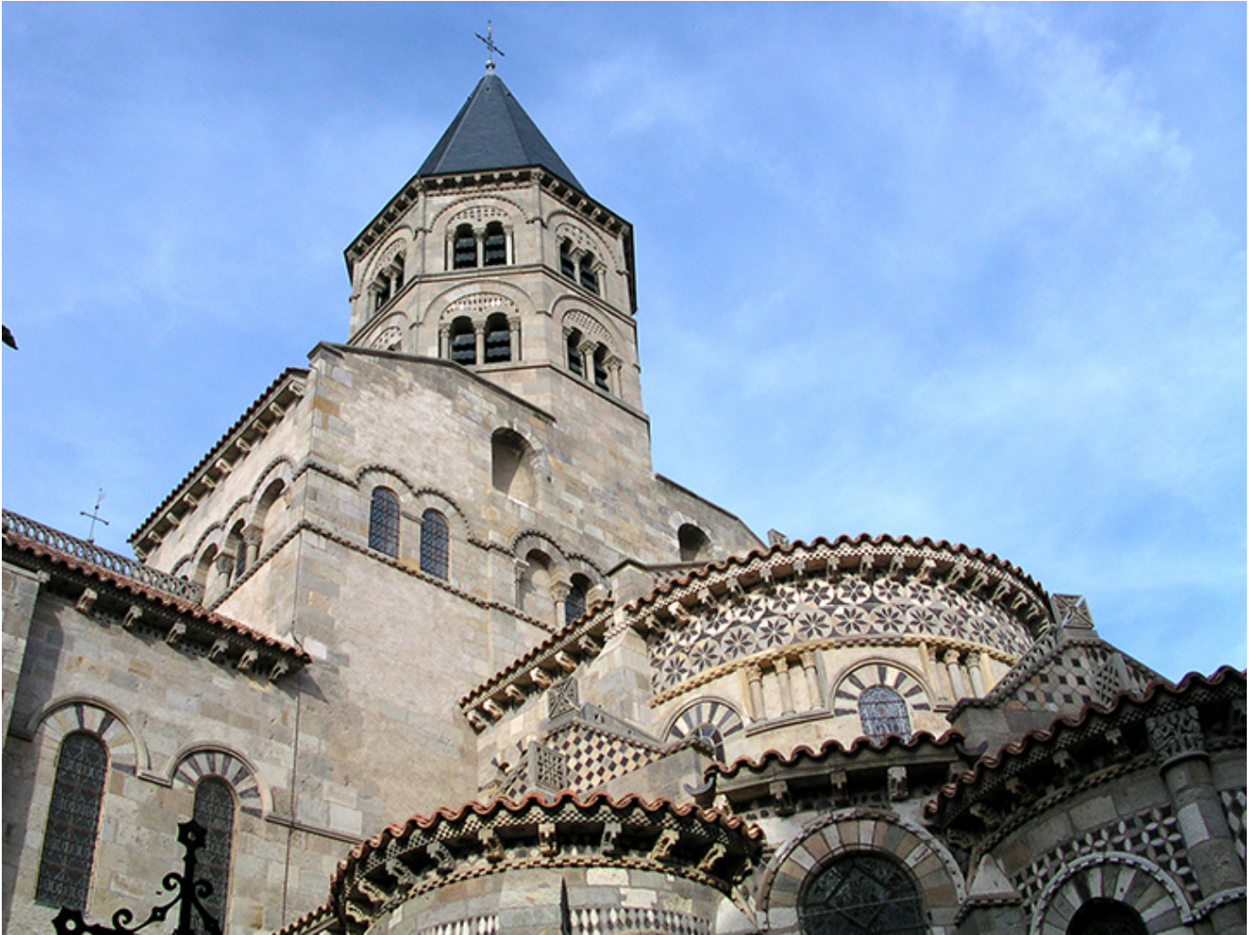
Bazylika Matki Boskiej z Portu w Clermont Ferrand (Owernia).