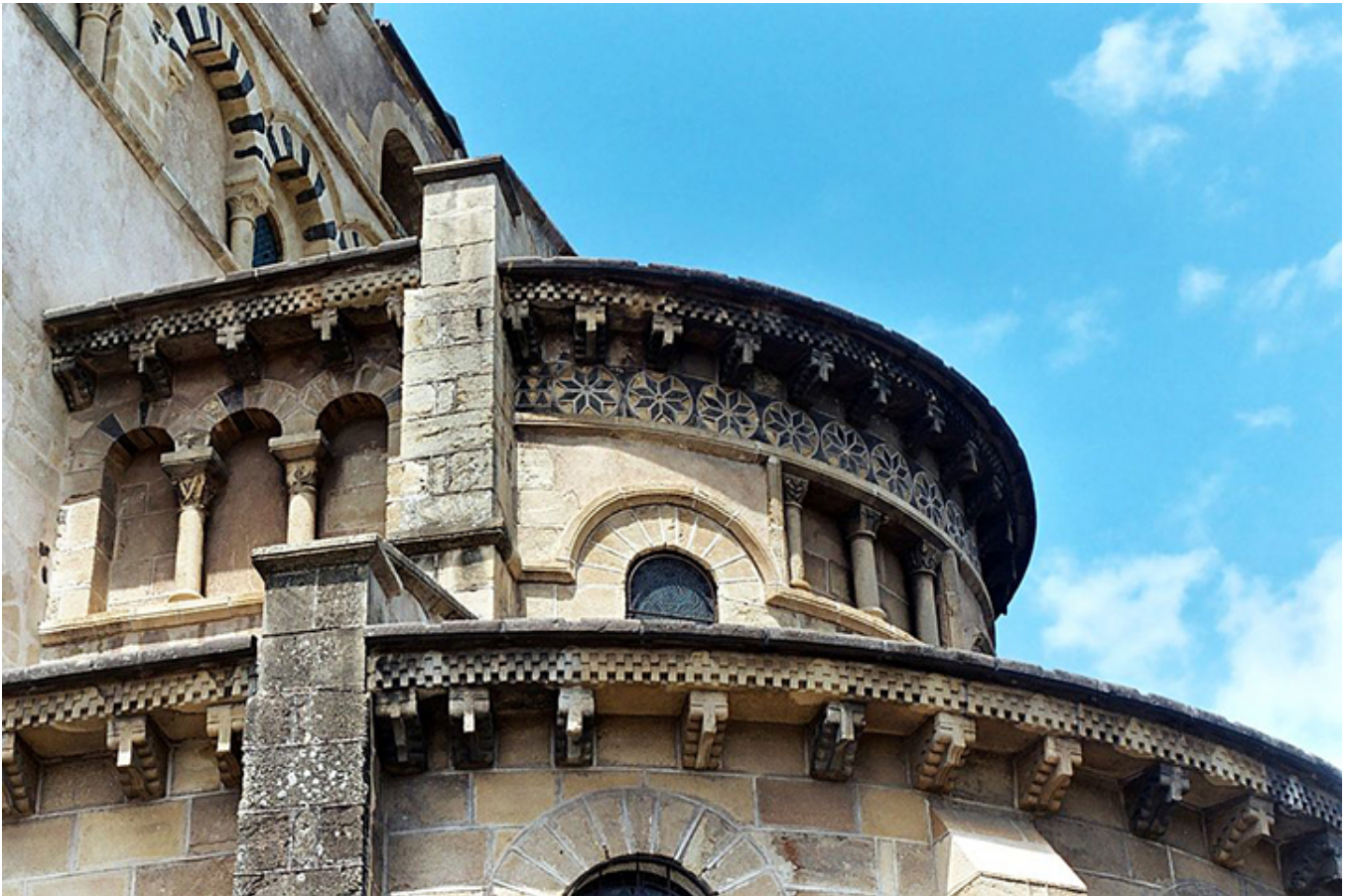
Kościół Matki Boskiej w Saint-Saturin. Owernia.

kopułą Panteonu, wśród kolumn ją otaczających, punkt widokowy na Paryż, skąd doskonale widoczne główne budowle miasta.