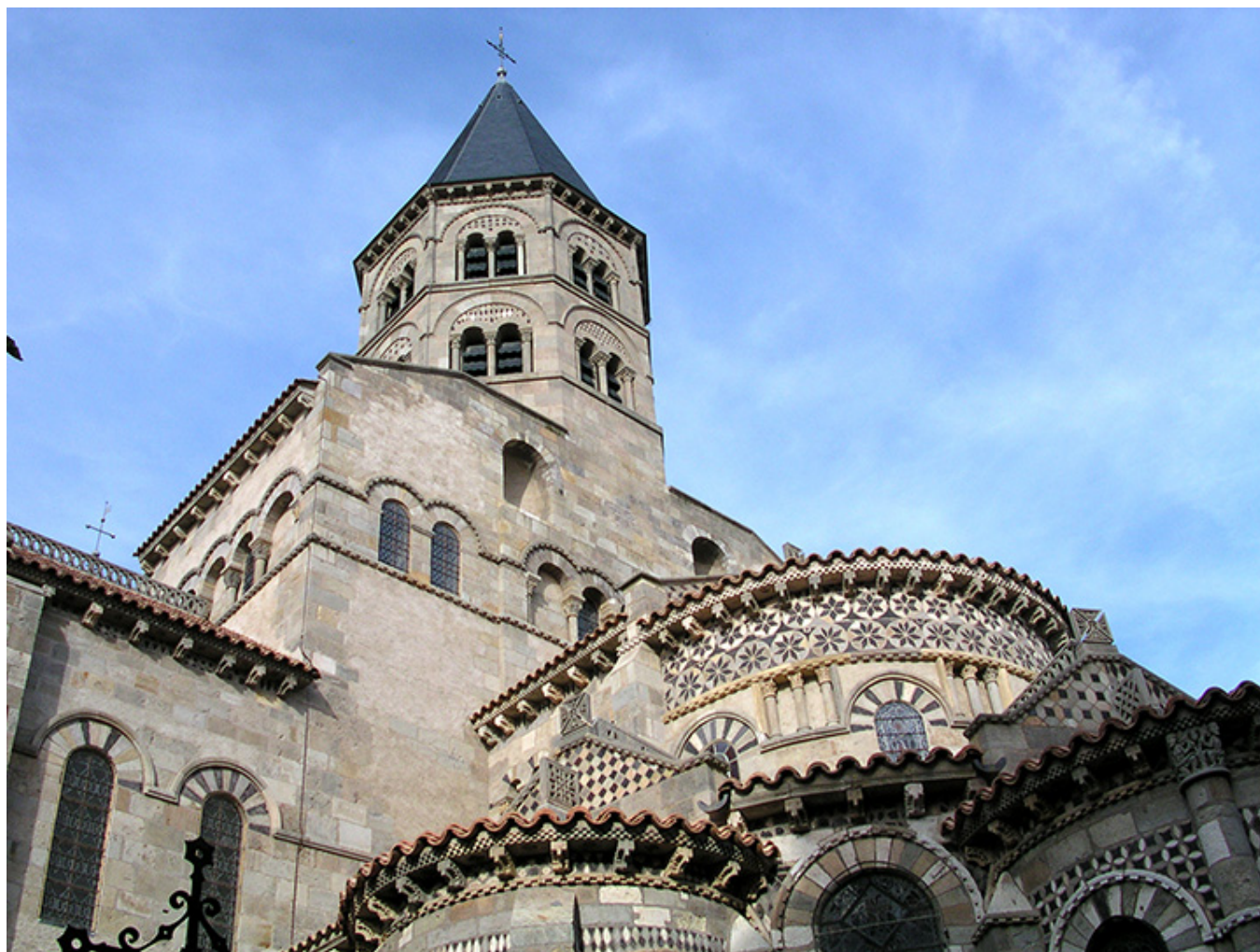
Bazylika Matki Boskiej z Portu w Clermont Ferrand (Owernia).