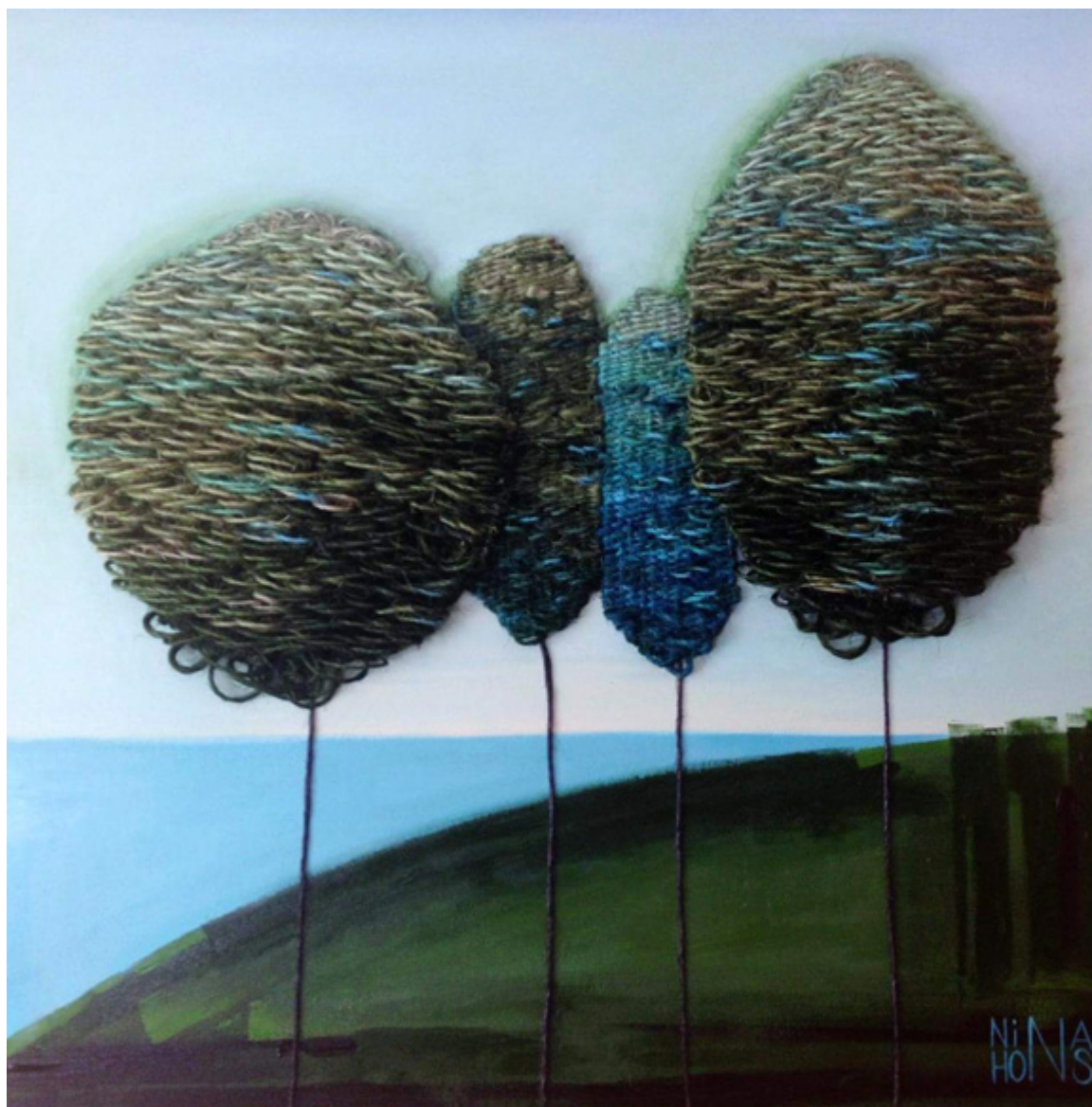
Drzewa, mix-media 40×40 inch.