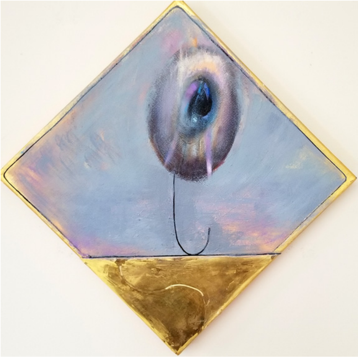
Mix-media, 20×20 inch.