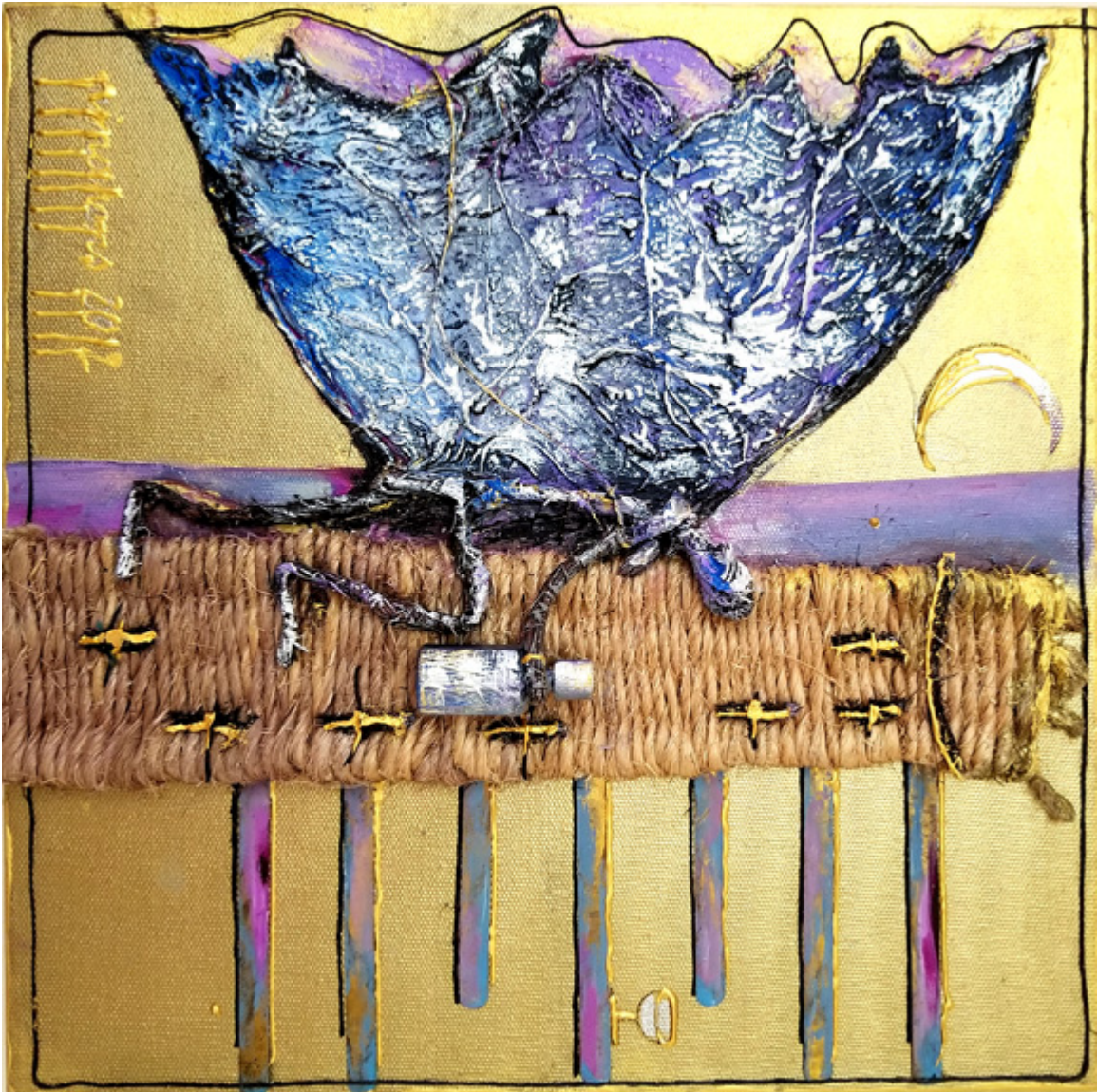
Mix-media 20×20 inch.