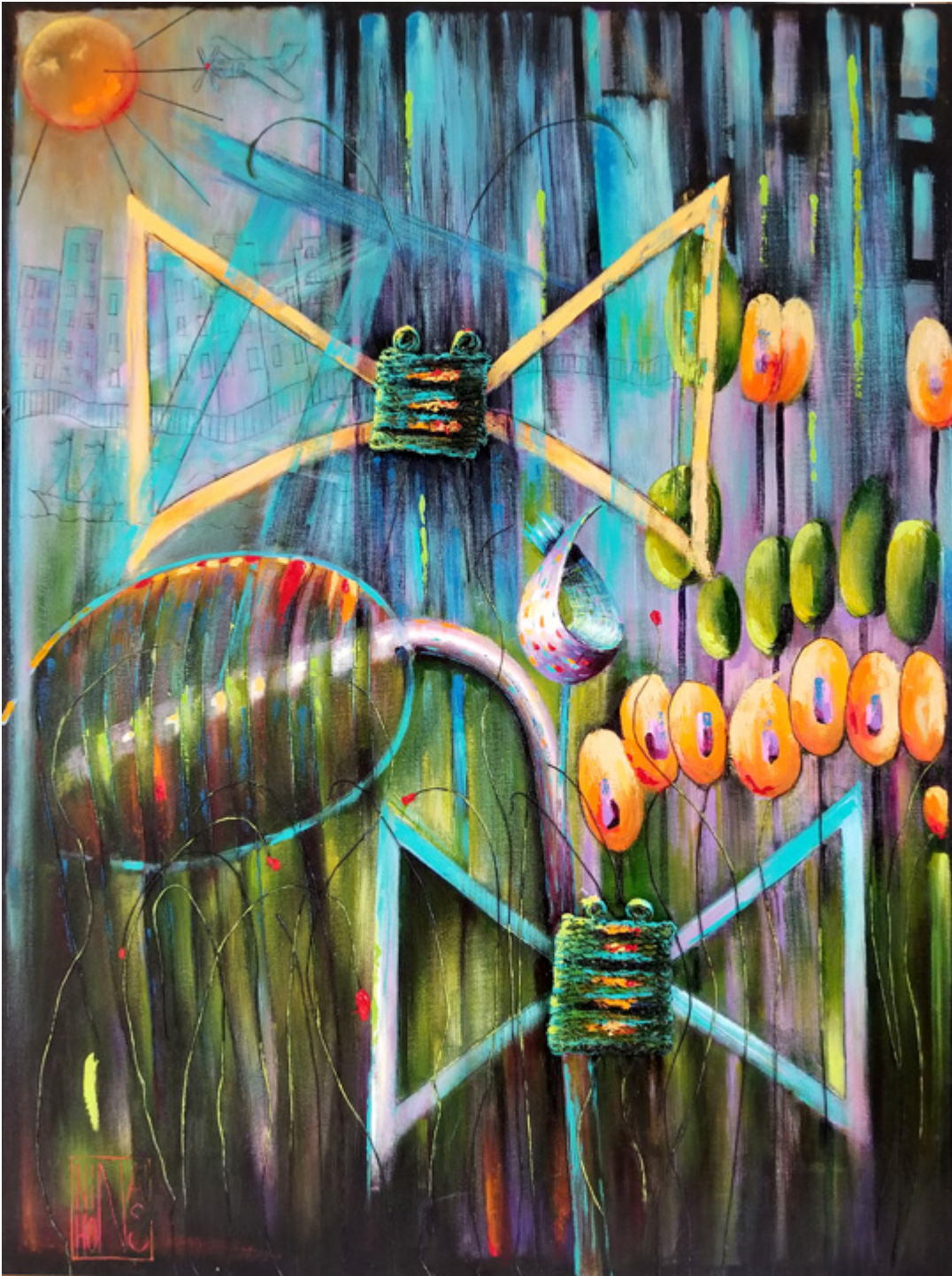
Lato, mix-media 30×40 inch.