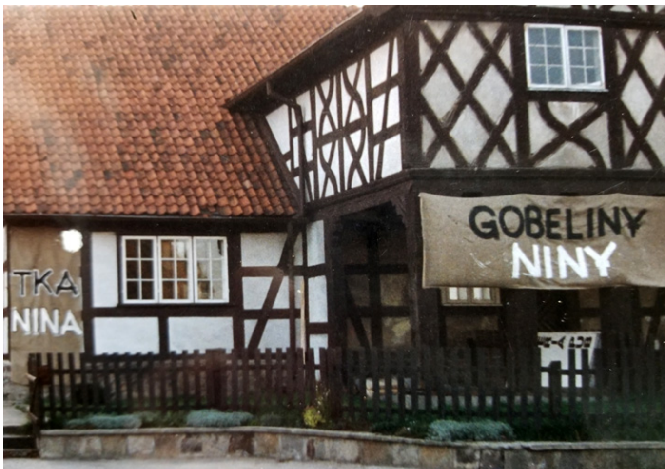
Dom w Rozynach

Urodziła nam się córka, pracowałam więc jak szalona. Pochłoneła mnie wówczas bez reszty tkanina, kochałam twardey sizal , bawiłam się kolorem i przestrzenią.