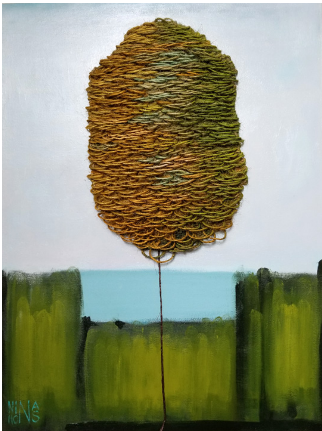
Drzewo, mix-media 30×40 inch.