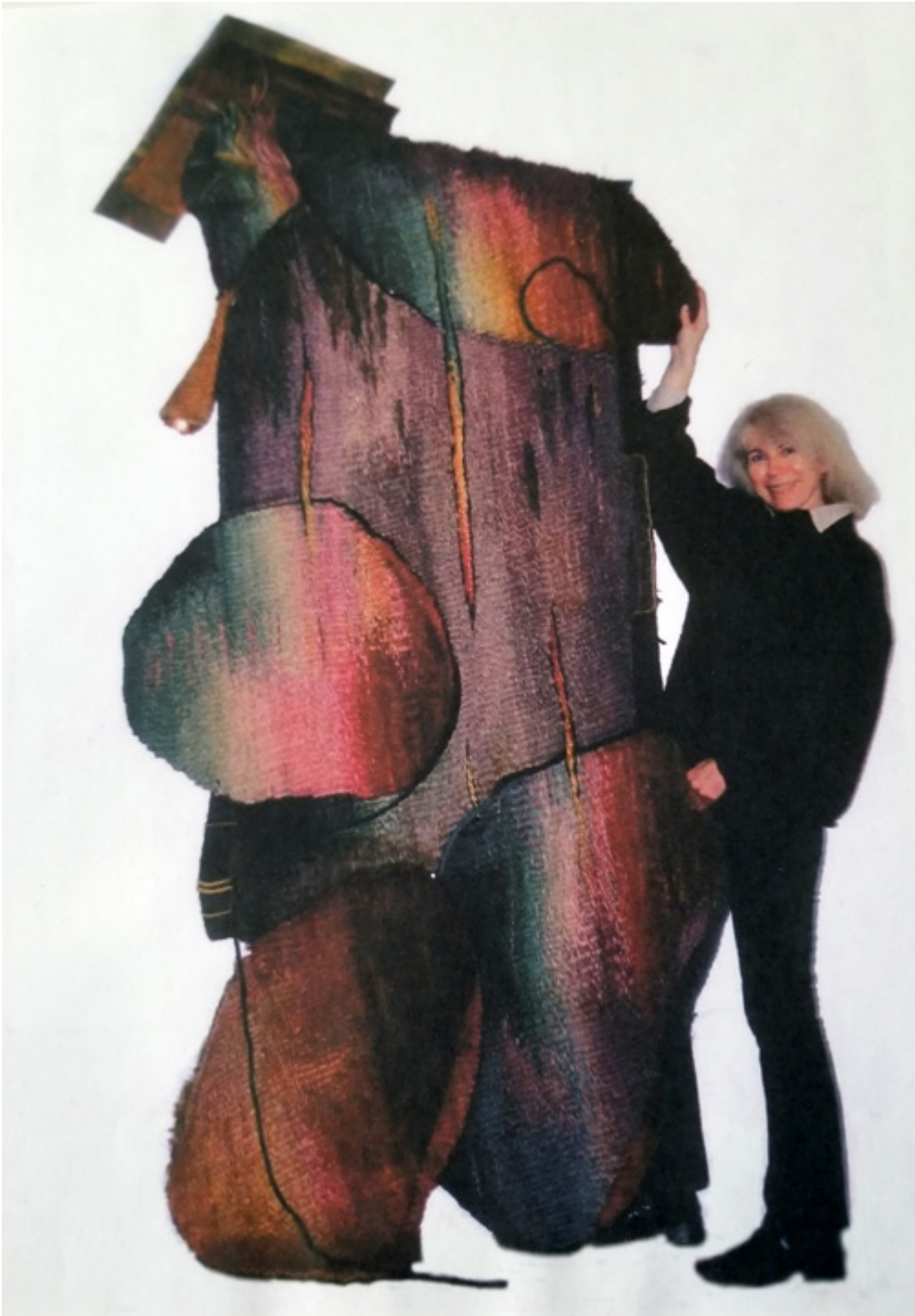
Pierwsza nagroda na wystawie w Muzeum Polskim w Chicago, 2002 r.