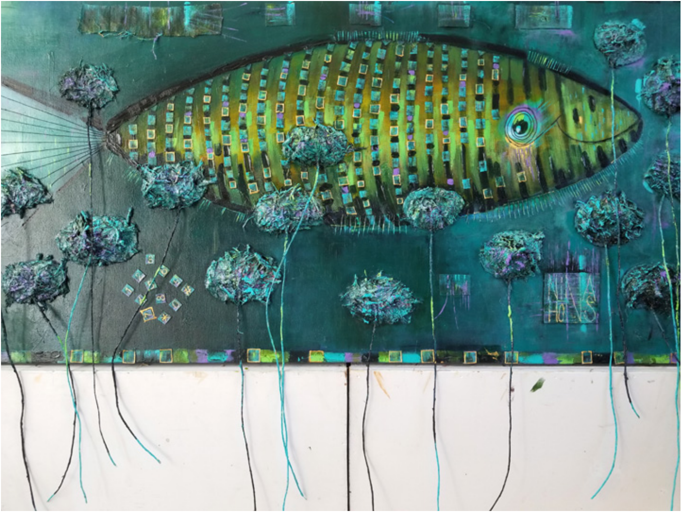
Rybka, mix-media 24×48 inch.