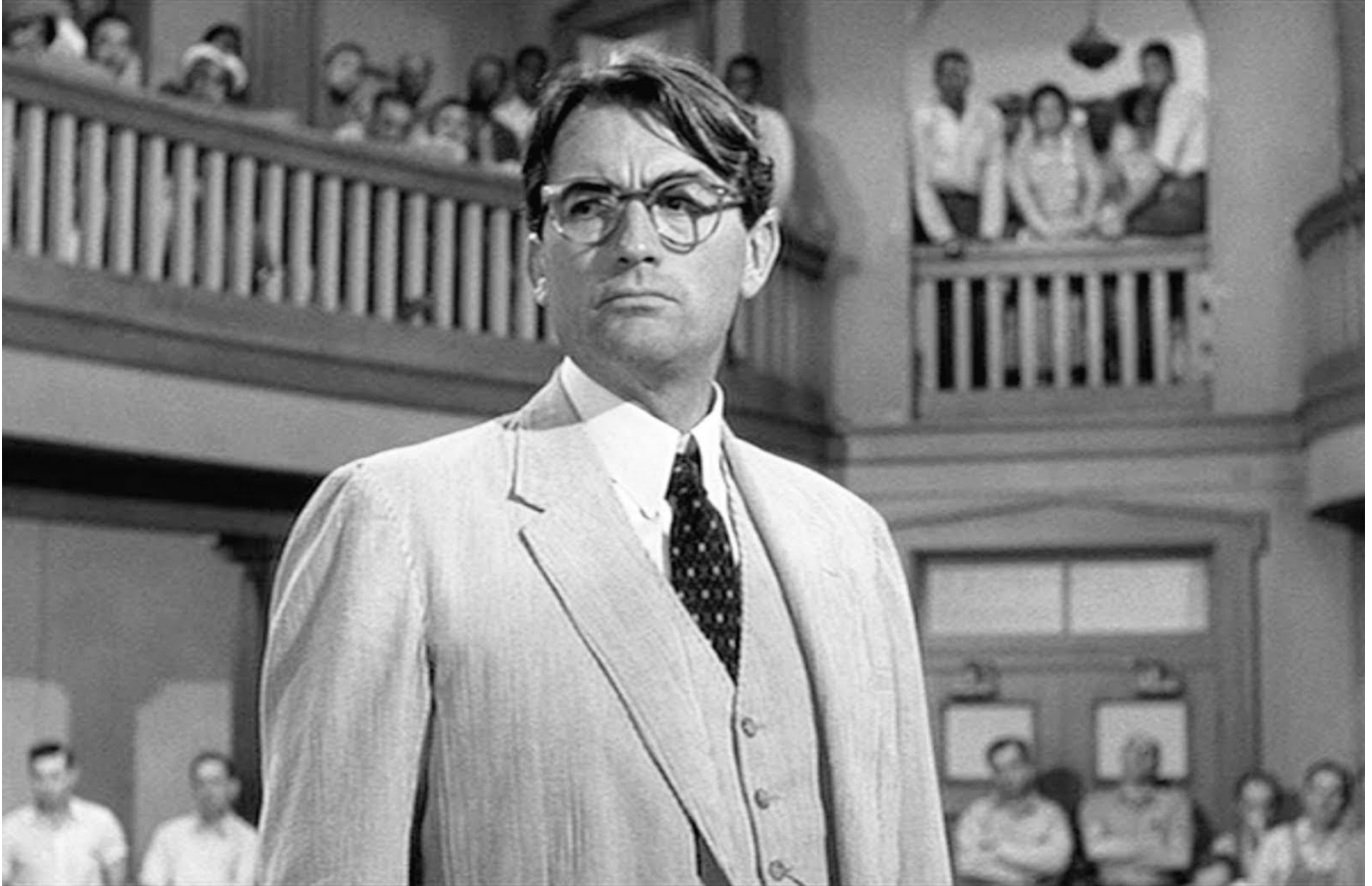
Gregory Peck w filmie „Zabić drozda”.

że był to jego najlepszy film. Miał on wymiar społeczny, dlatego pokazywany był w szkołach na lekcjach wychowania obywatelskiego. Na konferencji prasowej w Cannes, po prezentacji dokumentu o Gregorym Pecku, ktoś z sali powiedział, że właśnie dzięki filmowi „Zabić drozda” został adwokatem.