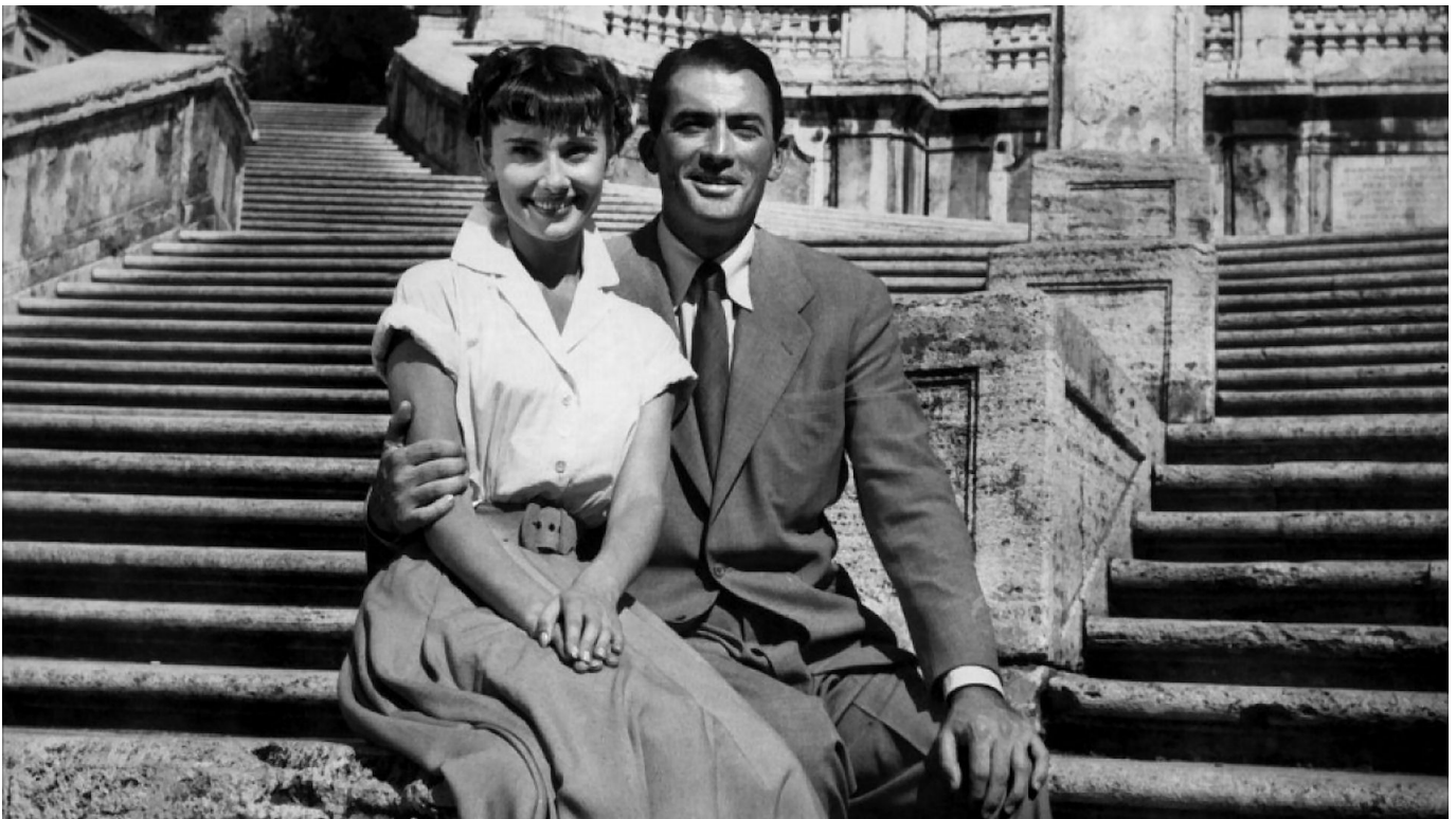
Gregory Peck i Audrey Hepburn w filmie „Rzymskie wakacje”.

znałam włoskiego i zupełnie nie wiedziałam, jak powiedzieć “nie” i “dziękuję”.