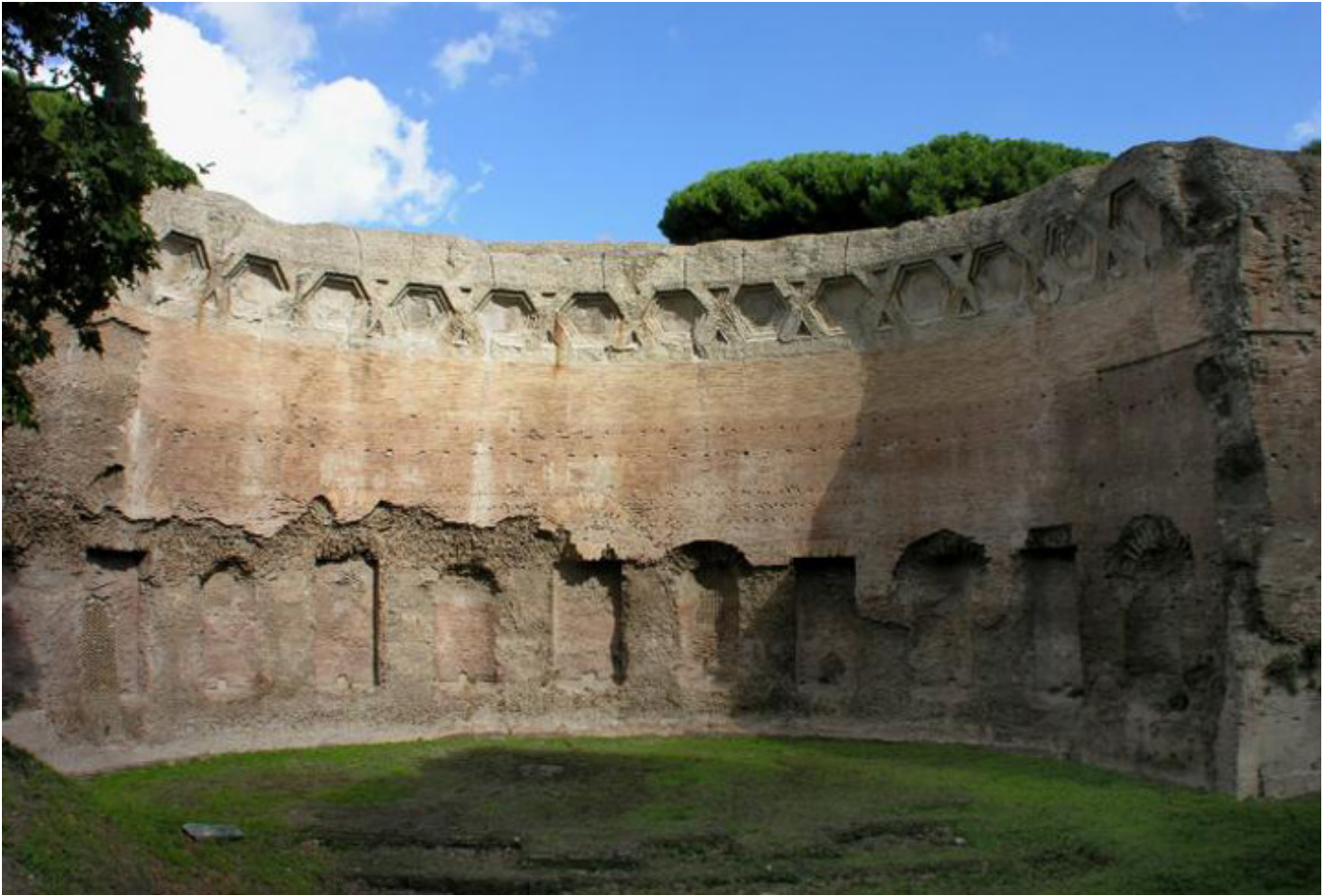
Termy Trajana