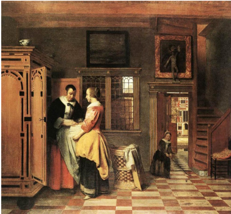
Pieter de Hooch, wnętrze z kobietami przy bielizniarce, 1663 r.

schludny, uporządkowany świat holenderskiego mieszczaństwa, w którym intarsjowana bielizniarka zajmuje centralne miejsce, zaś stojący przy drzwiach kosz z brudną bielizną symbolizuje brud i nieporządek, którego należy się wystrzegać.