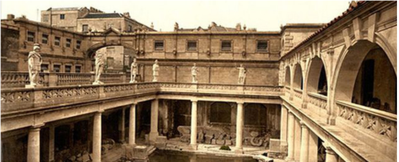
Rzymskie łaźnie odkryte w Bułgarii, fot. wikipedia.