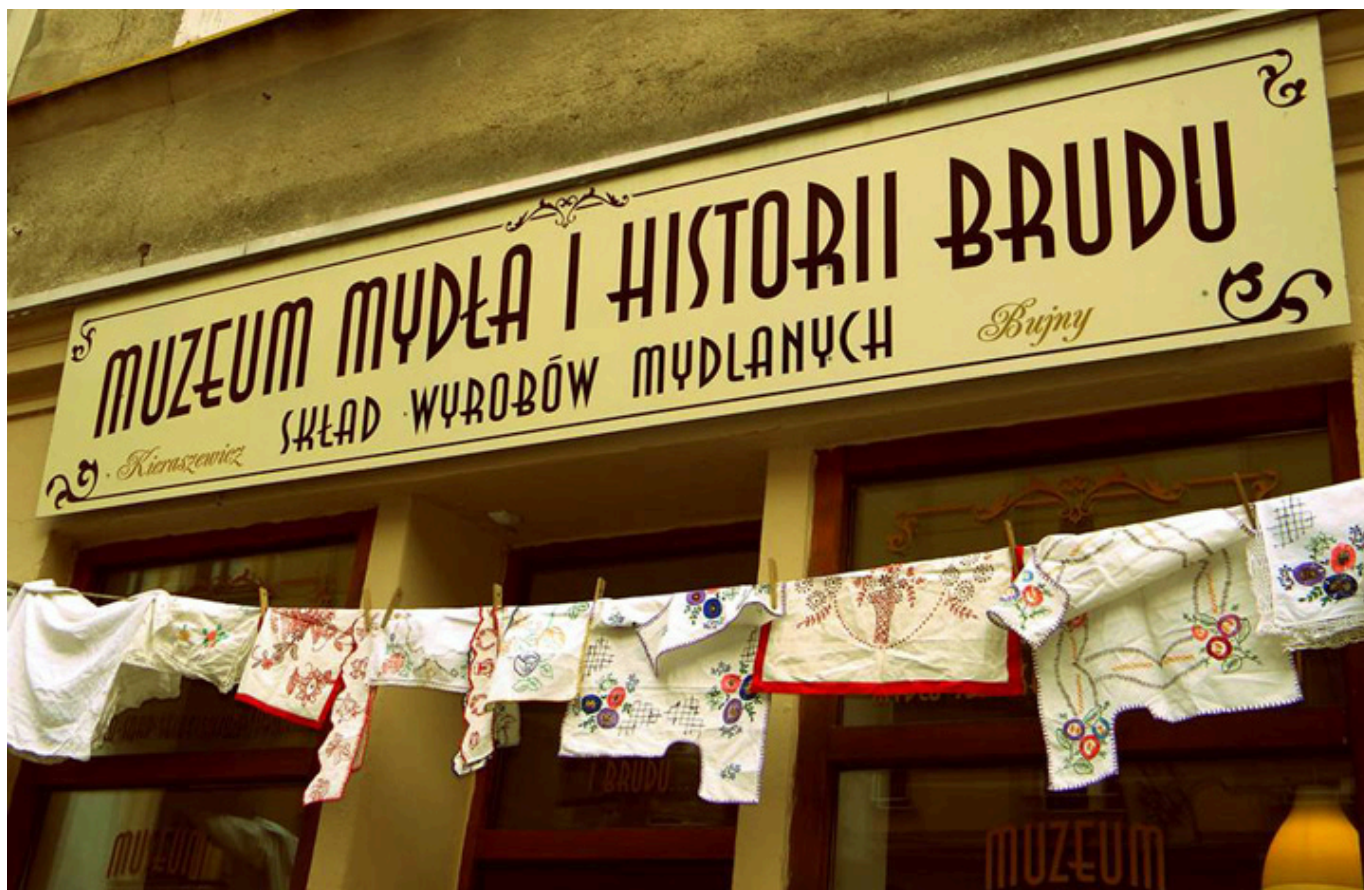
Wejście do Muzeum Mydła i Historii Brudu w Bydgoszczy.