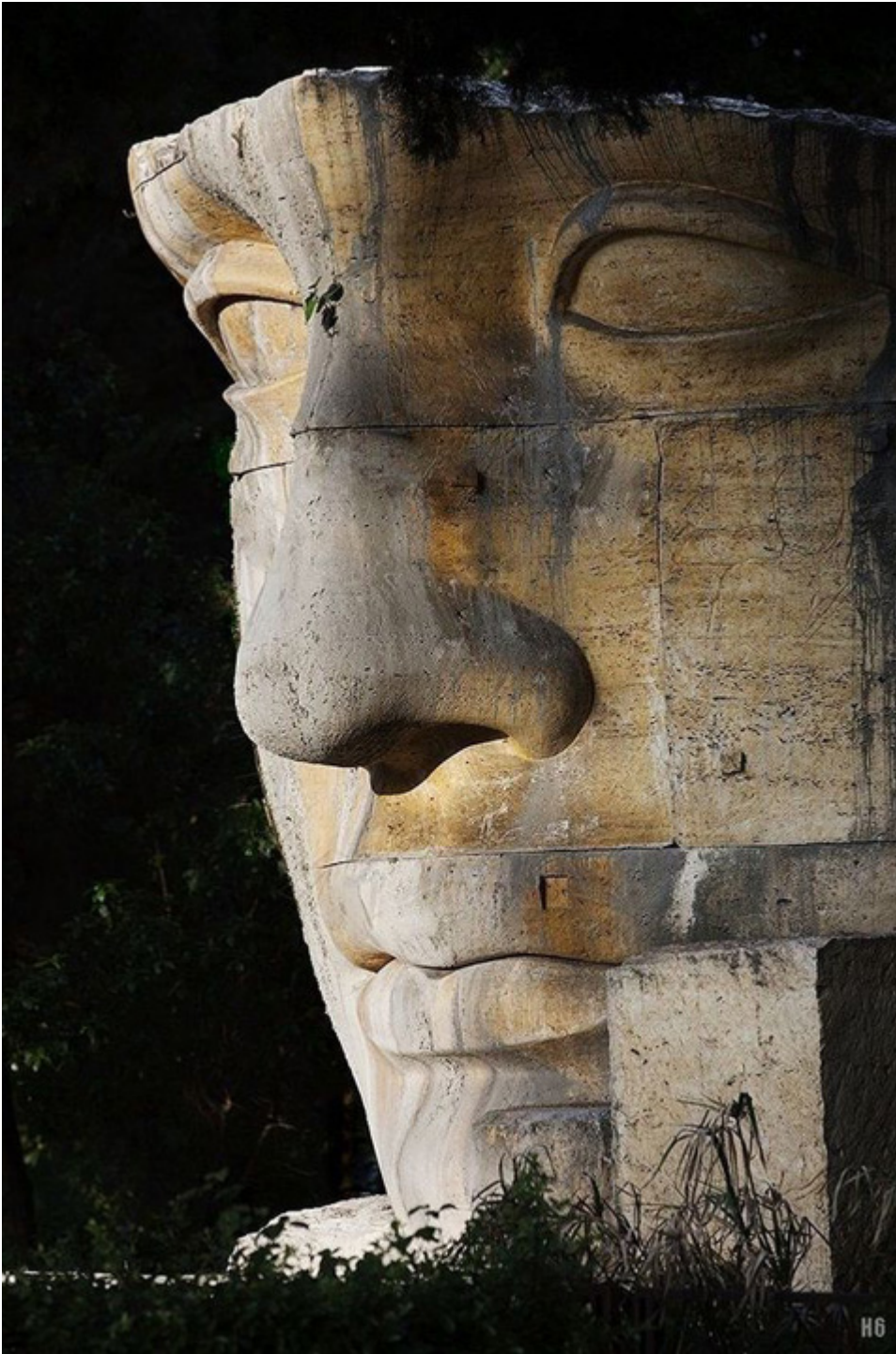
Rzeźba Igora Mitoraja w Rzymie, fot. Pinterest.