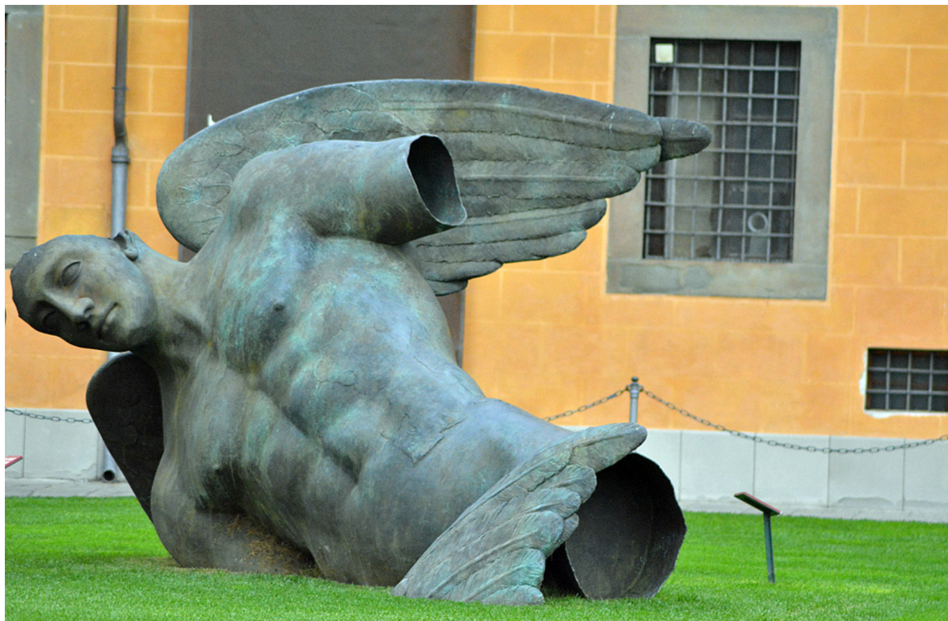
Igor Mitoraj, „Upadły Anioł” („Angelo Caduto”). Rzeźba usytuowana w pobliżu Krzywej Wieży w Pizie.