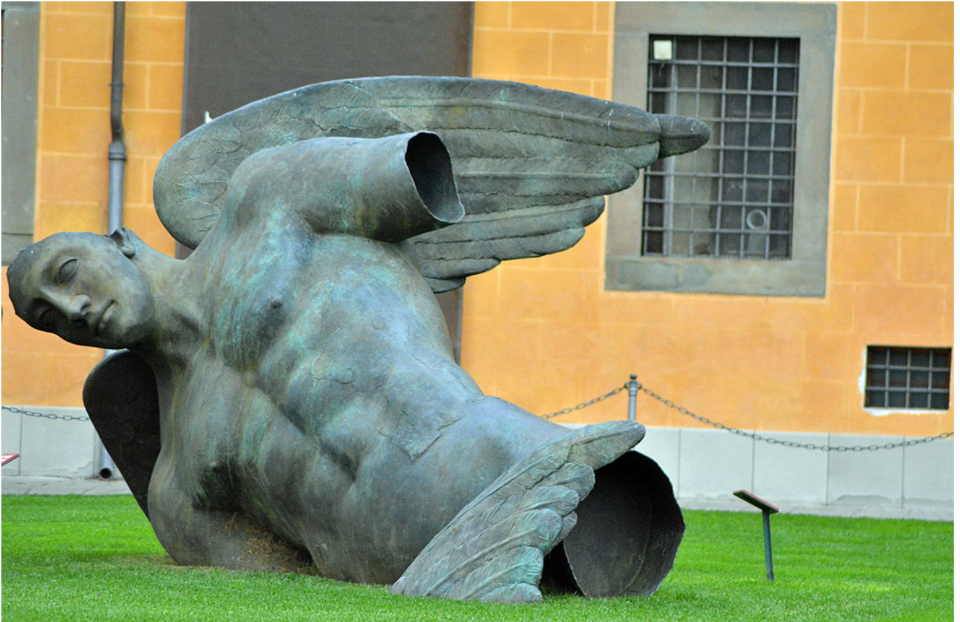
Igor Mitoraj, „Upadły Anioł” („Angelo Caduto”). Rzeźba usytuowana w pobliżu Krzywej Wieży w Pizie.