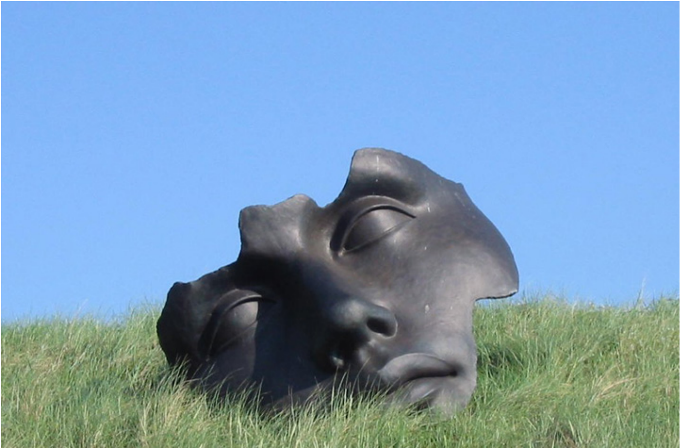
Rzeźba Igora Mitoraja w Hadze (Scheveningen), 2004 r., fot. Wikipedia.