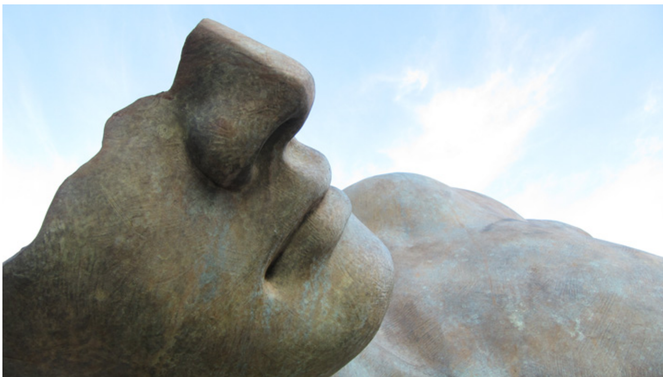
Igor Mitoraj, „Torso di Ikaros”, fot. Wikipedia.