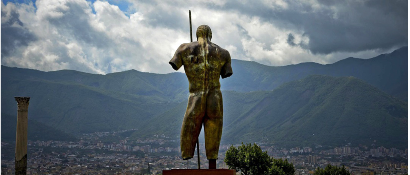
Rzeźba Igora Mitoraja „Dedal” w Pompejach

włoskiej stolicy marmuru, miasta rzeźbiarzy, gdzie tworzył m.in. Michał Anioł, namówił go kolumbijski rzeźbiarz Fernando Bolero. Tę włoską pracownię artysta uważał za „swoje miejsca na ziemi”, choć wcześniej mieszkał w Paryżu, próbował osiedlić się w Meksyku, by poznać sztukę Azteków i podróżował po Grecji, studiując antyczne dzieła sztuki.