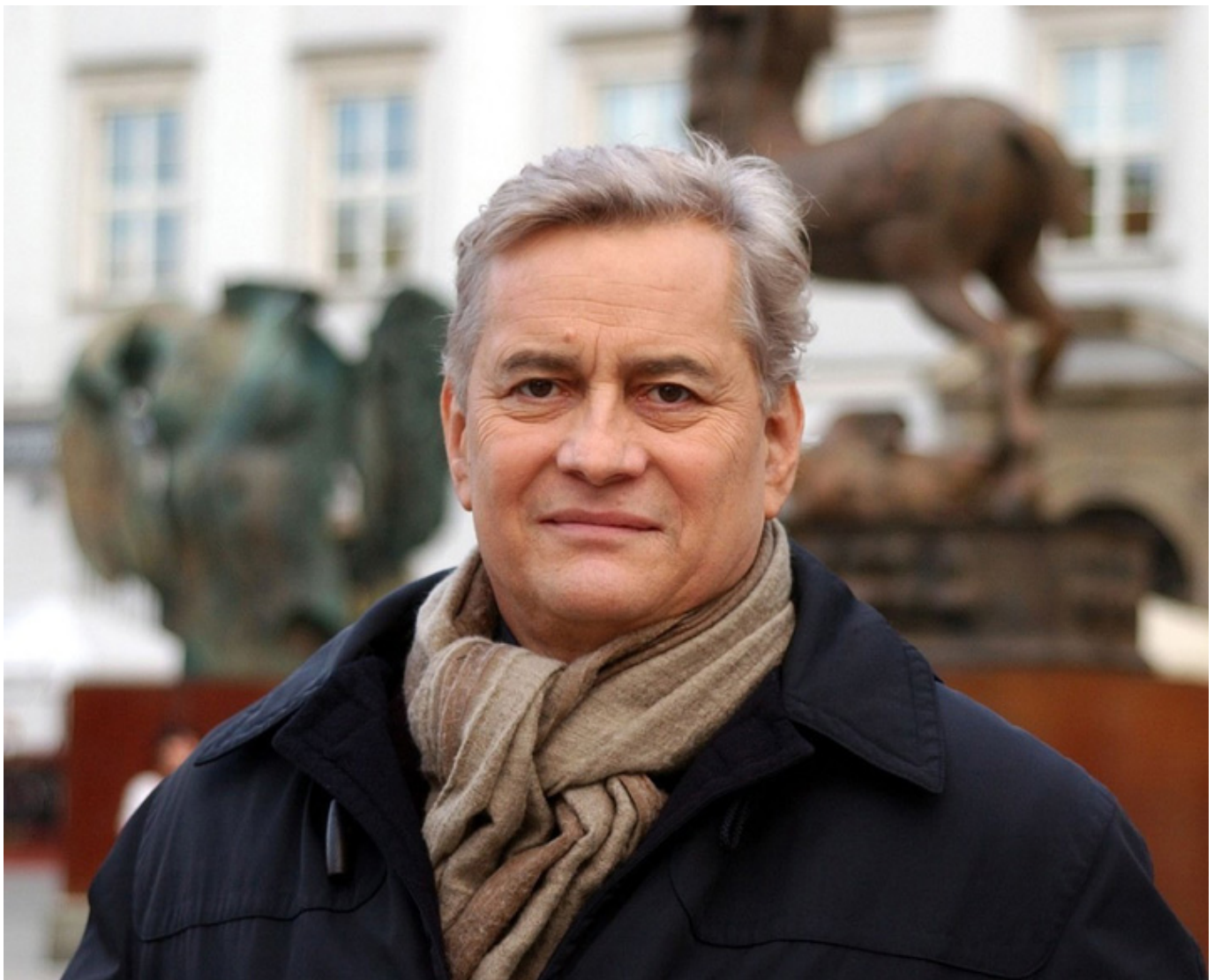
Igor Mitoraj, fot. Interia Fakty.