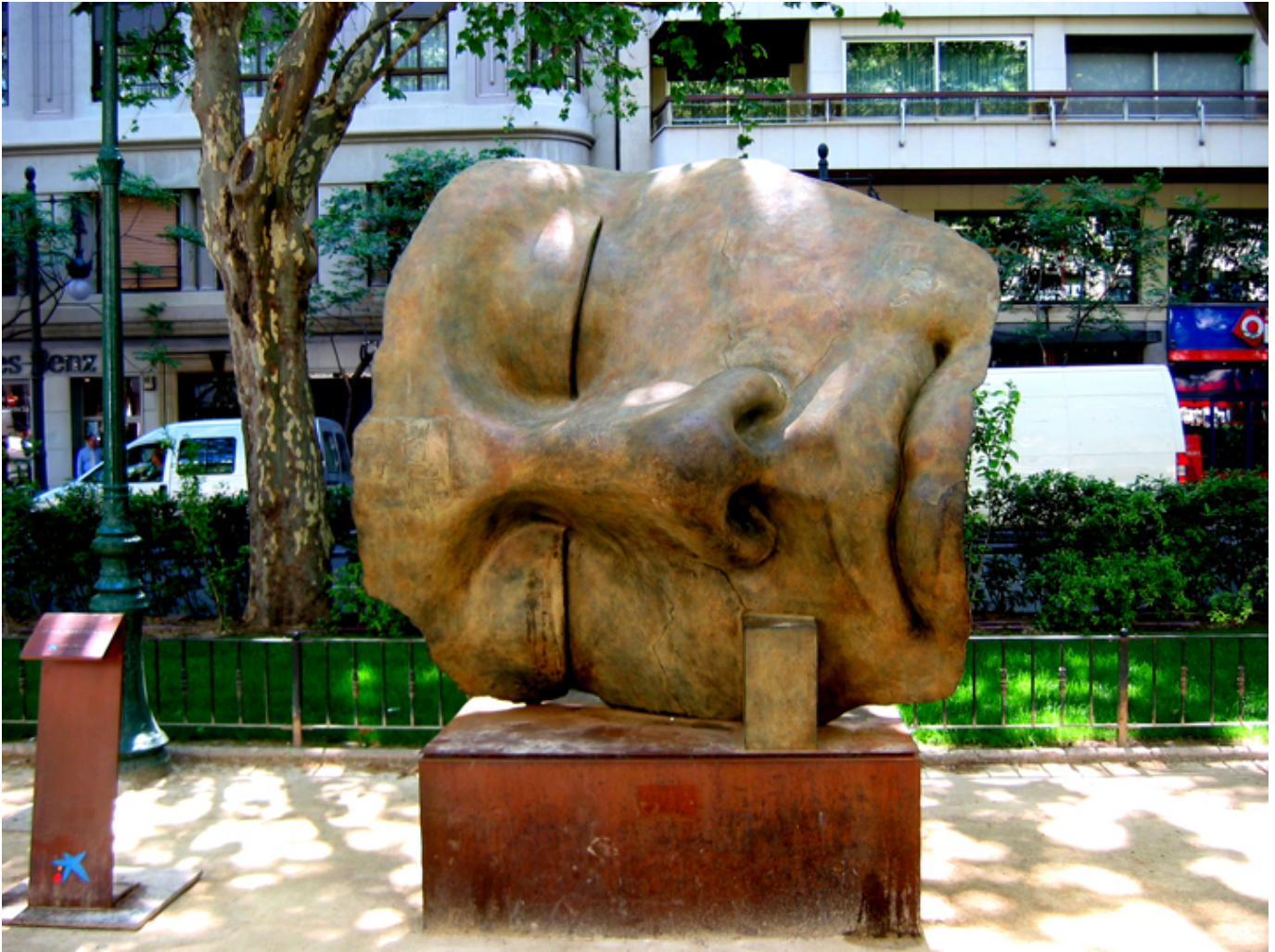
Rzeźba Igora Mitoraja w Walencji, 2006 r, fot. Wikipedia.