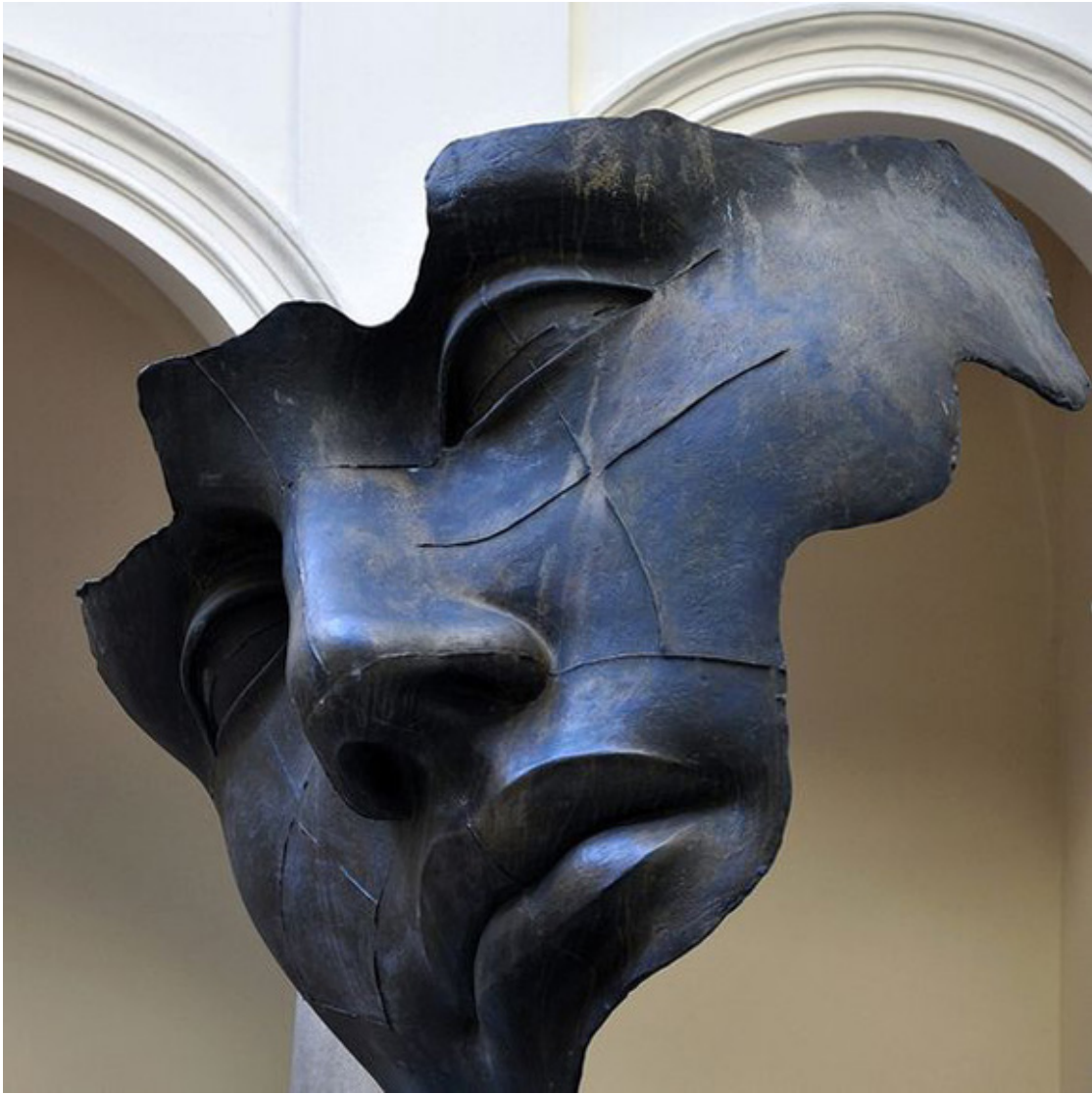
Igor Mitoraj, „Światło księżycyca” 1991 r, Uniwersytet Jagielloński w Krakowie, fot. Pinterest.