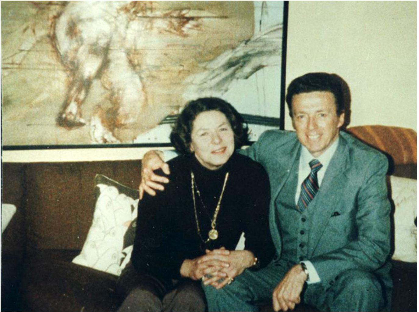
Ingrid Bergman i Norman Boehm, Londyn 1982 r., fot. arch. A.Z-B

W ciąg biograficzny wplecione są role filmowe i stopnie kariery. Czy Ingrid Bergman, tak jak publiczność, też uważała „Casablancę” za najważniejszy film z jej udziałem?