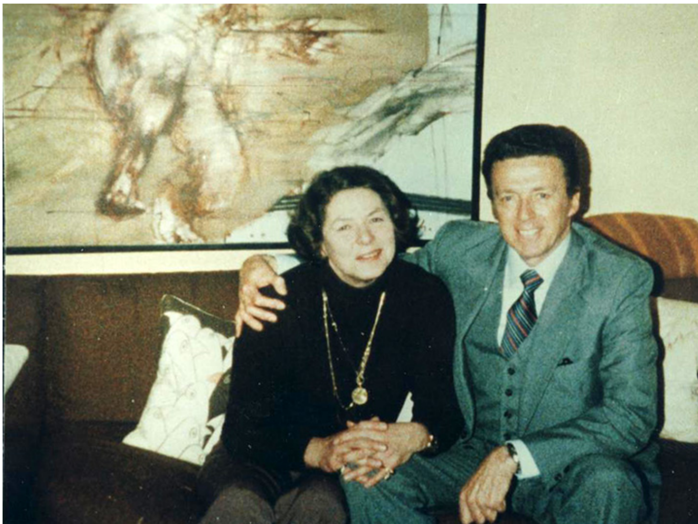
Ingrid Bergman i Norman Boehm, Londyn 1982 r.

W ciąg biograficzny wplecione są role filmowe i stopnie kariery. Czy Ingrid Bergman, tak jak publiczność, też uważała „Casablancę” za najważniejszy film z jej udziałem?