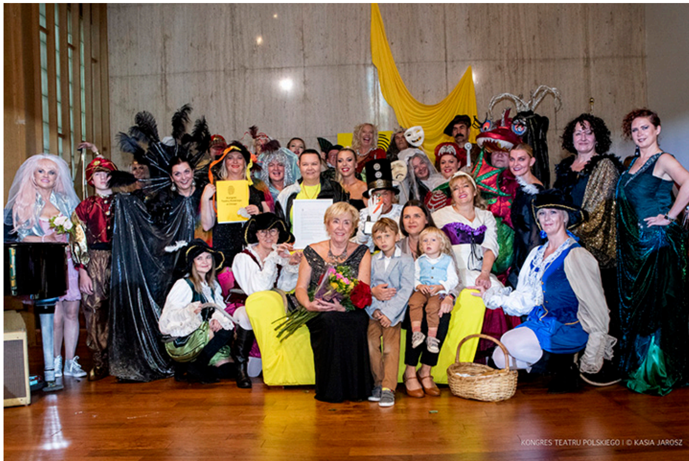
IV Kongres Teatru Polskiego