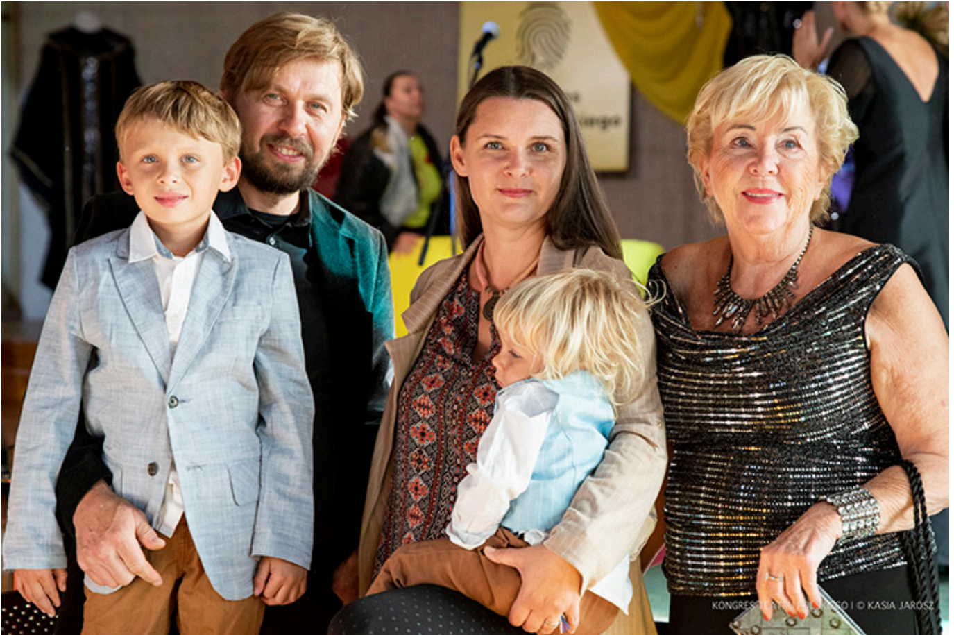
IV Kongres Teatru Polskiego