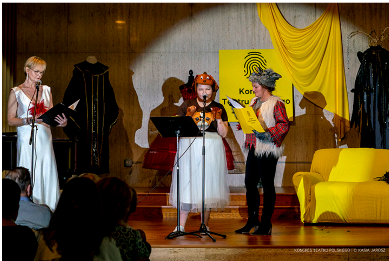
IV Kongres Teatru Polskiego