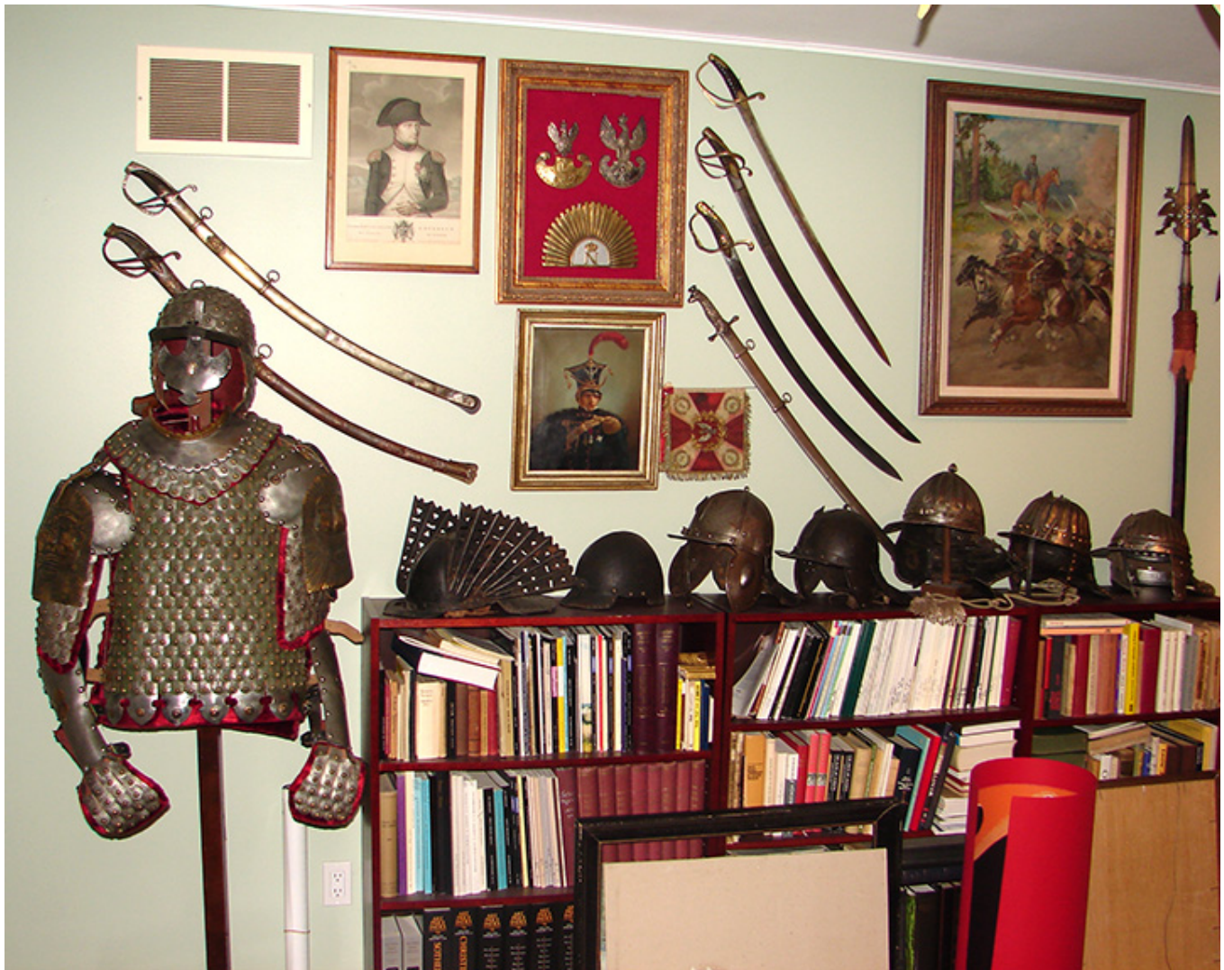
Kolekcja białej broni H. T. Kwiatkowskich, fot. Józef Kołodziej

Podczas pobytu w Ameryce, statek na którym aktualnie pływał w Polsce, został skierowany do okresowego remontu. W jego kabinie znaleziono materiały świadczące o działalności w opozycyjnych strukturach podziemnych o czym informuje go przyjaciel. Droga powrotu do Polski stoi przed Tadeuszem praktycznie zamknięta. Nie może się z tym pogodzić, ale zdaje sobie sprawę z tego, co go czeka w Polsce. Z wielkim żalem podejmuje więc trudną decyzję pozostania w Ameryce, gdzie otrzymuje azyl polityczny. Na pobyt tutaj jest jednak całkowicie