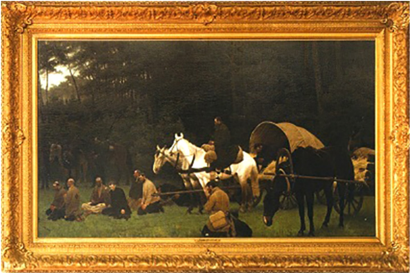
Artur Nikutowski, Zsyłka na Sybir, fot. Bart Sadowski

Przykładem tego niech będzie obraz - „Zsyłka na Sybir”, który namalował Artur Nikutowski. Tadeusz, będąc jeszcze studentem w Polsce, widział ten obraz w katalogu, wystawiony na sprzedaż w Niemczech za sumę $20,000.00. Wówczas dla niego była to suma tak niewyobrażalnie duża, że nawet nie marzył o jego kupnie kiedykolwiek. Prawie 25 lat później, obraz ten był powtórnie wystawiony na sprzedaż - też w Niemczech. Mąż natychmiast poleciał do Niemiec i kupił go za sumę niewiele wyższą. Transakcja ta ucieszyła go szczególnie.