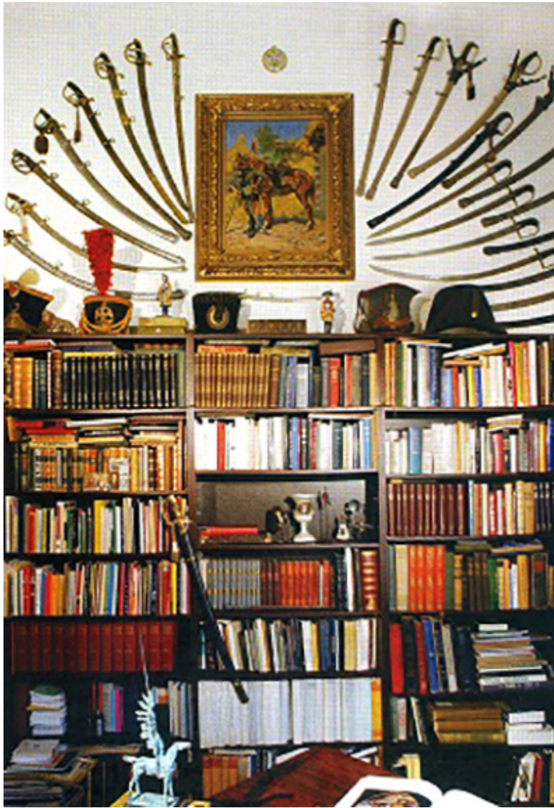
Biblioteczka i zbiory białej broni