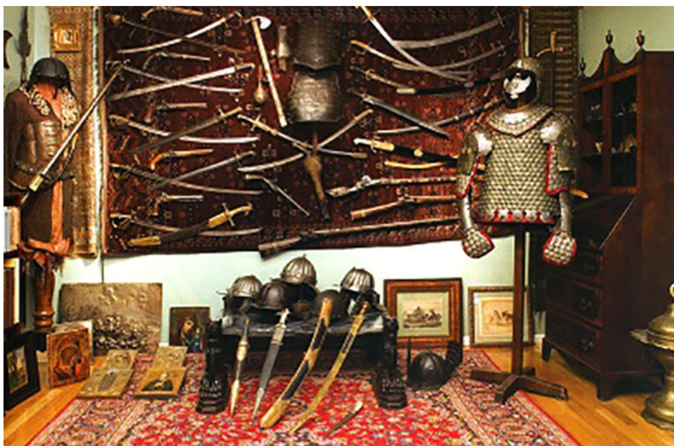
Zbrojownia. Tu zostały wyeksponowane zbiory broni białej, palnej, zbroi i kolekcja ikon, fot. Bart Sadowski

Opowieść o niezwykłej kolekcji polskiego malarstwa i poloników Heleny i Tadeusza Kwiatkowskich we Freehold, New Jersey, USA.