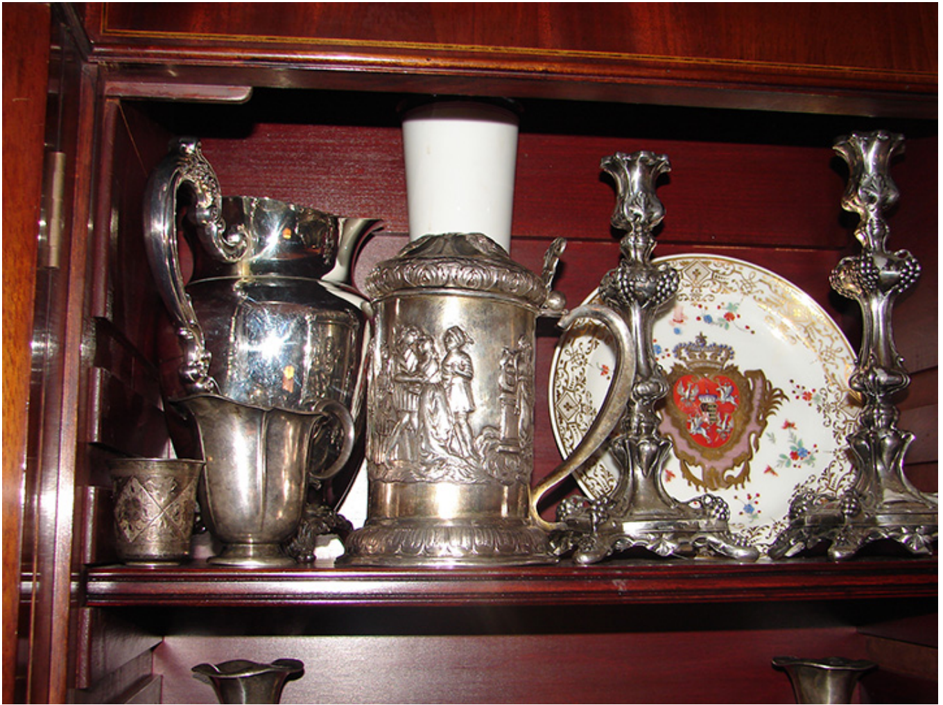
Kolekcja H. T. Kwiatkowskich, fot. Józef Kołodziej