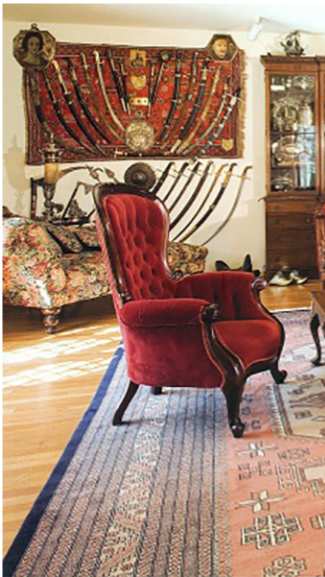
Fragment kolekcji białej broni w saloniku