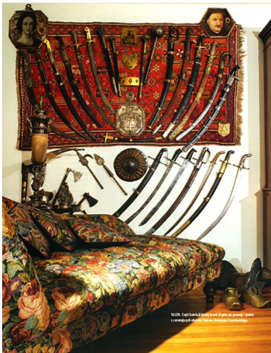
Część kolekcji białej broni. U góry, po prawej stronie - buława hetmana Czarnieckiego