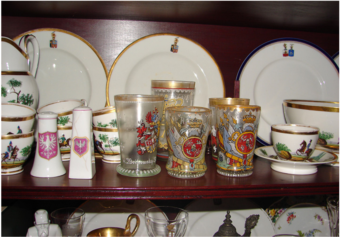
Kolekcja H. T. Kwiatkowskich, fot. Józef Kołodziej