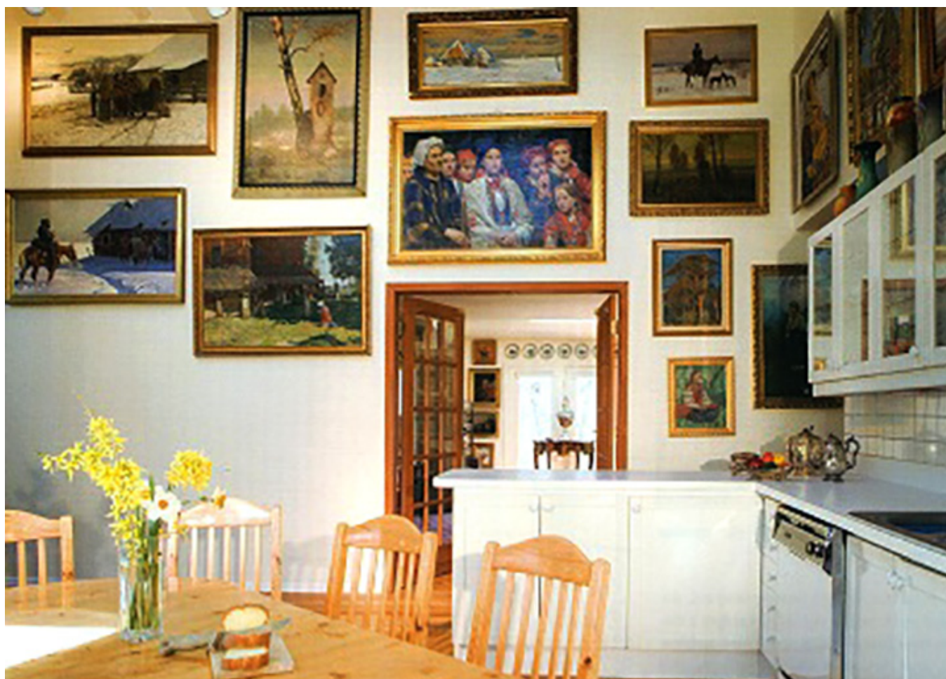
Jasna i wysoka kuchnia gromadzi malarstwo okresu Młodej Polski. Ta część kolekcji, odmienna od reszty zbiorów, wnosi do domu spokój i melancholię

Kolekcja obejmuje ponad trzysta obrazów więc niesposób wymienić nazwiska wszystkich malarzy. Wśród nich przez te paręnaście lat zgromadziliśmy obrazy takich polskich mistrzów jak: Juliusz, Wojciech i Jerzy Kossakowie, Artur Grottger, Józef Brandt, Bohdan Kleczyński, Michał Wywiórski, Alfred Wierusz-Kowalski, Włodzimierz Tetmajer, Leon Wyczółkowski, Jan Rosen, January Suchodolski, Julian Fałat, Józef Chełmoński i wielu, wielu innych.