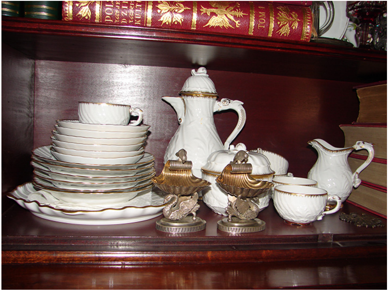
Kolekcja H. T. Kwiatkowskich, fot. Józef Kołodziej