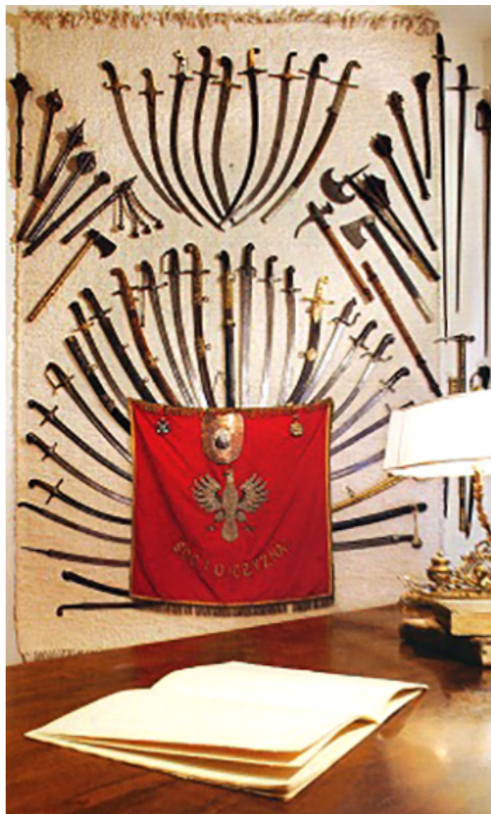
Gabinet, broń biała polska i turecka, proporzec patriotyczny z przełomu XIX i XX wieku, na nim ryngraf konfederacji barskiej -noszony na piersiach przez konfederatów, fot. Bart Sadowski

Domyślam się, że wiele szabel ma swoją historię, a inne zapewne dopiero czekają na ich odkrycie?