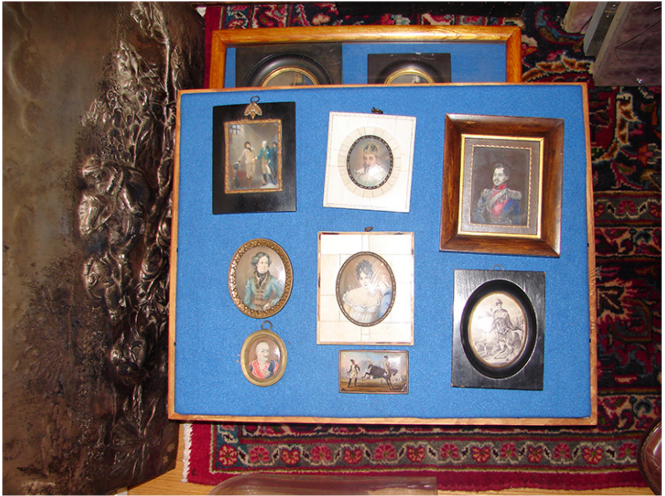
Kolekcja H. T. Kwiatkowskich, fot. Józef Kołodziej