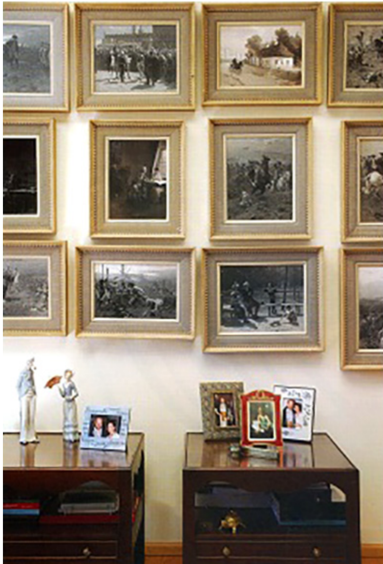
Zygmunt Ajdukiewicz, Sceny z życia Tadeusza Kościuszki