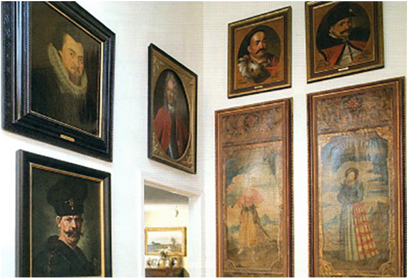
Z prawej strony wiszą dwa kurdybany z początku XVIII w. – portrety malowane na skórze ze złożonym ornamentem. W renesansie kurdybanów używano do obijania ścian i mebli, fot. Bart Sadowski