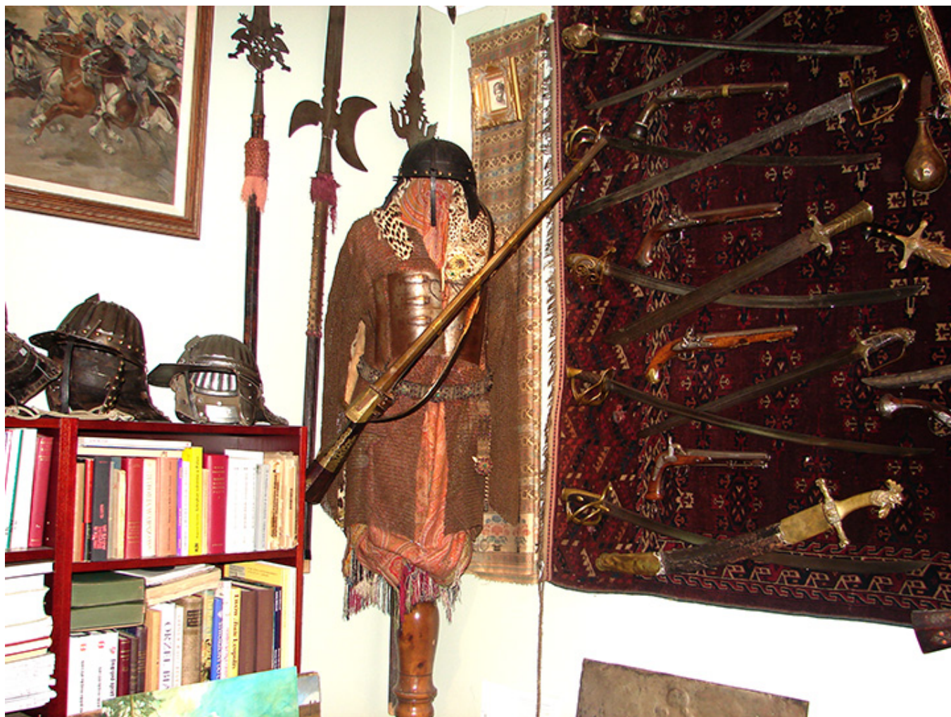
Kolekcja białej broni H. T. Kwiatkowskich

1975 roku w wakacje, na zaproszenie rodziny przyjeżdża do Ameryki na dwa tygodnie. Nie ma zamiaru przedłużyć pobytu, gdyż w Polsce czeka na niego narzeczona z którą mają się pobrać zaraz po jego powrocie. Los zrządził inaczej.