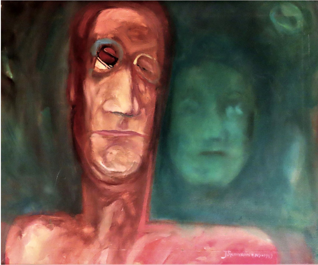
Janusz Skowron, PROPHETIC DREAM DESPERATION, oil, 1997