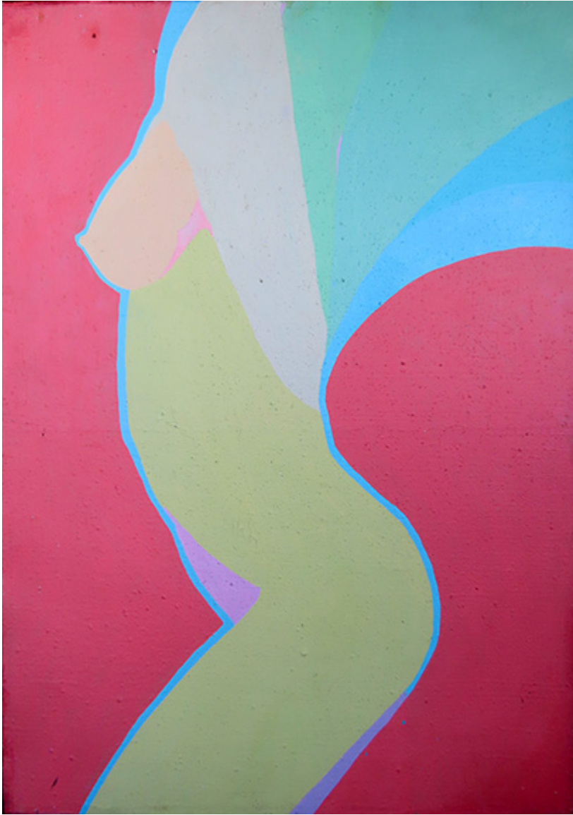
Janusz Skowron, ROLLER SKATES, oil, 1988