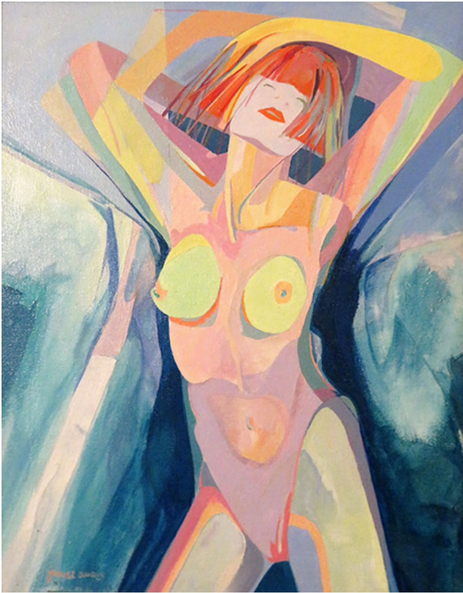
Janusz Skowron, WOMAN TAKING SHOWER, acrylic, oil, 1993