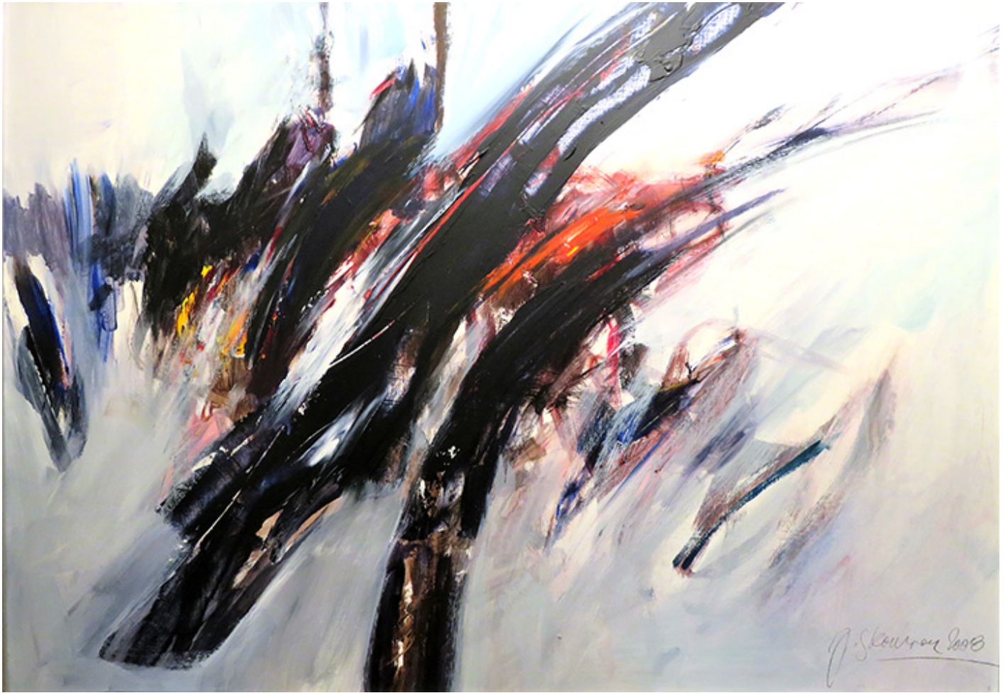
Janusz Skowron, COMPOSITION, acrylic, 2008