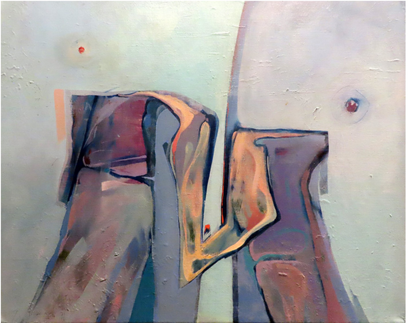
Janusz Skowron, COMPOSITION, oil, 1991