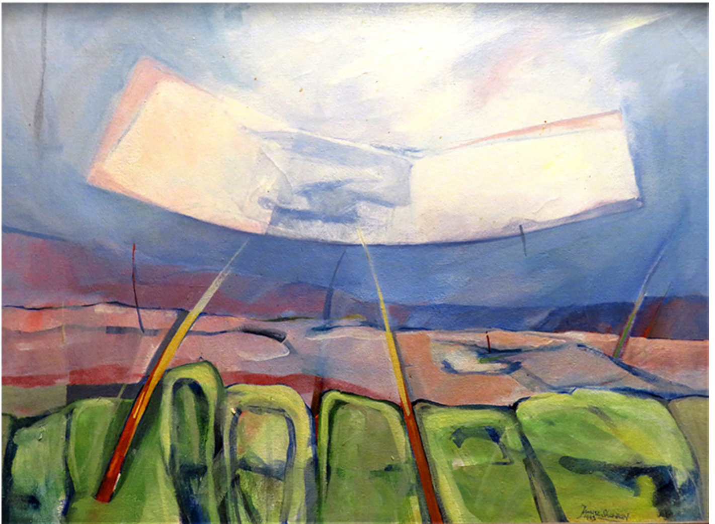
Janusz Skowron, FOREST PARK, acrylic, oil, 1993