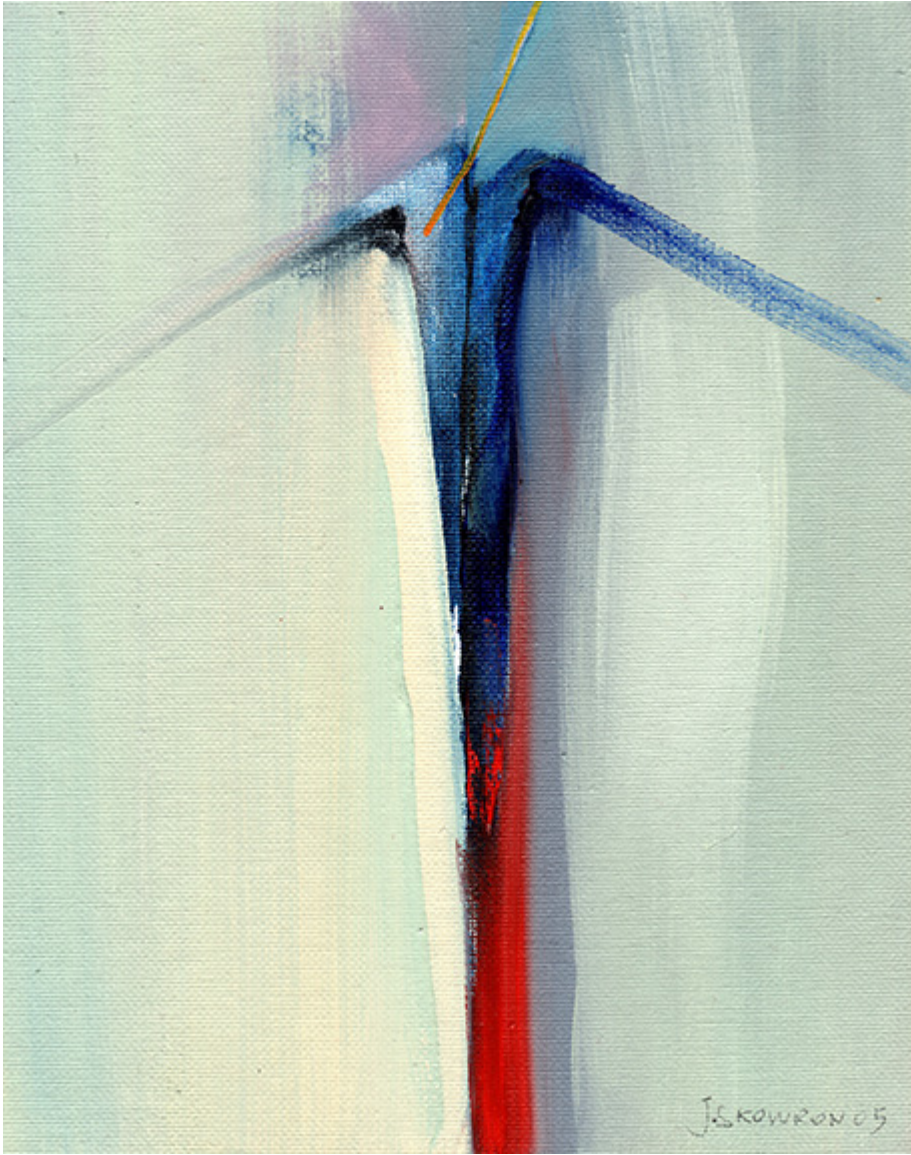
Janusz Skowron, ASCENSION INTO HAEVEN, oil, 2005