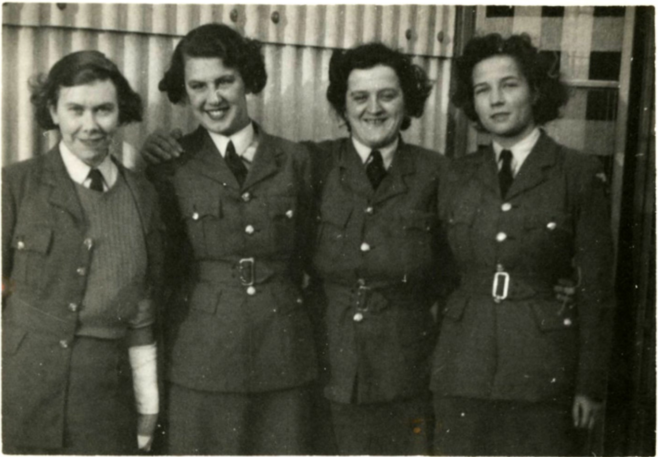
Christine Brooke-Rose (pierwsza z prawej) w mundurze WAAF, zanim poszła do Bletchley Park.