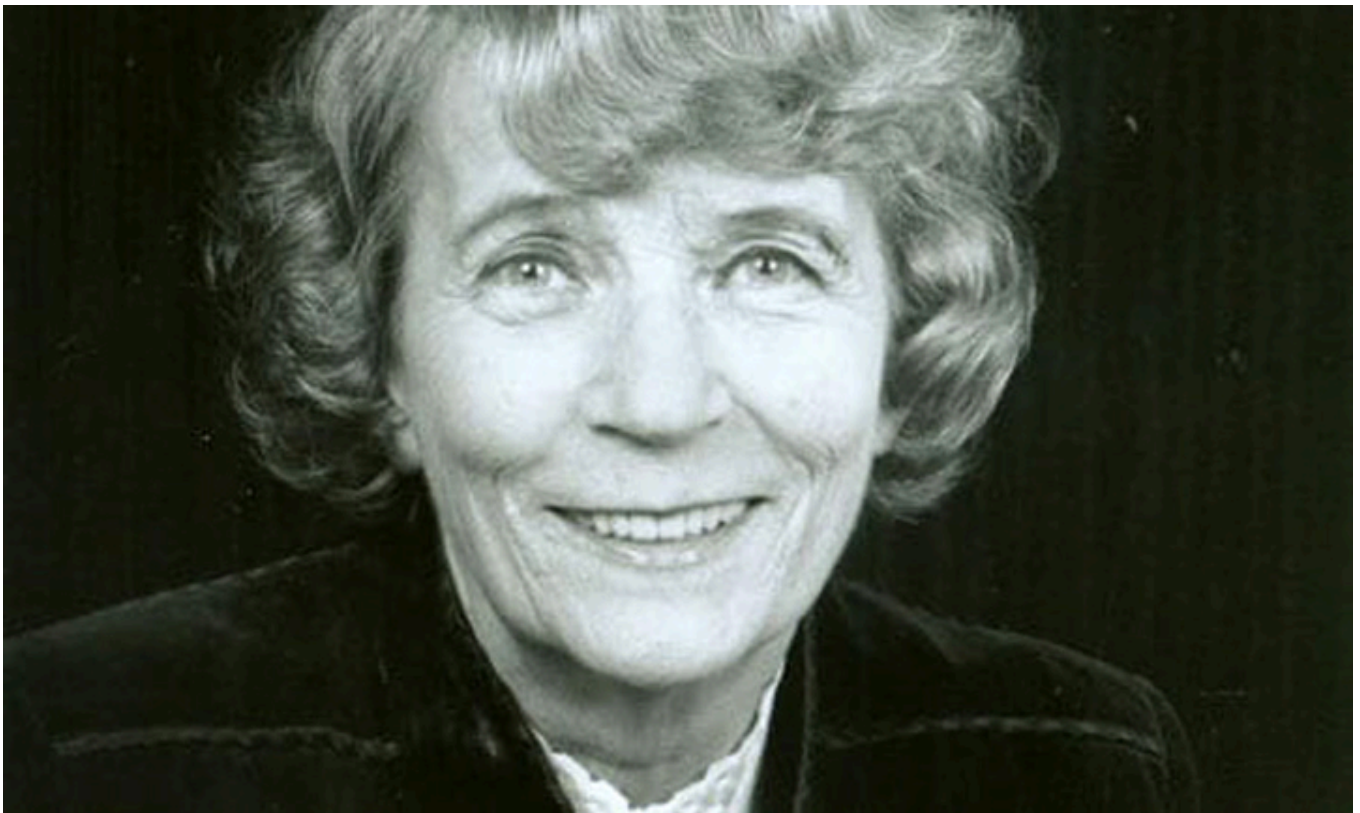
Christine Brooke-Rose