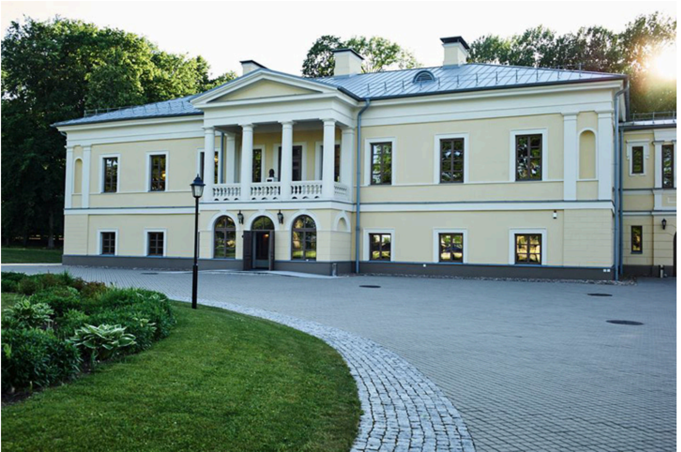
Pałac Balińskich w Jaszunach.