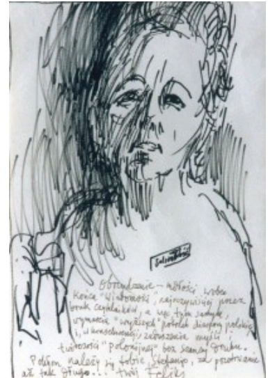
Stefania Kossowska na rysunku Feliksa Topolskiego

Współpracowałem z Kossowską dorywczo jeszcze w „Wiadomościach”, a później, częściej, w „Środku Literackiej”, miesięcznym dodatku do londyńskiego „Dziennika Polskiego”. Była to współpraca przyjemna, dająca wielką satysfakcję, gdyż Kossowska potrafiła do końca pisać listy i notatki do swoich współpracowników i pięknie teksty dobierać, składać i przyozdabiać ilustracjami.