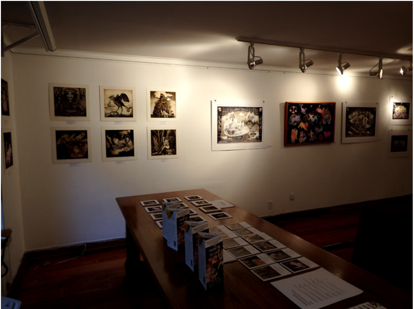
Fotografie sali: Kamila Wojciechowicz

Kamila Wojciechowicz podczas malowania muralu dla NY Moore hostel na Brooklynie