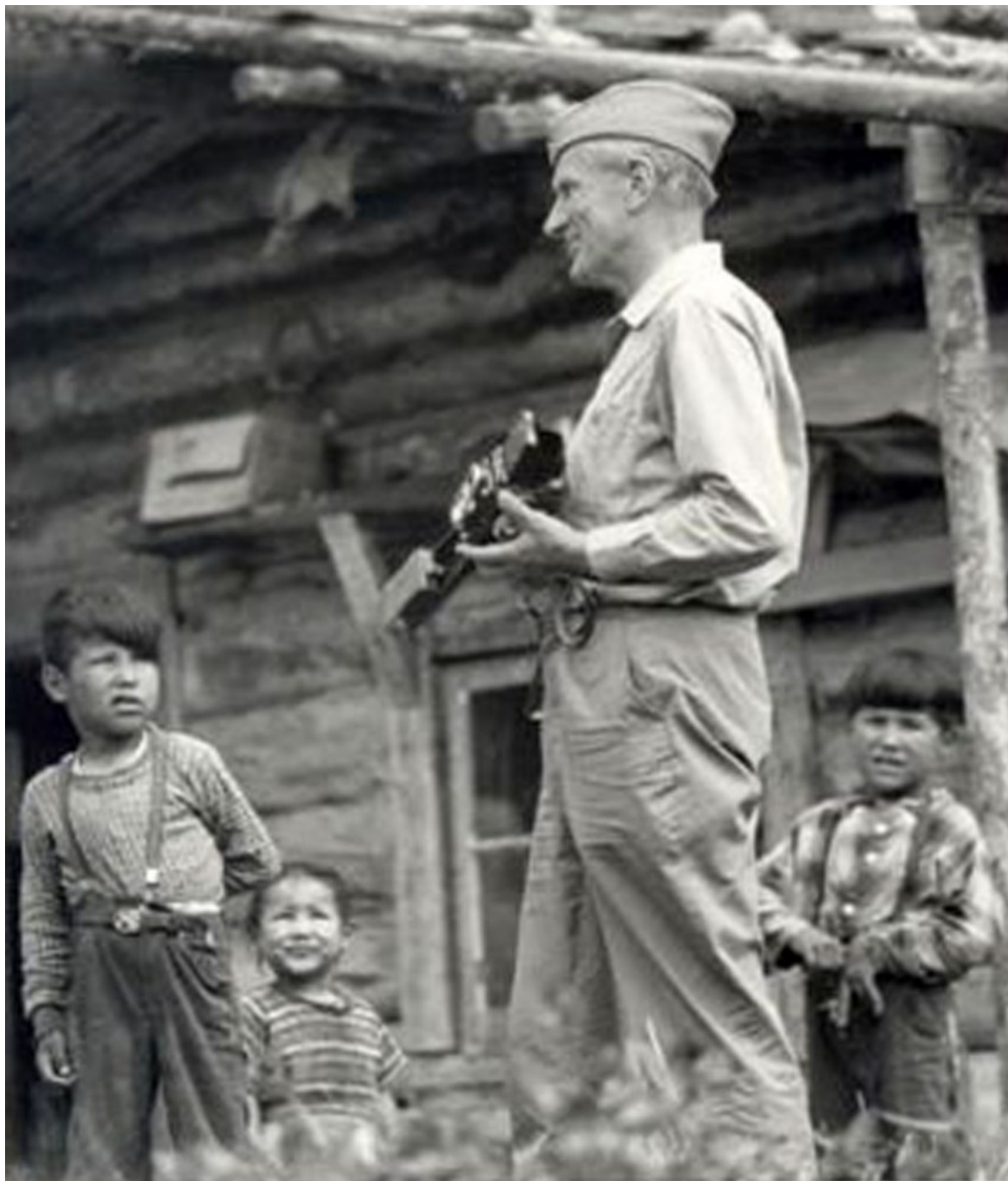
Arkady Fiedler w Kanadzie