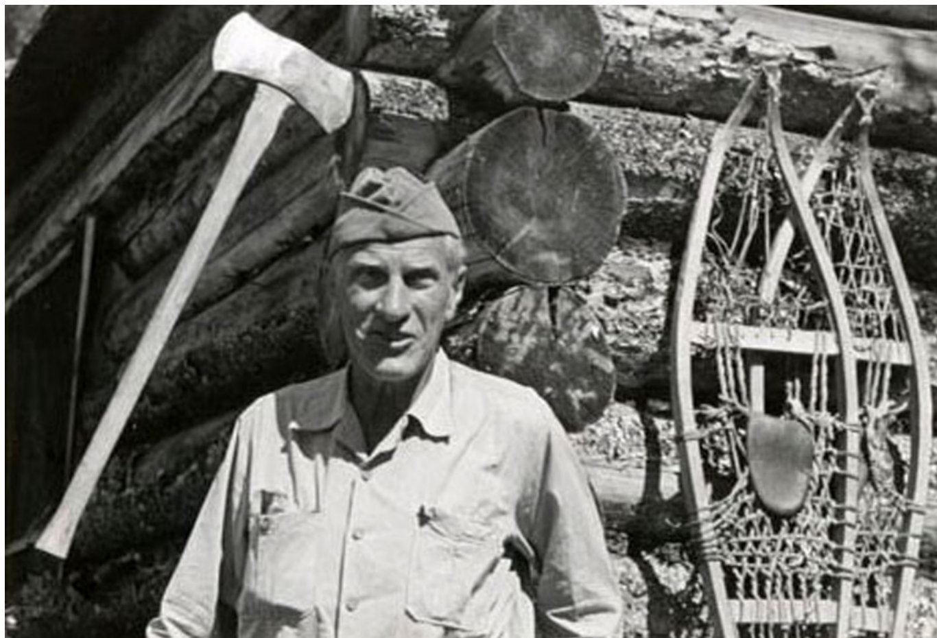
Arkady Fiedler w Kanadzie