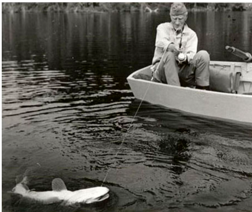
Arkady Fiedler w Kanadzie

traperskie warunki, jak na wiek ojca. Ale dla niego był to powrót do wspomnień. Bohaterowie książki już nie żyli, minęły przecież lata, ale miejsce wiele się nie zmieniło. W jakimś momencie nasi Indianie dostali zapomogi i upili się. Cała wioska tonęła w oparach alkoholu. Schodziliśmy im z oczu, bo patrzyli na nas coraz bardziej hardo, byliśmy dla nich jakimiś Jankesami, czy nie wiadomo kim. Otoczyli nas, jakby chcieli zażądać, abyśmy się zaraz wynosili. Ojciec miał przy sobie egzemplarz „Kanady pachnącej żywicą”. Było to wprawdzie polskie wydanie, ale miało dużo fotografii. Pokazał im więc tę książkę, a oni wykrzyknęli - to Ty znałeś naszego wodza? On już nie żyje od 25 lat. A ojciec na to - no pewnie, polowałem z nim, lasy razem przemierzyliśmy. No i cała wioska zaczęła oglądać książkę, już byliśmy wspaniałymi przyjaciółmi, pękły wszelkie lody. I nikt nie chciał nas wyrzucić. Tak więc w trochę groteskowej sytuacji, książka nas uratowała.