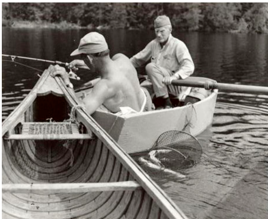
Arkady Fiedler w Kanadzie