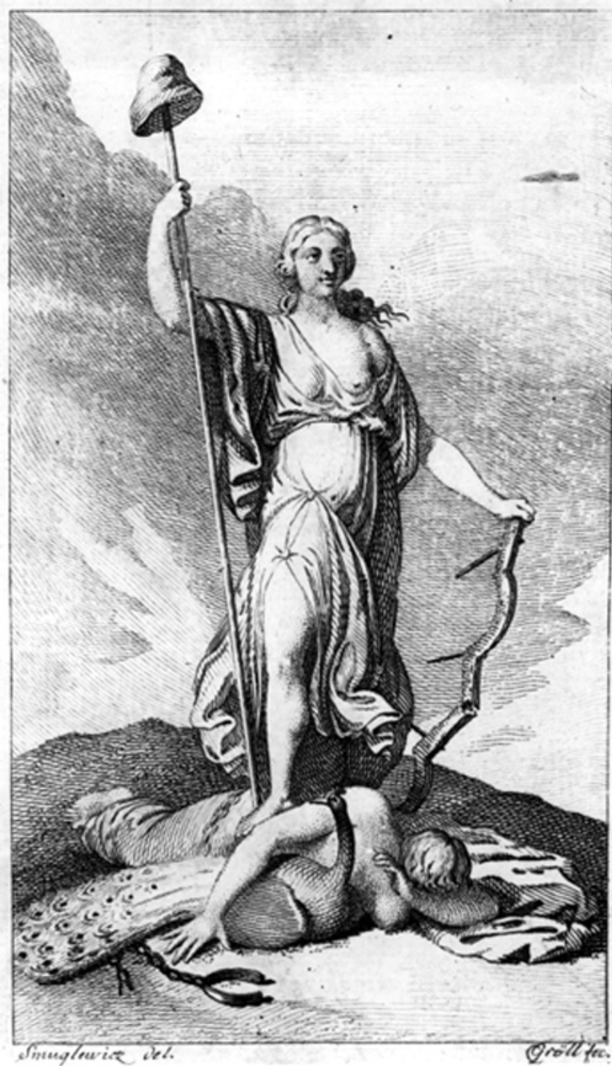
Alegoria Wolności, rycina Karola Michała Grölla wg wzoru Franciszka Smuglewicza, 1791; Biblioteka Narodowa.

Podobnie K. Groll ujął trzy lata później postać Napoleona przedstawiającego jeszcze