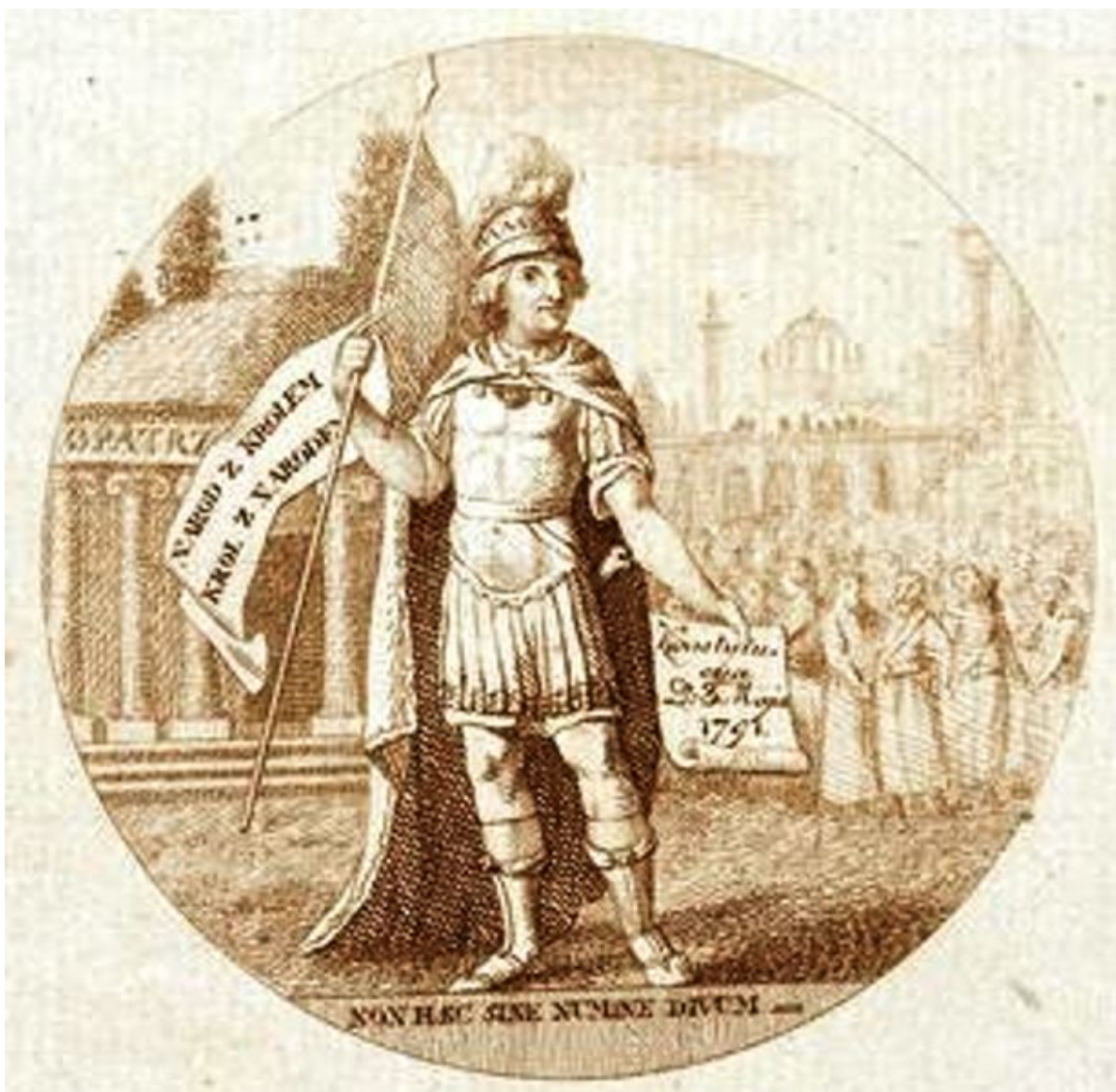
„Stanisław August z Kartą Konstytucji 3 maja” Karola Michała Grölla, odbitka graficzna z 1792 roku

Przyjęty 8 stycznia 1815 roku do Towarzystwa Warszawskiego Przyjaciół Nauk przez lata publikował artykuły ekonomiczne m. in. o angielskiej bankowości. W 1818 roku znowu wyjechał do Francji, Anglii i Holandii. Przyjaźnił się z Muzio di Clementi, Woelflem, panią Catalani i wieloma innymi. Kolejny pobyt w Londynie zaowocował budową fabryki produkującej narzędzia, które K. Groll sam ulepszał. Anglicy nazywali Go „polskim spekulantem” i bynajmniej słowo to miało inne znaczenie niż dzisiaj. Dla nas jest ważne, że przez całe życie czuł się Polakiem i do Polski wracał. W 1839 roku otrzymał od Rady Administracyjnej Królestwa Polskiego na lat 15 zgodę