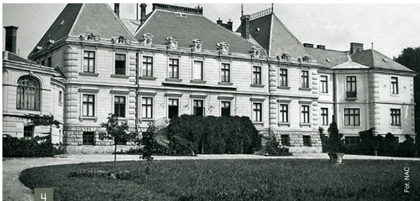
Pałac Lanckorońskich w Rozdole, okres międzywojenny