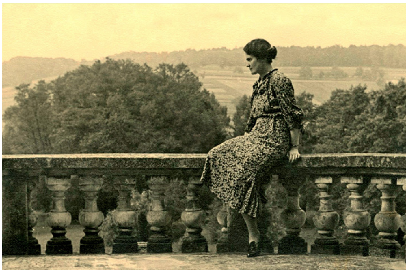
Karolina Lanckorońska na tarasie pałacu w Rozdole koło

rozmowa z Kazimierzem Braunem o słuchowisku radiowym zrealizowanym na podstawie kolejnej sztuki z serii: Wielkie Polki - emigrantki.