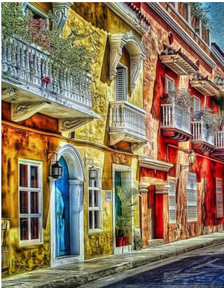
Hiszpania