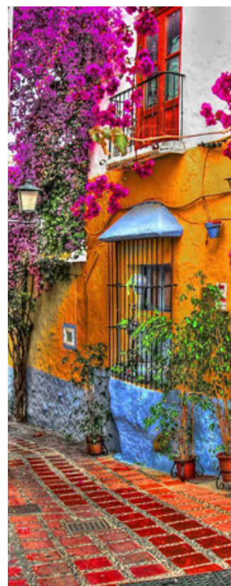
Hiszpania

nawet zaglądać do Radio Nacional , w którym miał swoje pogadanki skierowane do Polski. Któregoś nawet roku przespałem dziesięć nocy na podłodze w mieszkaniu jego przyjaciół pod nieobecność gospodarzy, w zamian za kilka garnców czerwonego wina. Łobodowskiemu lekarze dawali kiedyś pół roku życia, jeżeli nie przestanie pić. Poeta okazał się twardym pacjentem: operację przeżył, wina się nie wyrzekł, a pożył jeszcze dwadzieścia kilka lat.