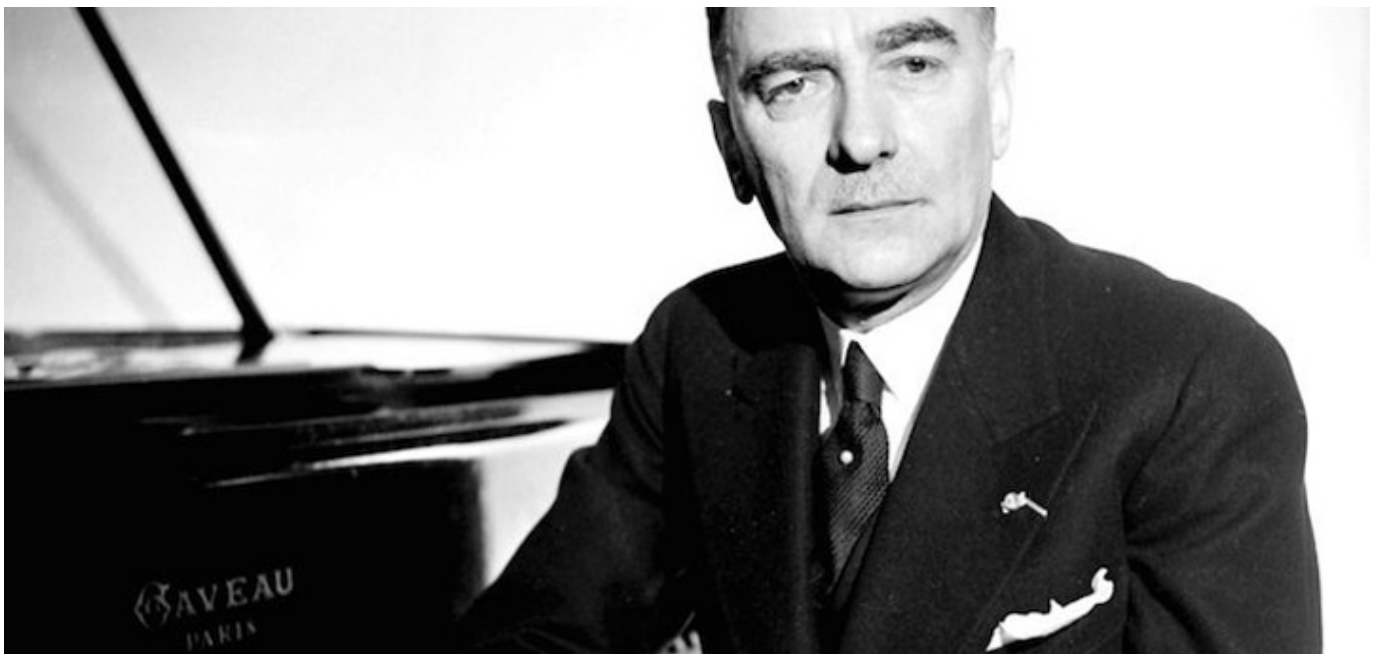
Karol Szymanowski

Ciekawe, że romantyczna idiosynkrazja do żony przeżyła romantyzm. Pierwszym nowoczesnym polskim poetą, który żonę uczynił swoją muzą był Gałczyński. Już za to jedno postawiłbym mu pomnik. Byłby to drugi pomnik postawiony na ziemi polskiej z tego powodu. Pierwszy miałby Kochanowski. Jakże on pięknie pisał o swej żonie Dorocie.