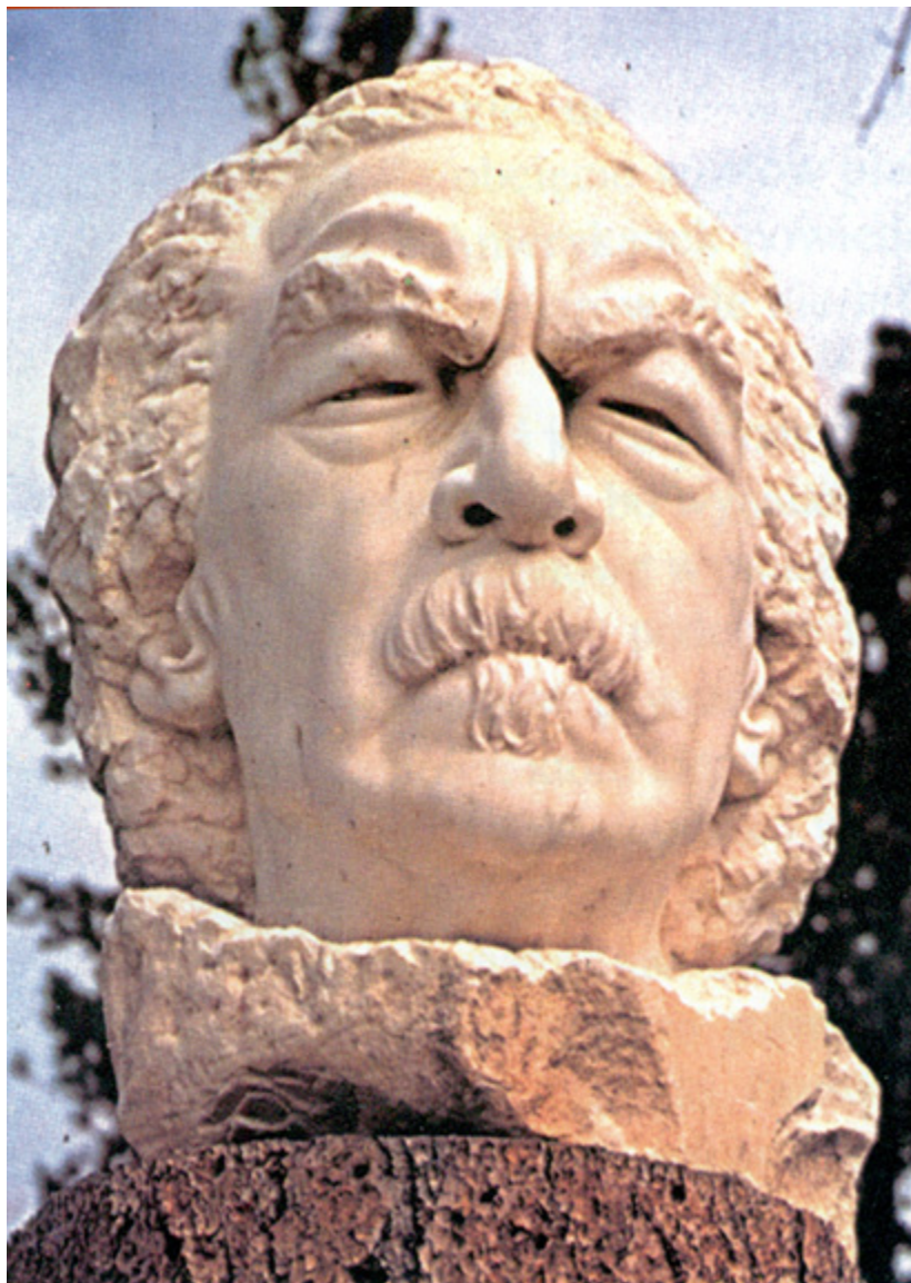
Wizyta w Crazy Horse Memorial, 1985 r., rzeźba Korczaka Ziółkowskiego przedstawiająca Ignacego Jana Paderewskiego, fot. arch. Aleksandry Ziółkowskiej-Boehm.

wódz Oglala Lakota: “My fellow chiefs and I would like the white man to know that the red man has great heroes, too”. ( Ja i moi przyjaciele wodzowie chcielibyśmy, aby biały człowiek wiedział, że czerwonoskórzy mają również wielkich bohaterów ).