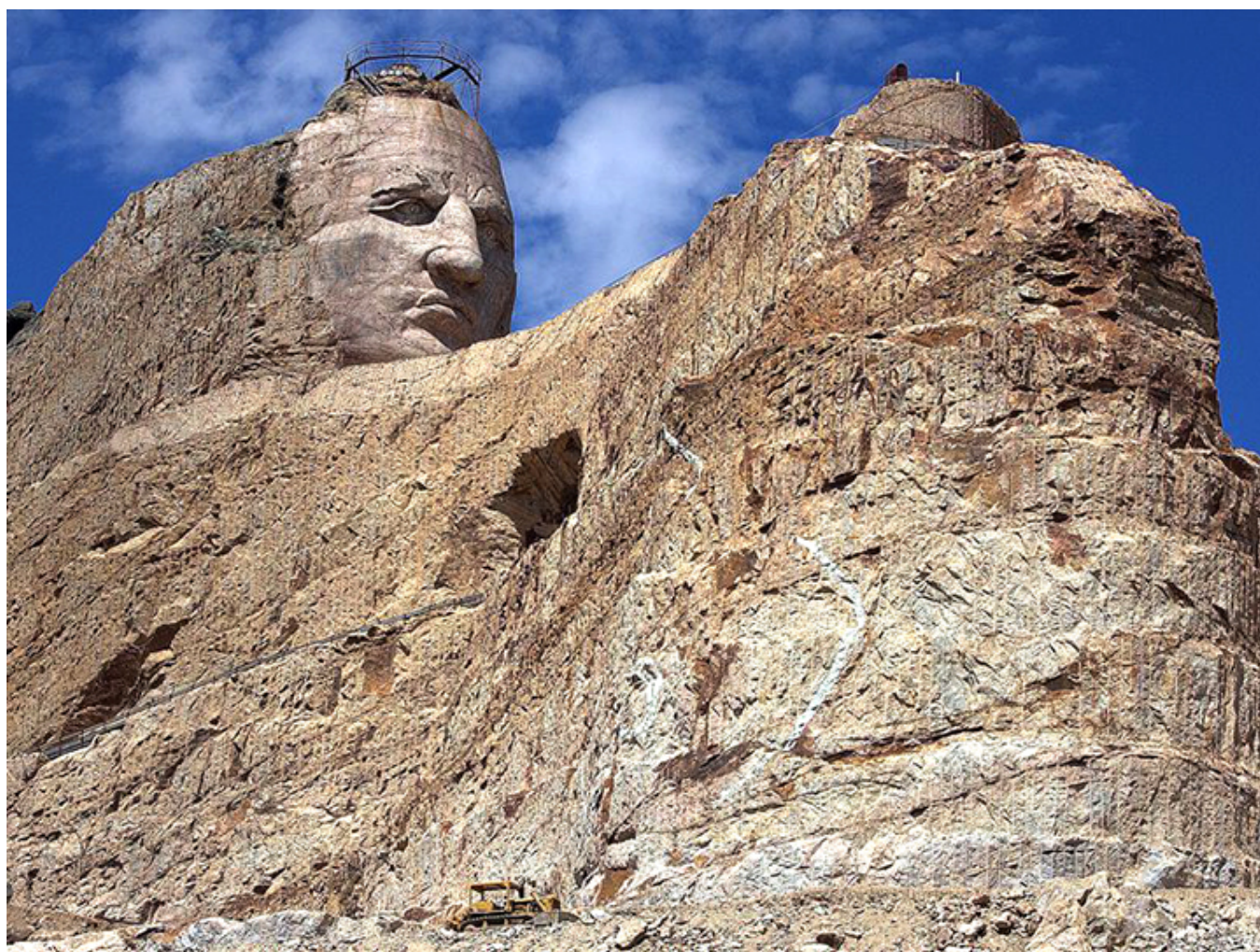
Crazy Horse, Południowa Dakota, fot. flickr.

Do Muzeum Crazy Horse ofiarowaliśmy z Normanem „tomahawk” i „arrowheads” zaznaczając w jakich okolicznościach trafiły do rodziny Normana. [3]