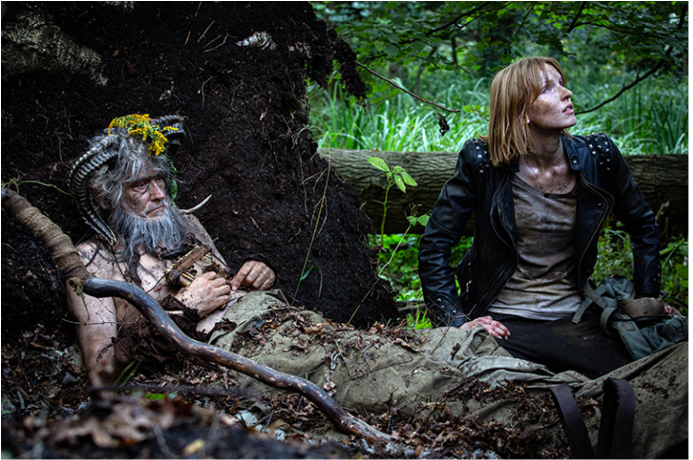
Fot., materiały prasowe