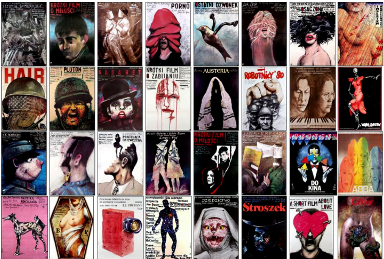
Plakaty filmowe Andrzeja Pągowskiego