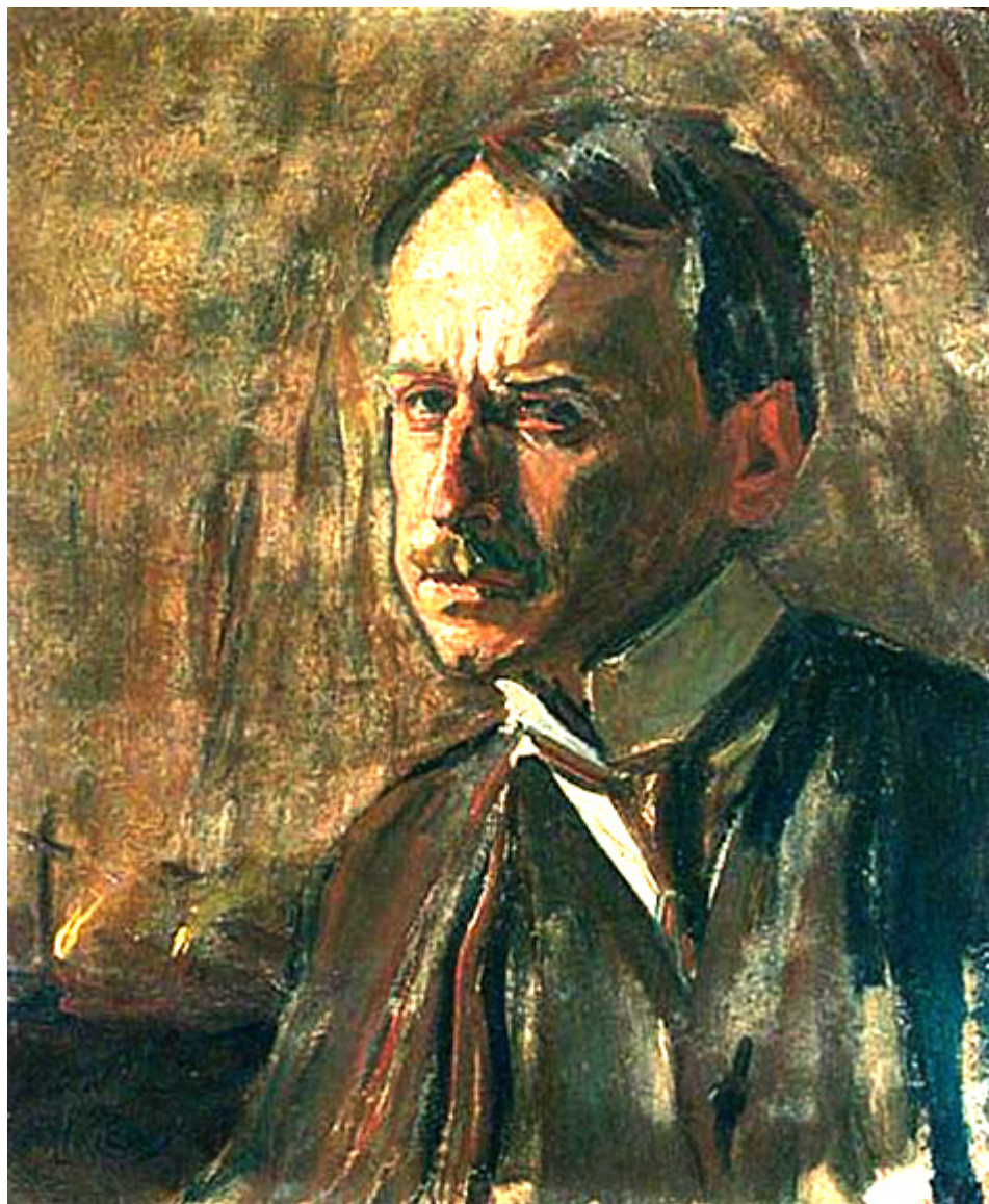
Ludwik Misky, autoportret, ok. 1920 r.