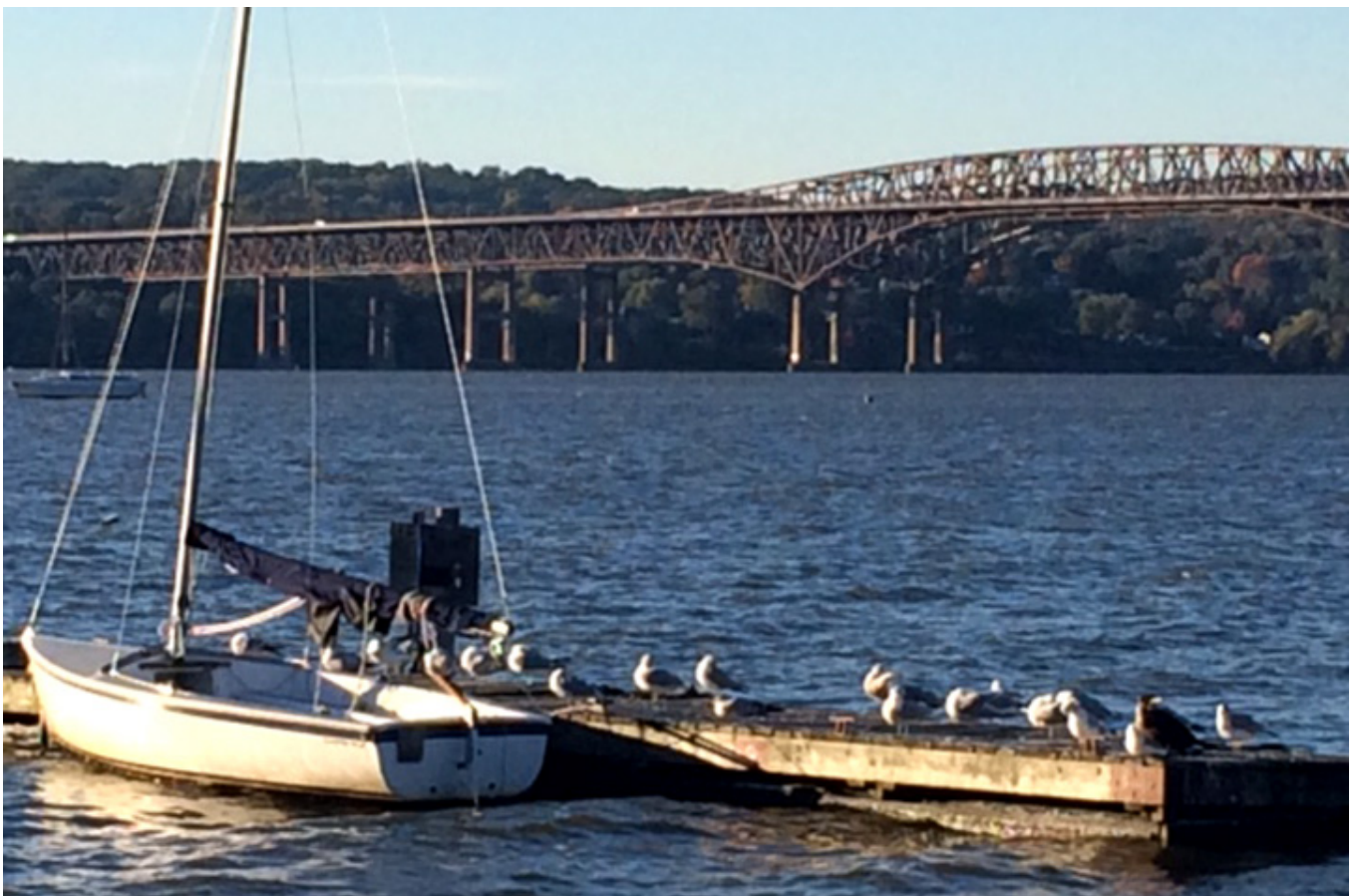
Widok z okna Czerwonej Stodoły.