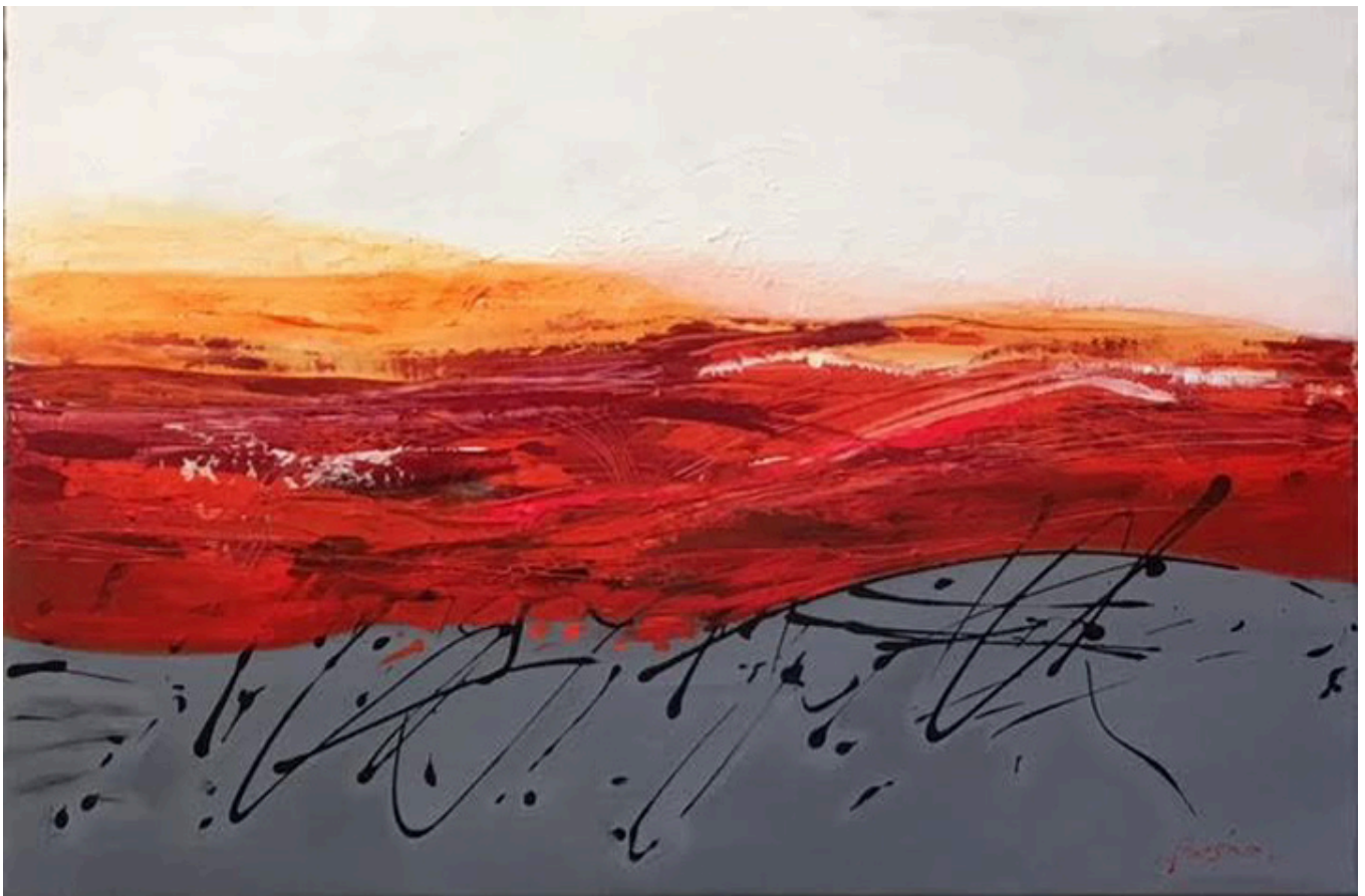
The red battle, acrylic on linen, 30×40 inches.