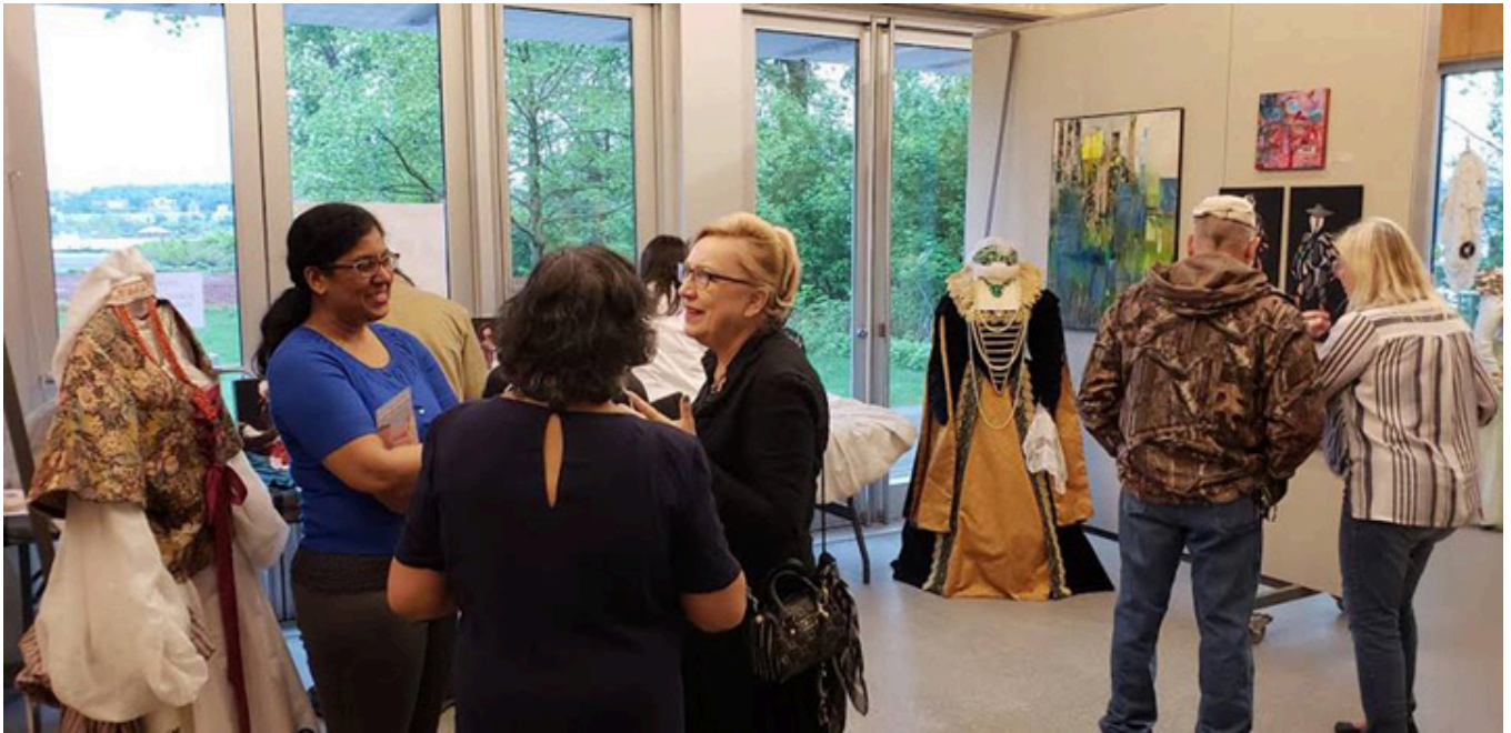
Kostium szekspirowski autorstwa Ewy Lachur.