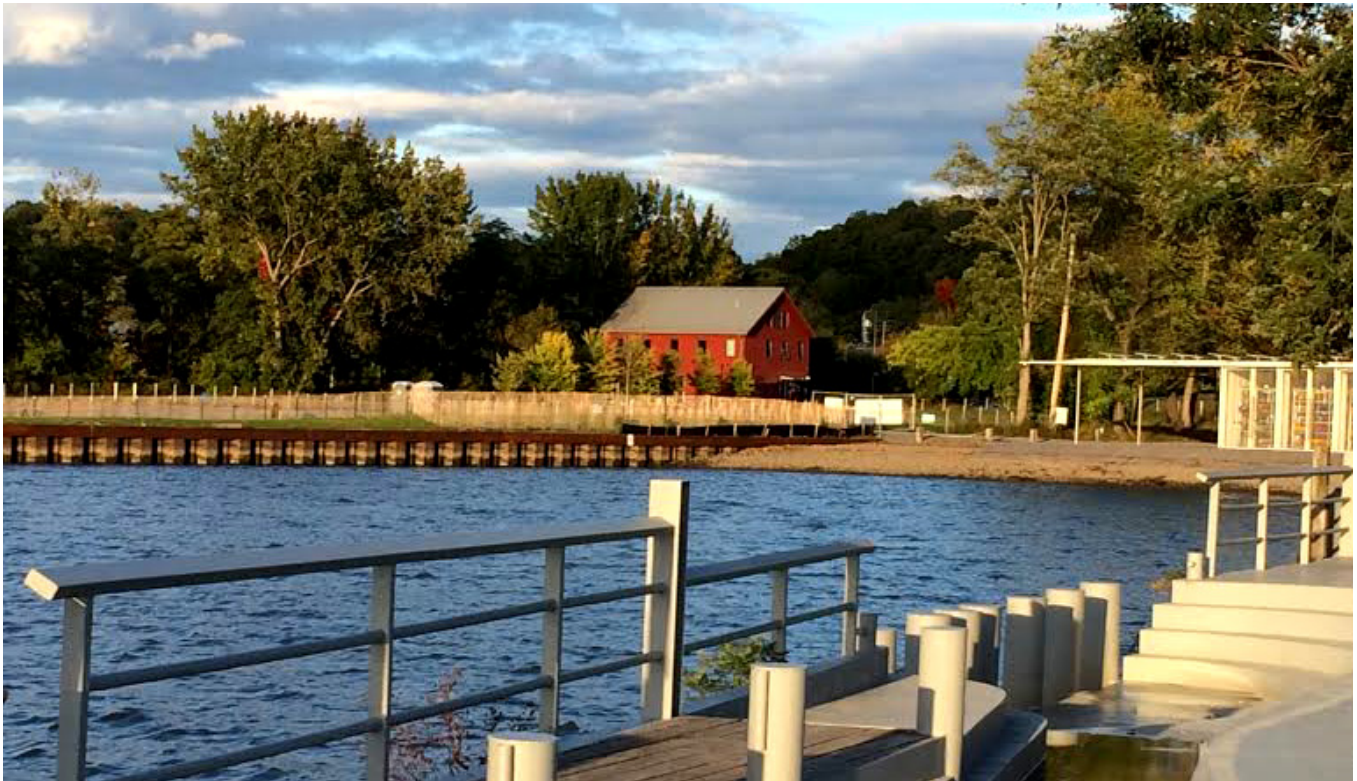
Beacon, New York, Czerwona Stodoła - Siedziba International Artists Residencies.