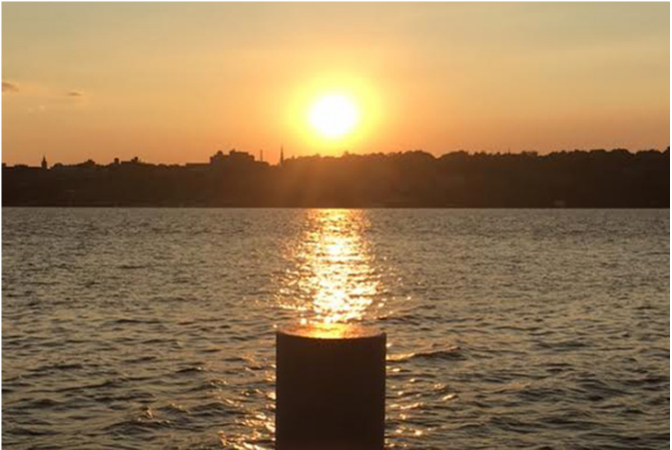
Zachód słońca na rzece Hudson widziany z okna Czerwonej Stodoły, która jest galerią i pracownią artystów w trakcie plenerów.