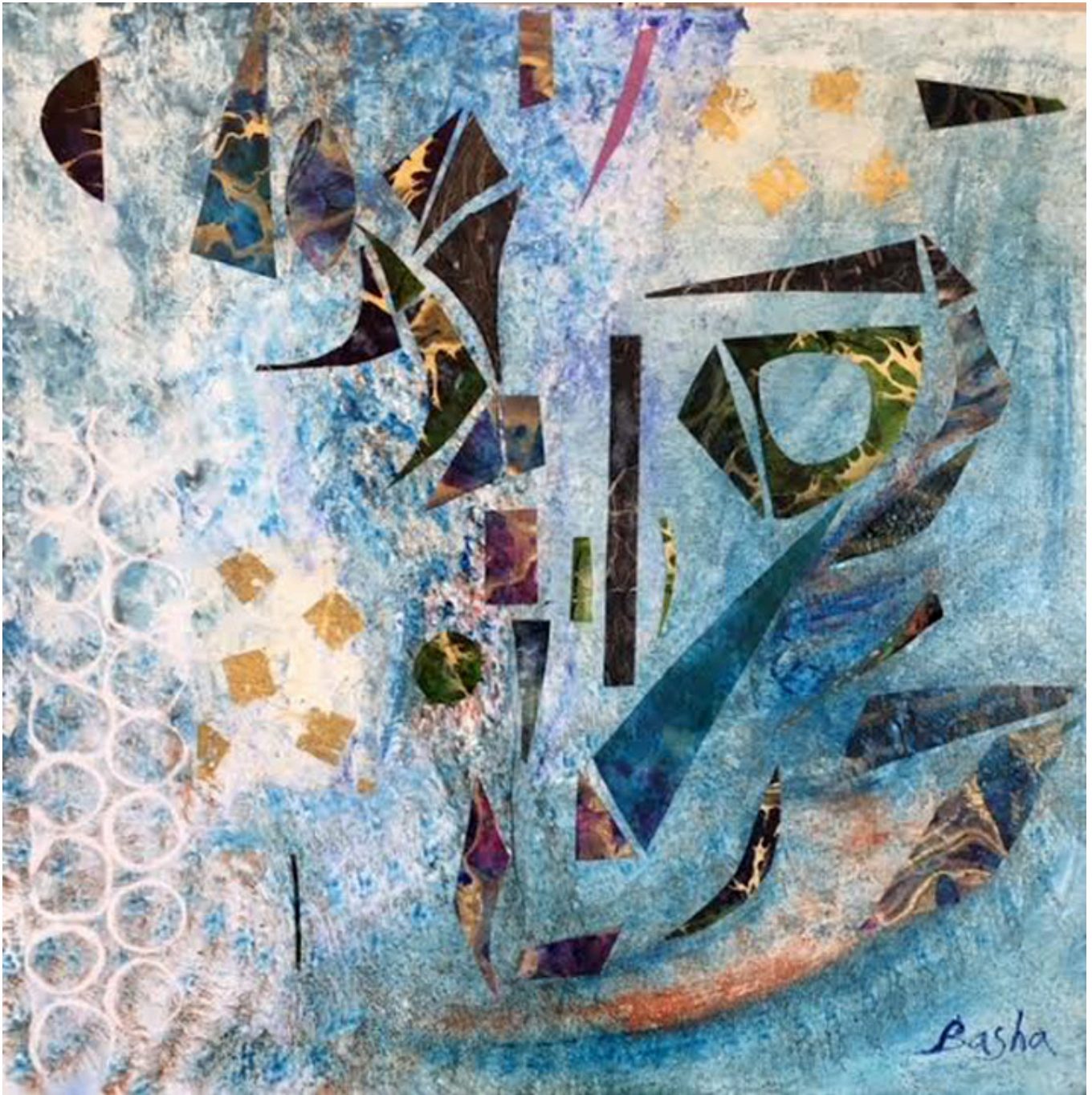
Not everything is gold that glitters, mixedMMedia on linen.