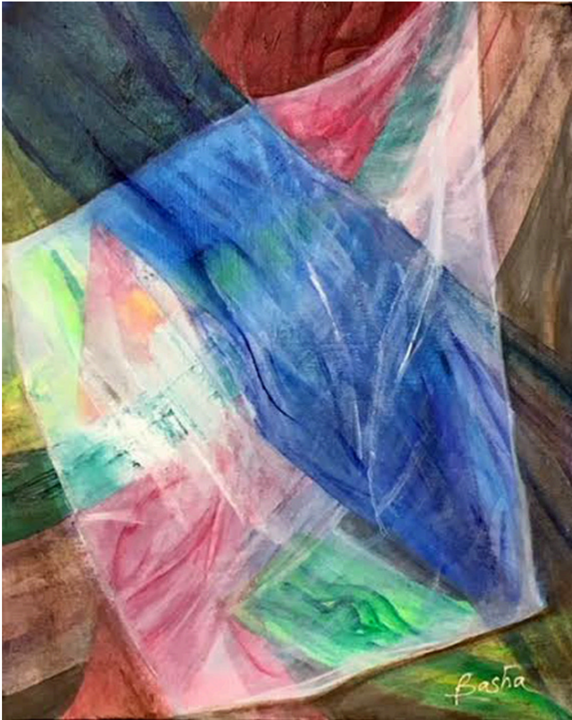
Transparency, acrylic on canvas, 28×24 inches.