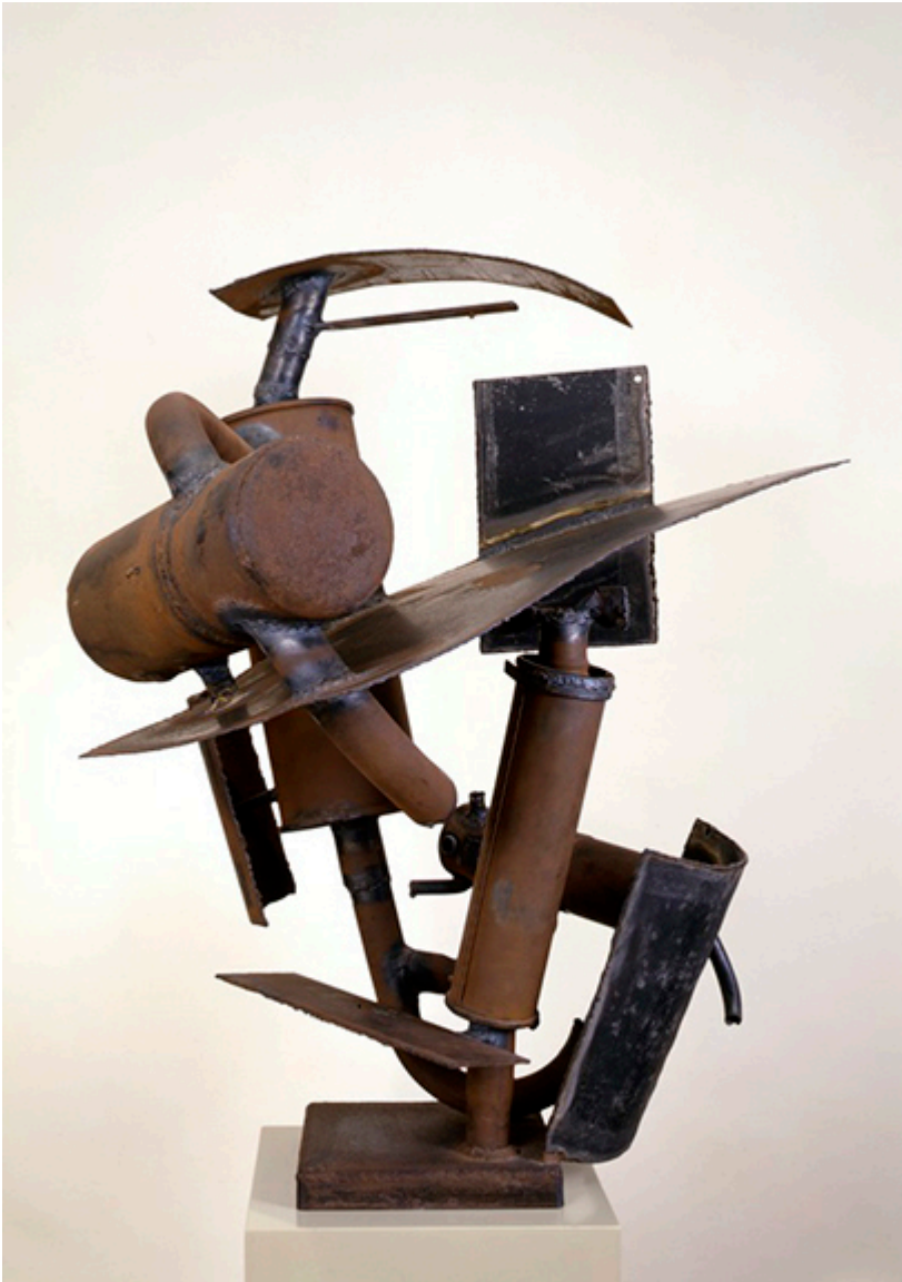
Richard Stankiewicz