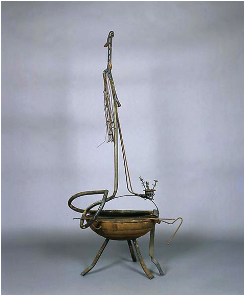
Richard Stankiewicz, Seated Lady , 1954 r., spawany metal, 49" x 23" x 17".

artystę nominacją do udziału w Biennale w Wenecji. Stankiewicz występował jako twórca reprezentujący Amerykę. Niedługo później, w 1959 roku zaproszony został przez Dorothy Miller, do udziału w organizowanej przez kuratorkę wystawie Sixteen Americans (Szesnastu Amerykanów) , odbywającej się w Museum of Modern Art. Oprócz Stankiewicza pokazano prace takich sław jak Jasper Johns, Ellsworth Kelly, Robert Rauschenberg, czy Frank Stella.