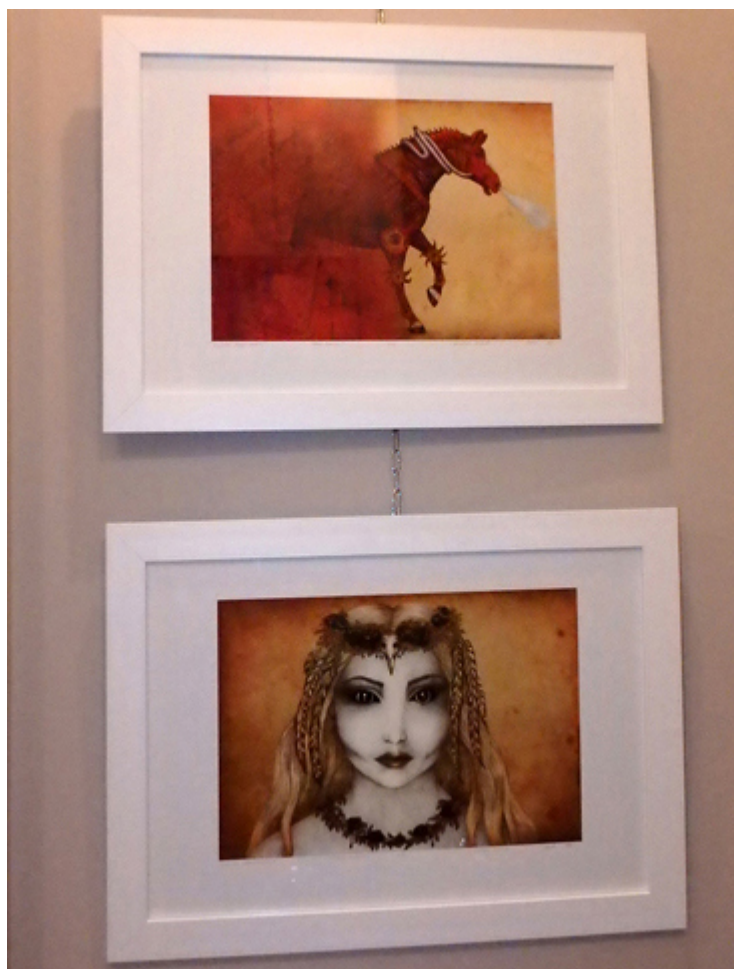
Prace Kamili Wojciechowicz, fot. Kacper Krauze.