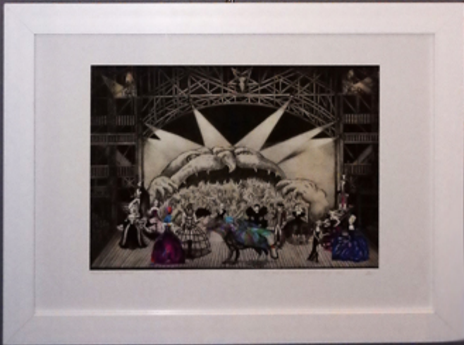
Prace Kamili Wojciechowicz, fot. Kacper Krauze.