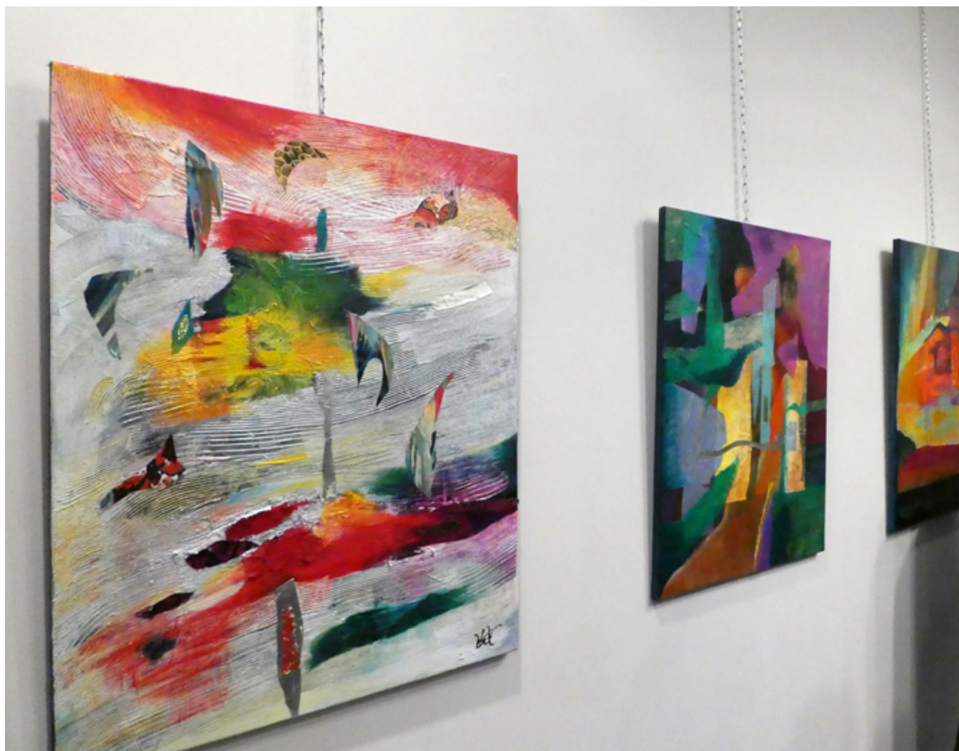
Malarstwo Kamili Wojciechowicz, fot. Sylwia Sokołowska.