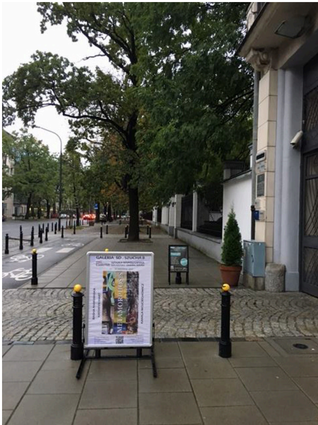
Przed Galerią SD Szucha 8, fot. Basha Maryanska.