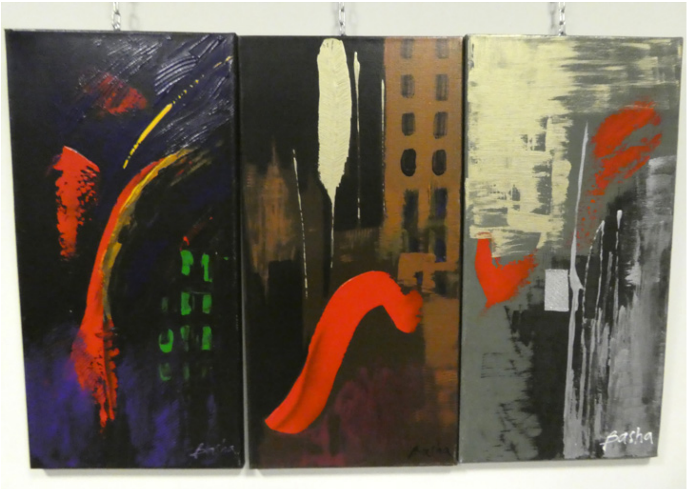
Echa Powstania Warszawskiego na Tryptyku Bashi Maryanskiej, fot. Sylwia Sokołowska.