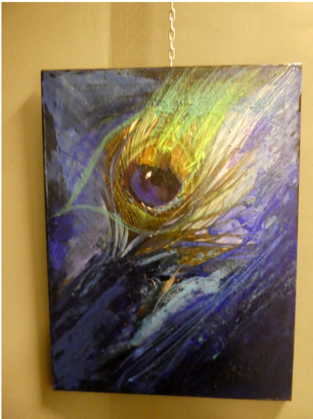
Basha Maryanska, Autoportret, fot. Sylwia Sokołowska.