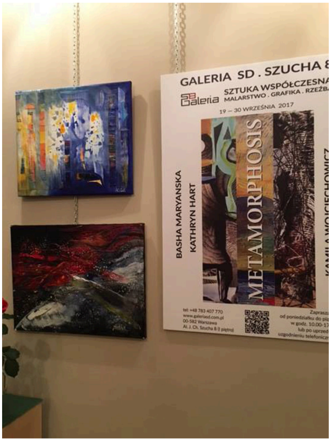
Galeria SD Szucha 8, fot. Basha Maryanska.