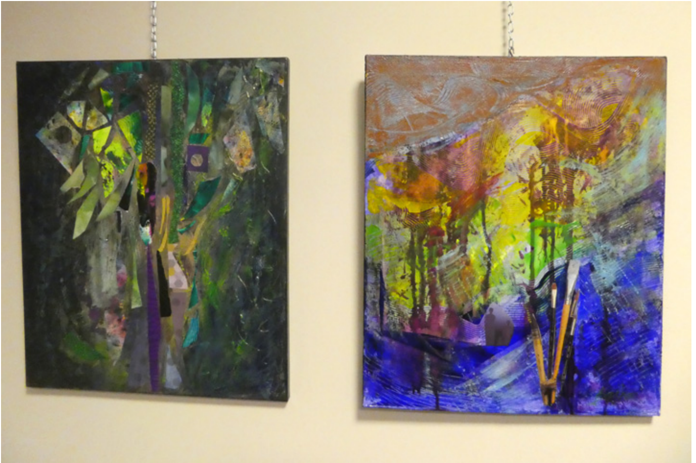
Malarstwo Bashi Maryanskiej.