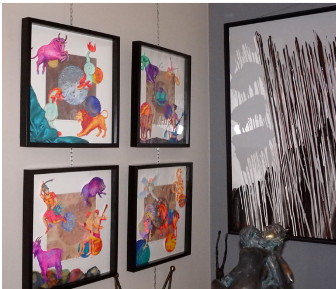
Prace Kamili Wojciechowicz, fot. Kacper Krauze.