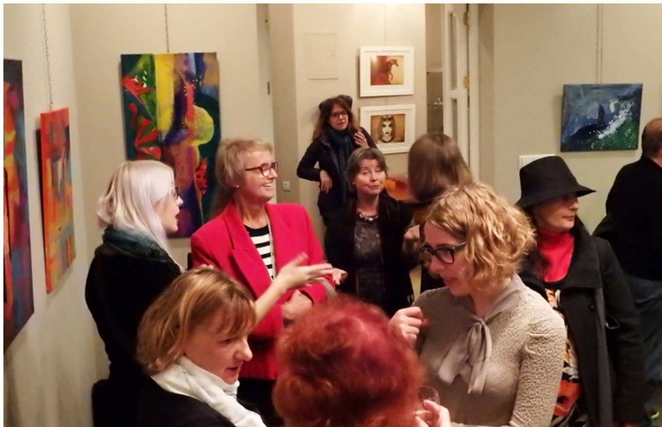
Na wernisaż przybyli miłośnicy sztuki, fot. Kacper Krauze.