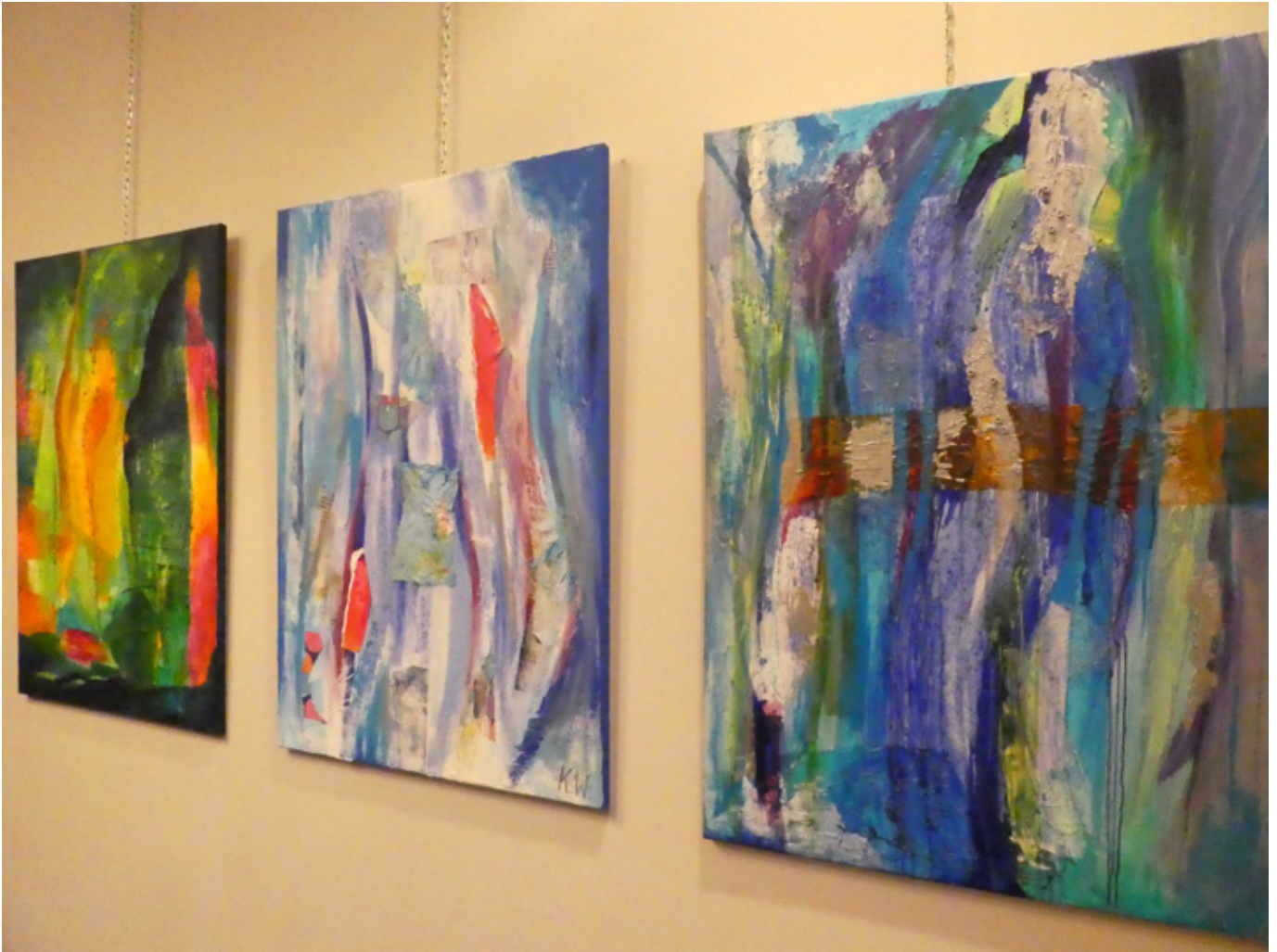
Malarstwo Kamili Wojciechowicz, fot. Sylwia Sokołowska.