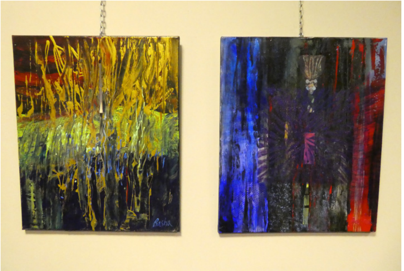
Malarstwo Bashi Maryanskiej, fot. Sylwia Sokołowska.