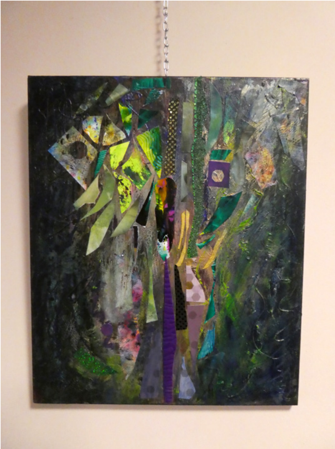
Malarstwo Bashi Maryanek, fot. Sylwia Sokołowska.