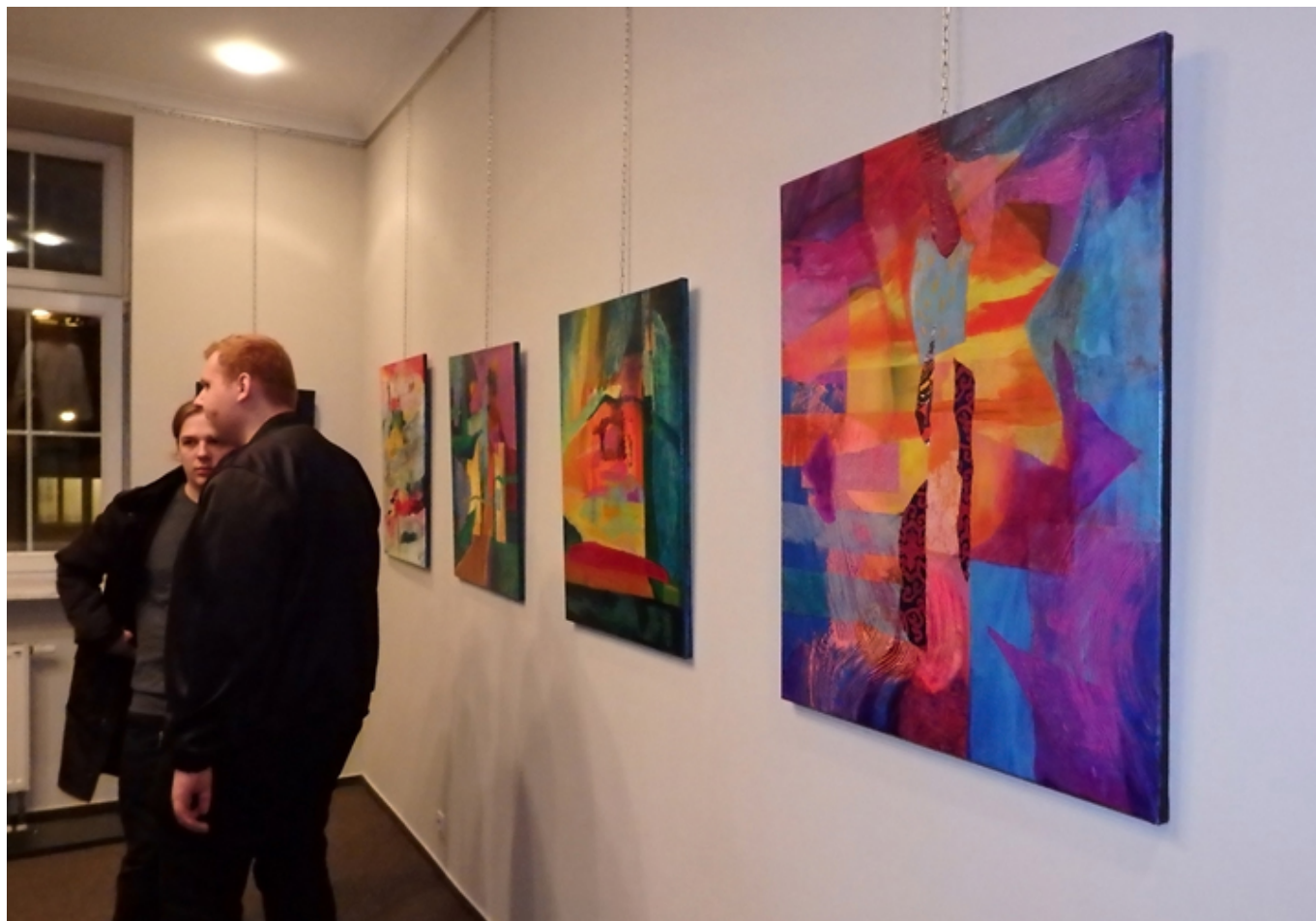
Malarstwo Kamili Wojciechowicz, fot. Kacper Krauze.