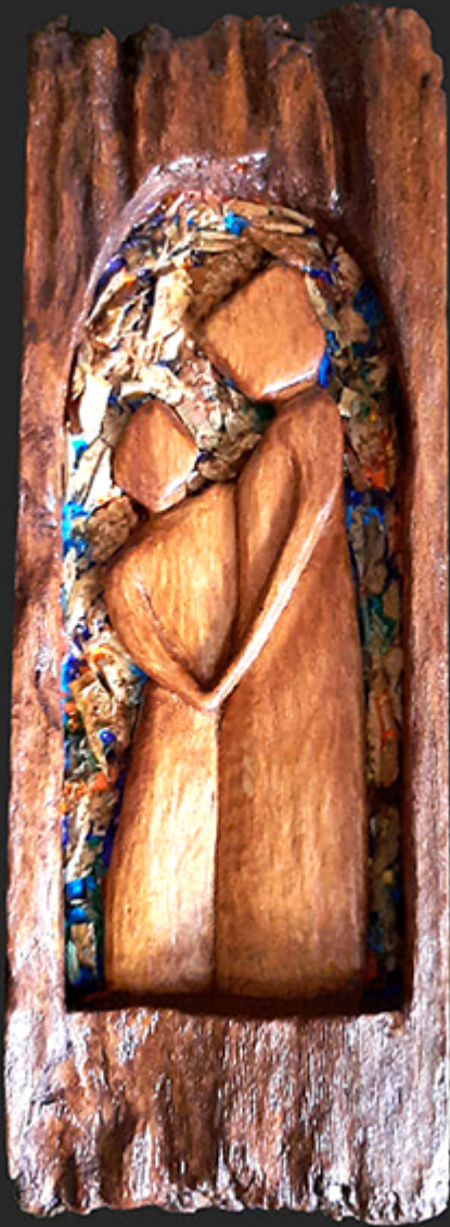
I Love You Mother © Copyright by Czeslaw Sornat