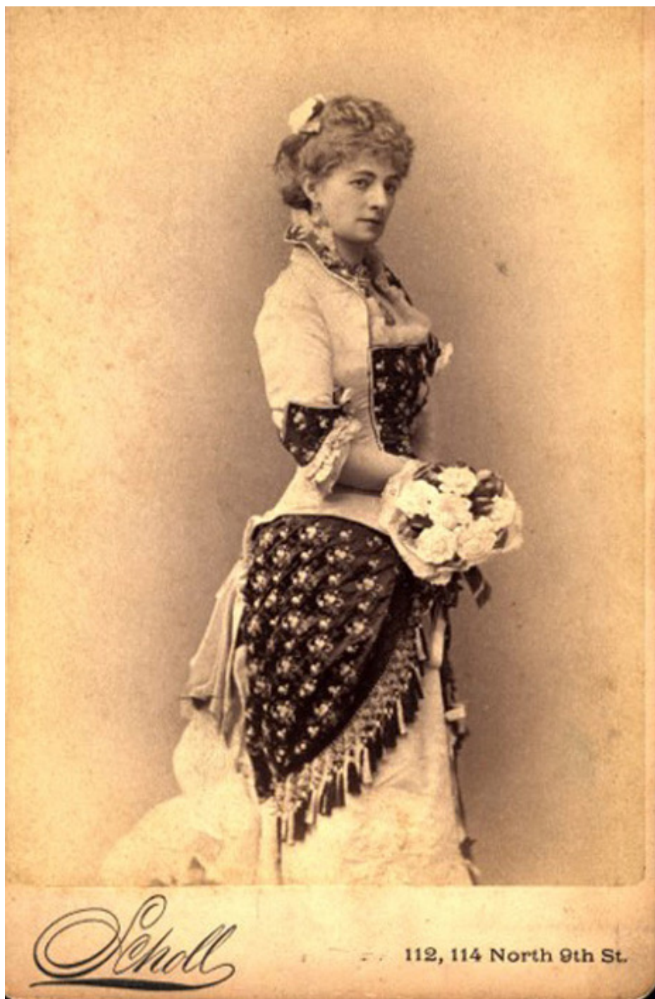
Helena Modrzejewska w „Damie Kameliowej” Aleksandra Dumasa