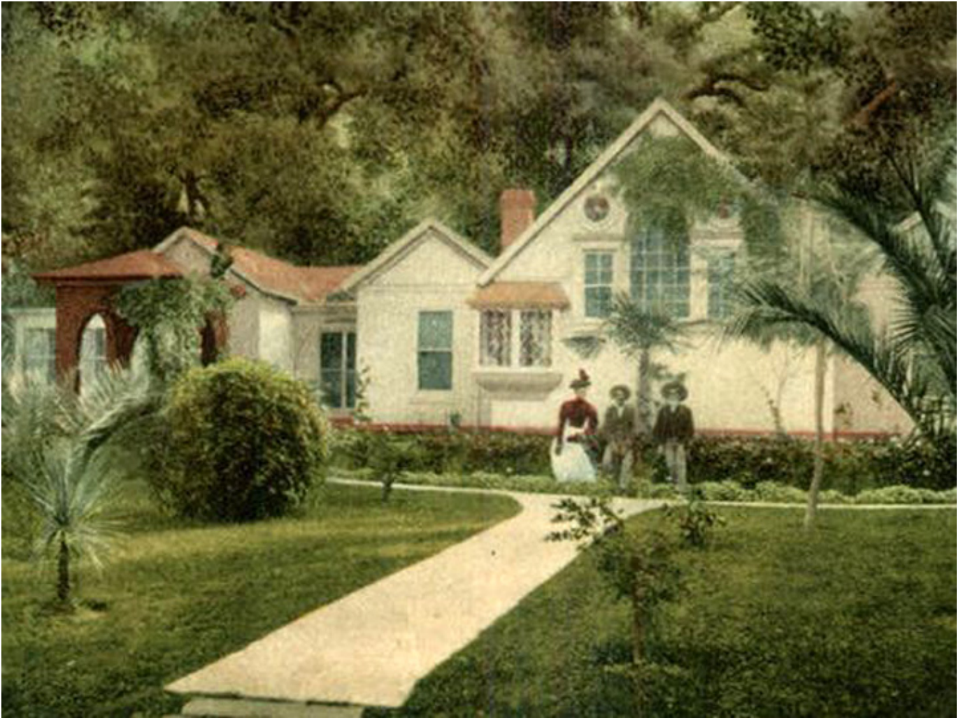
Ranczo Heleny Modrzejewskiej w Arden, pocztówka