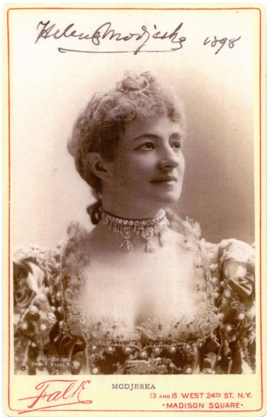
Helena Modrzejewska jako Porcja w „Kupcu weneckim” Szekspira, Nowy Jork, 1898 r., fot. zbiory Muzeum Teatralnego w Warszawie