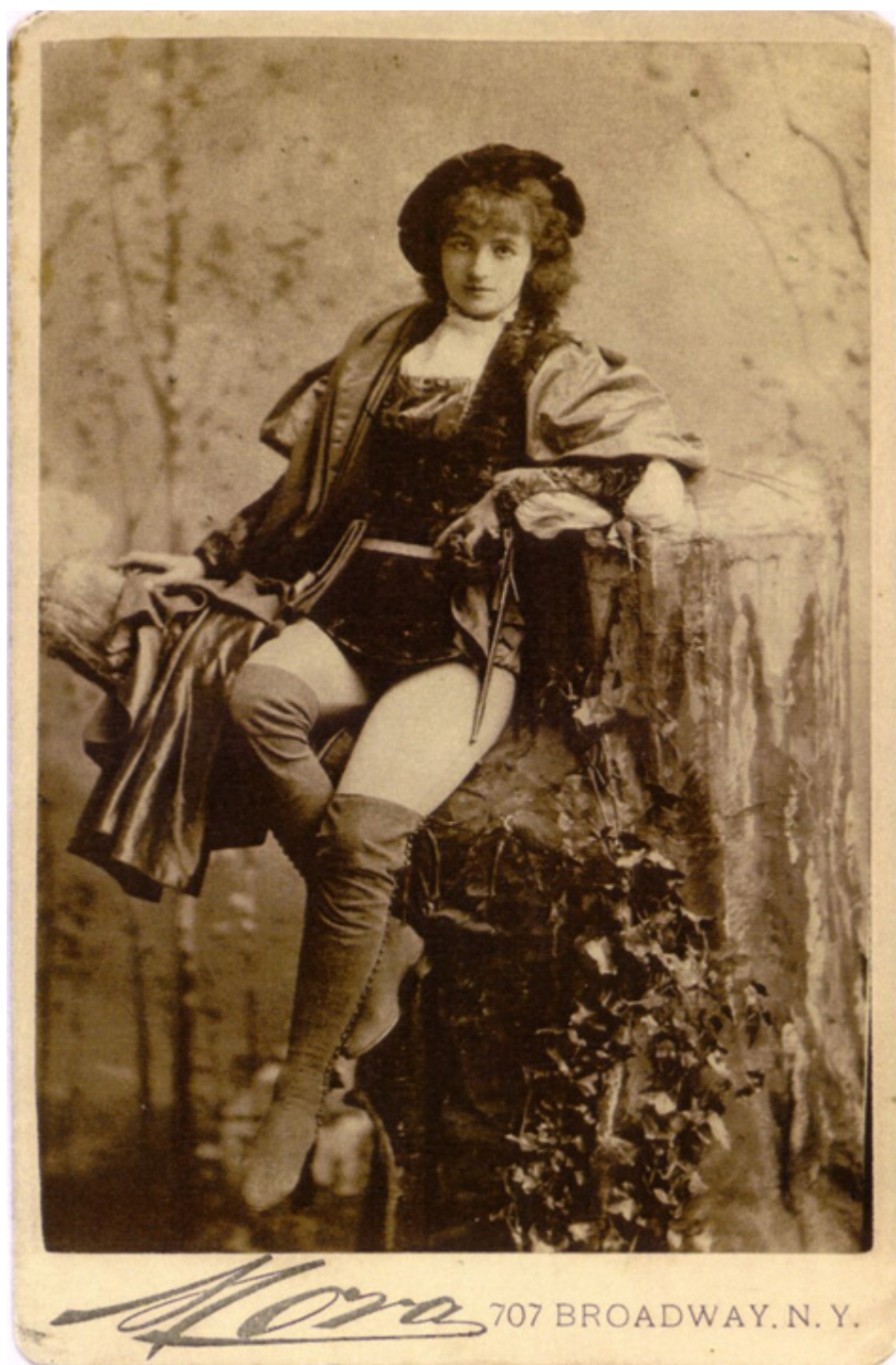
Helena Modrzejewska jako Rozalinda, ze sztuki „Jak wam się podoba” Szekspira, Nowy Jork, 1882 r., fot. zbiory Muzeum Teatralnego w Warszawie