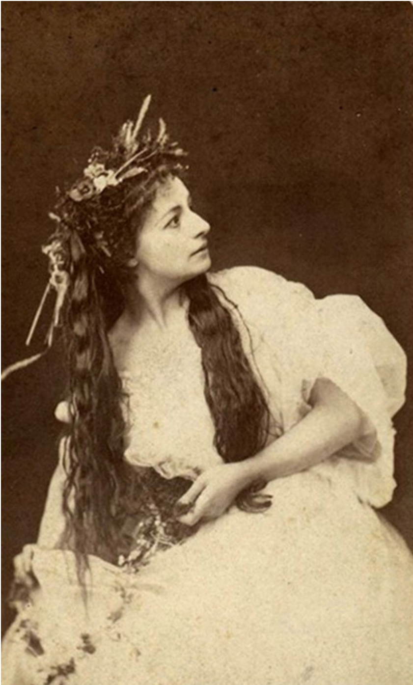
Helena Modrzejewska jako Ofelia w „Hamlecie”