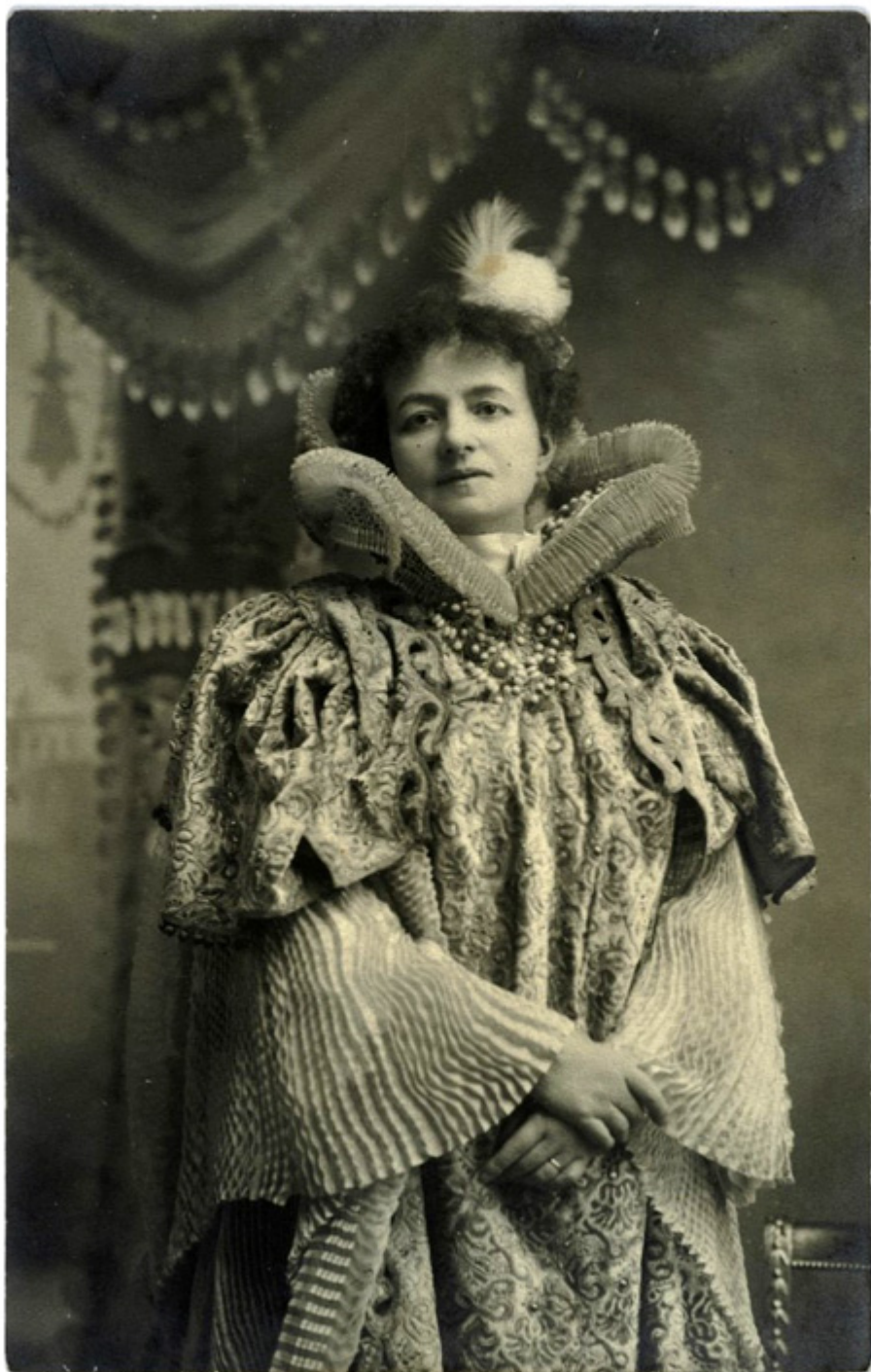
Helena Modrzejewska jako Dama Kamieliowa w sztuce Aleksandra Dumasa, Chicago 1897 r.