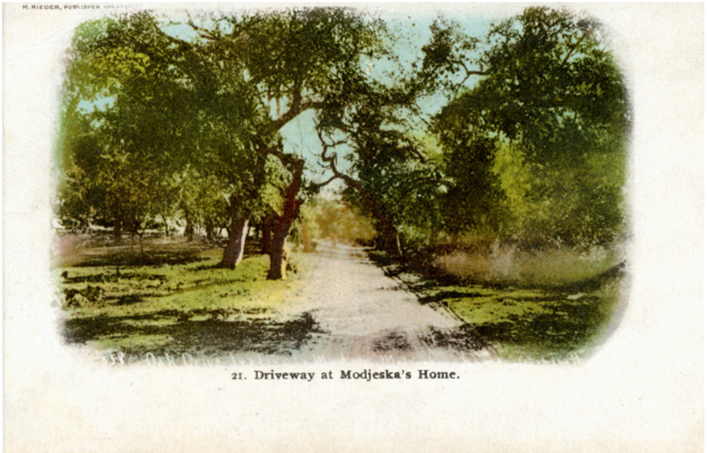
Ranczo Heleny Modrzejewskiej w Arden, pocztówka