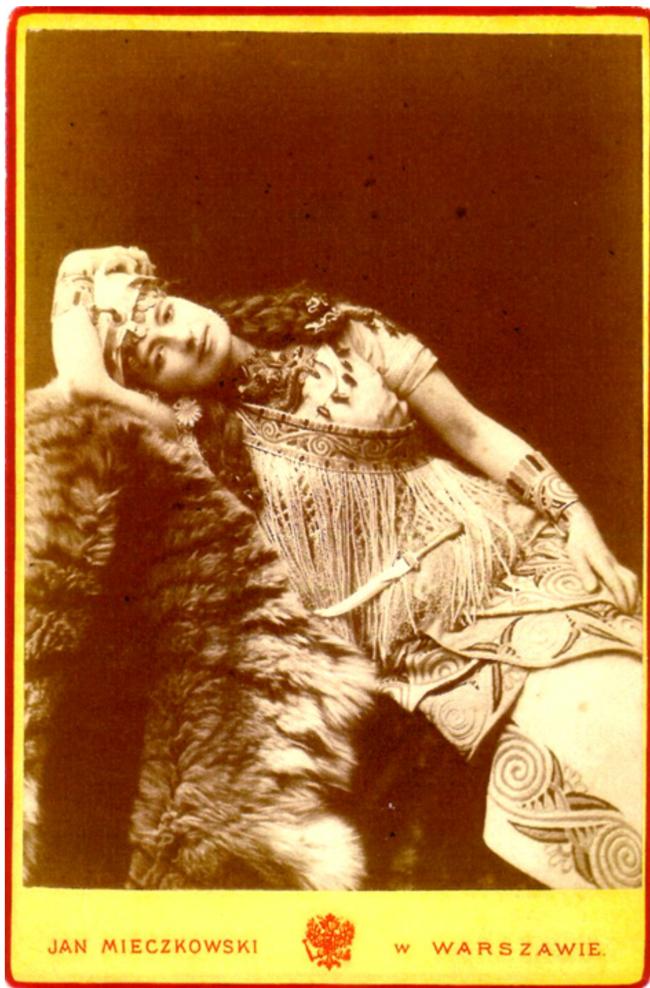
Helena Modrzejewska jako Kleopatra w „Antoniuszu i Kleopatrze”, Pracownia Fotograficzna Jana Mieczkowskiego, fot. Zbiory Muzeum Teatralnego w Warszawie