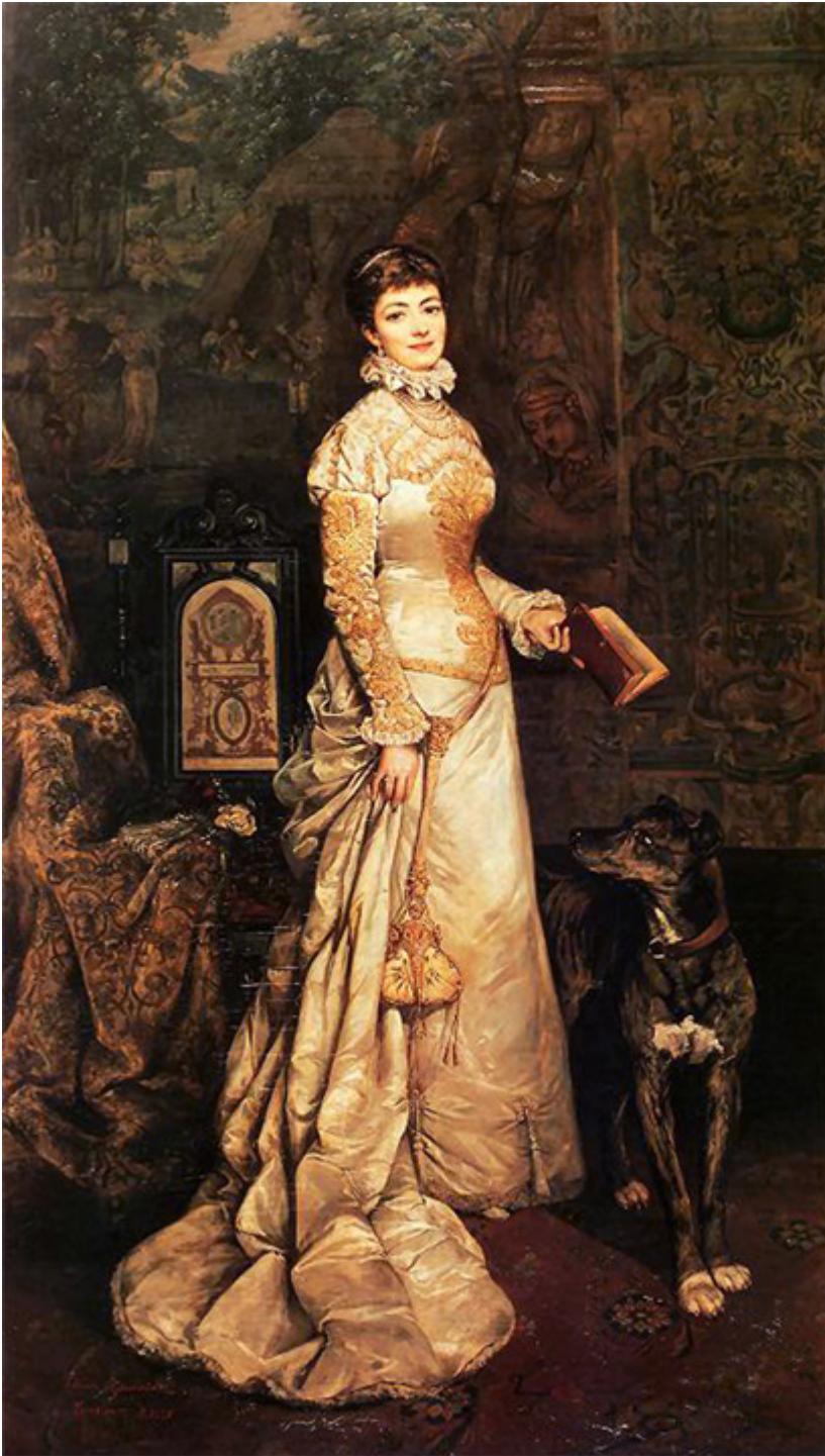
Helena Modrzejewska na portrecie Tadeusza Ajdukiewicza