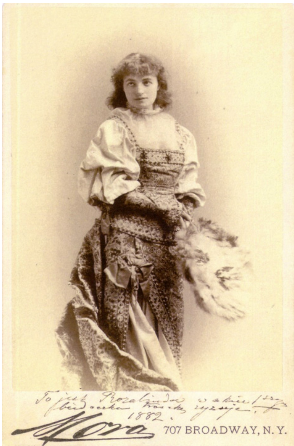
Helena Modrzejewska jako Rozalinda, ze sztuki „Jak wam się podoba” Szekspira, Nowy Jork, 1882 r.